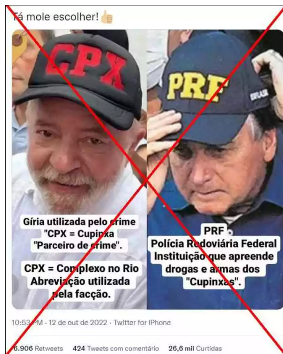
Figura 2 - CPX = Cupincha Parceiro do Crime? 64

Utilizando-se de uma foto do candidato com o referido boné, criadores de informações falsas 62 compartilharam a imagem junto a uma mensagem que associava a sigla ao termo “cupincha, parceiro do crime” ou “comparsa do crime”, como forma de alegar o apoio do candidato Lula ao tráfico de drogas e às facções criminosas. 63