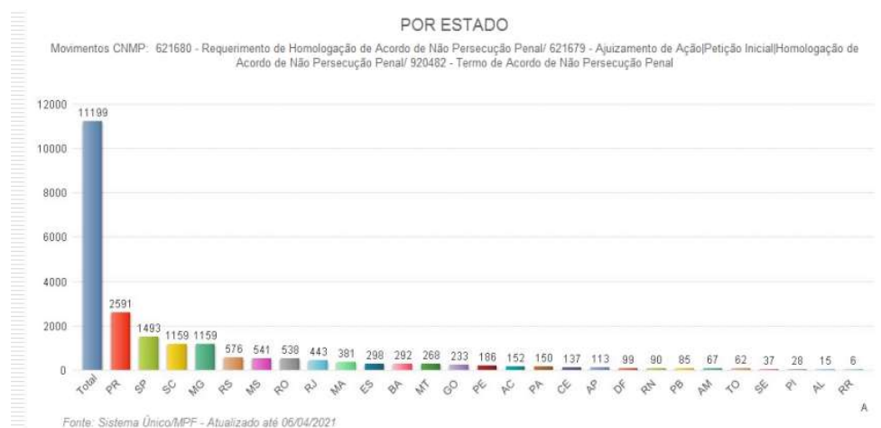
Figura 2 - Acordos de Não Persecução Penal propostos pelo MPF (2021).

Nesse contexto, segundo levantamento do Ministério Público Federal 10 , de 2021 a 2022, já foram realizados mais de 21 mil acordos de não persecução penal, para diversos delitos, não só para o tráfico de drogas.