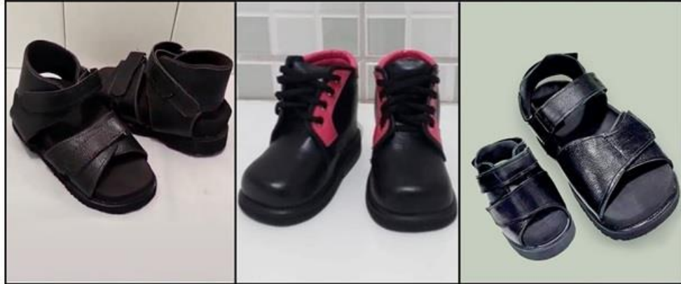
Figura 5 - Calçados ortopédicos: confecções e adaptações oferecidas pelo mercado local