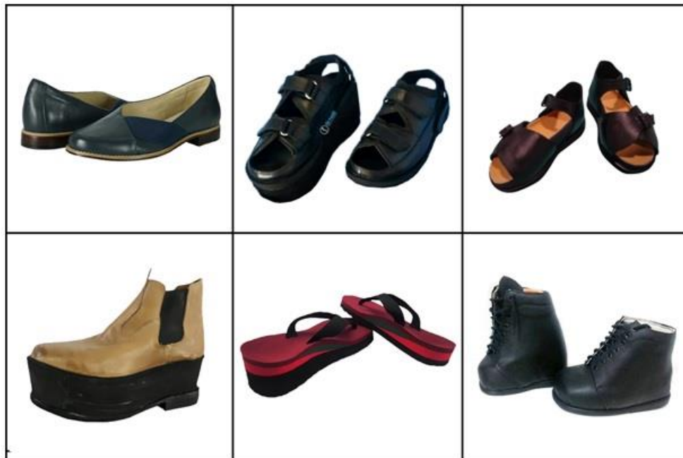
Figura 3 - Calçados ortopédicos: confecções e adaptações oferecidas pelo mercado nacional, referentes ao Quadro 1

Além disso, observa-se, pelo design visual e características ergonômicas do produto final, a ausência de profissionais da moda e/ou do design que pode ser percebida tanto no mercado de calçados ortopédicos nacional como no mercado local. As Figuras 3 e 4 apresentam os produtos oferecidos pelas empresas nacionais listadas no Quadro 1.