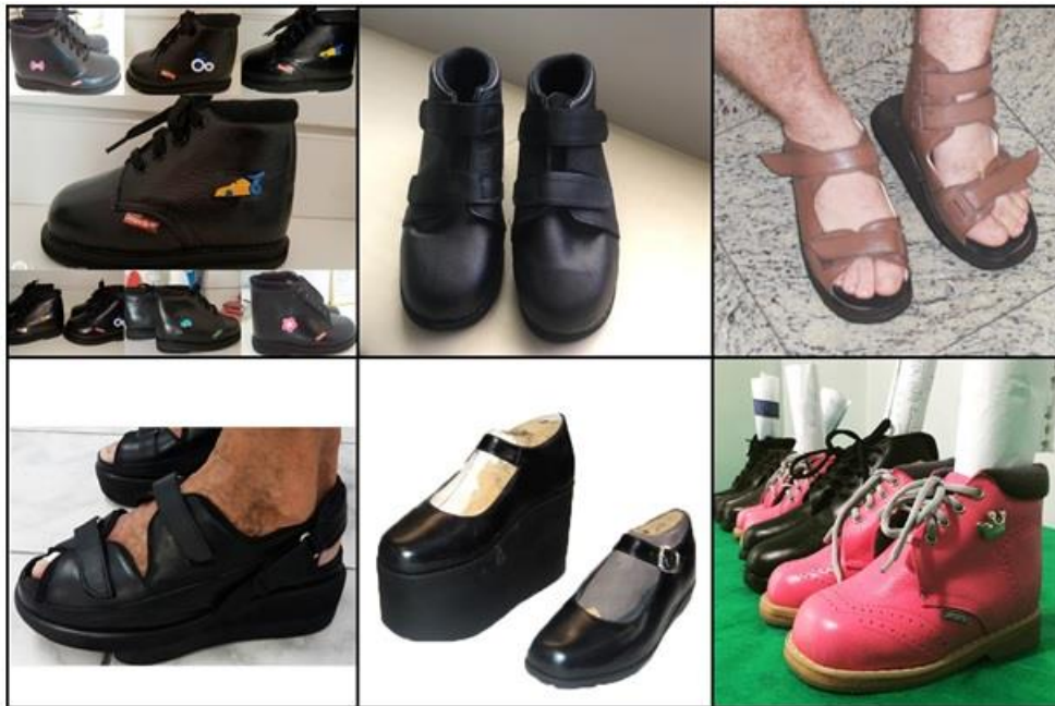
Figura 4 - Calçados ortopédicos: confecções e adaptações oferecidas pelo mercado nacional referentes ao Quadro 2

possível apresentar os calçados, com tais características, ofertados por estas empresas.