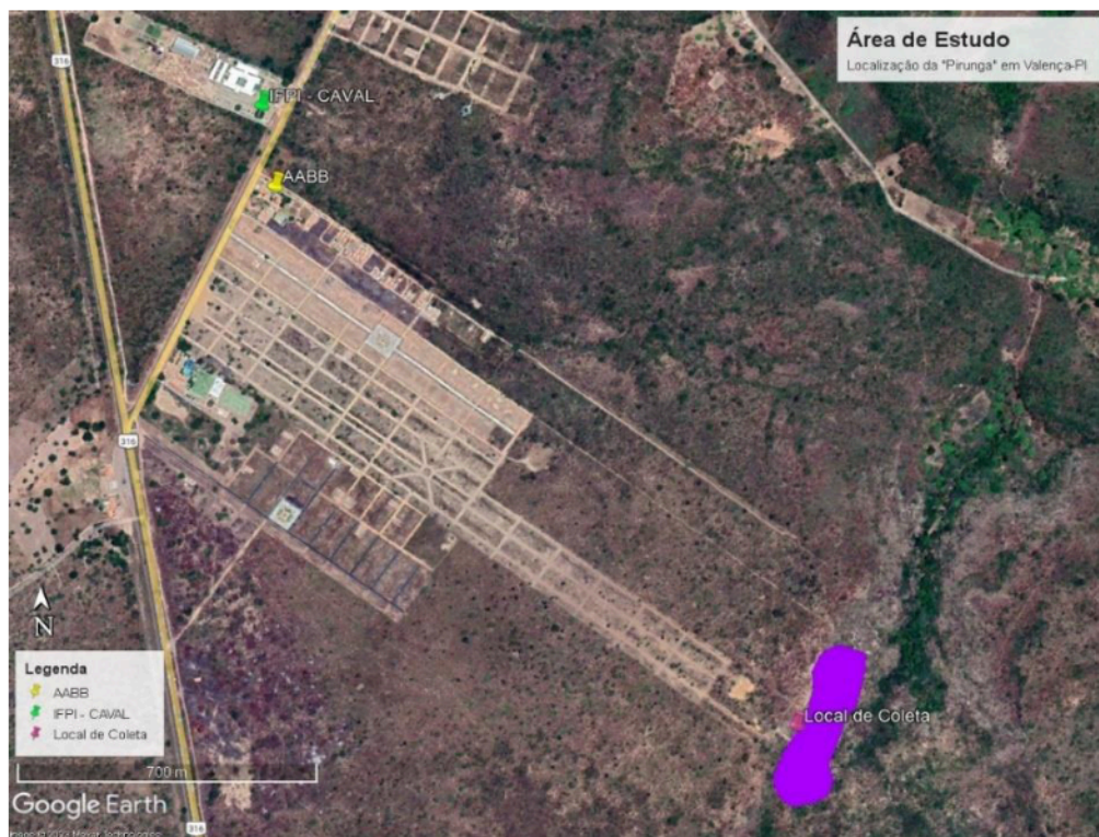
Figura 2: Localização da área de coleta (em roxo) das plantas nativas de “pirunga” no município de Valença, PI.