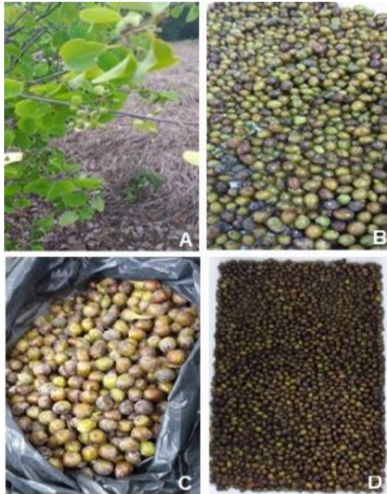
Figura 3: Arbustos de “pirunga” localizado no município de Valença, Piauí (A) e os diferentes estágios de maturação do fruto (B, C e D).