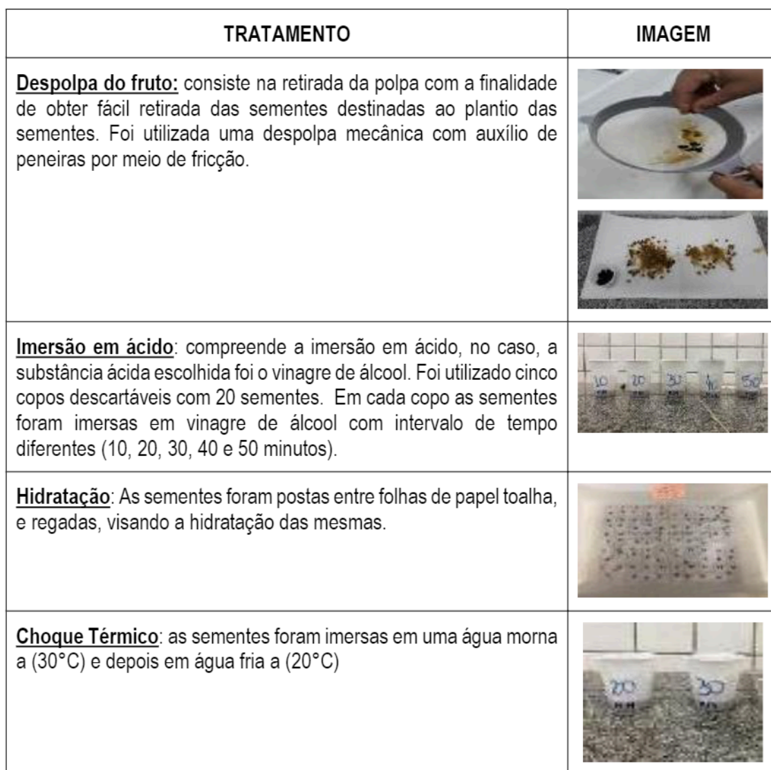
Quadro 1: Tratamentos para quebra de dormência aplicadas.