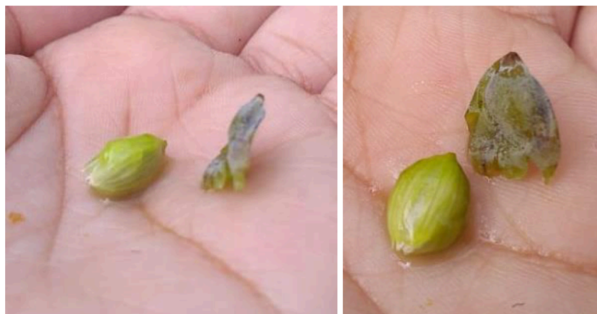
Figura 4: Polpa e semente do fruto da “pirunga” coletadas no município de Valença, Piauí.