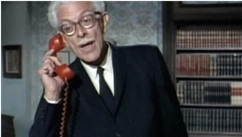
Figura 7 – Ator Alan Napier - Batman (série)

Fonte: Ator Alan Napier interpretando o mordomo Alfred Pennyworth na série de TV. Imagem retirada de: https://whatculture.com/film/batman-every-live-action-alfred-pennyworth-ranked-worst-to-best?page=4 . Acesso em 13/09/2023.