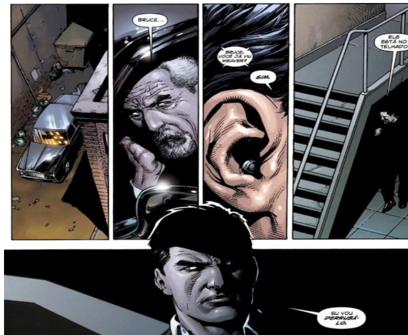
Figura 16 – Habilidades investigativas de Alfred Pennyworth

Fonte: Batman – Terra Um em 02 de maio de 2018. Imagem retirada da Batman – Terra Um. Dc Comics, 2018, p. 58. Acervo pessoal.