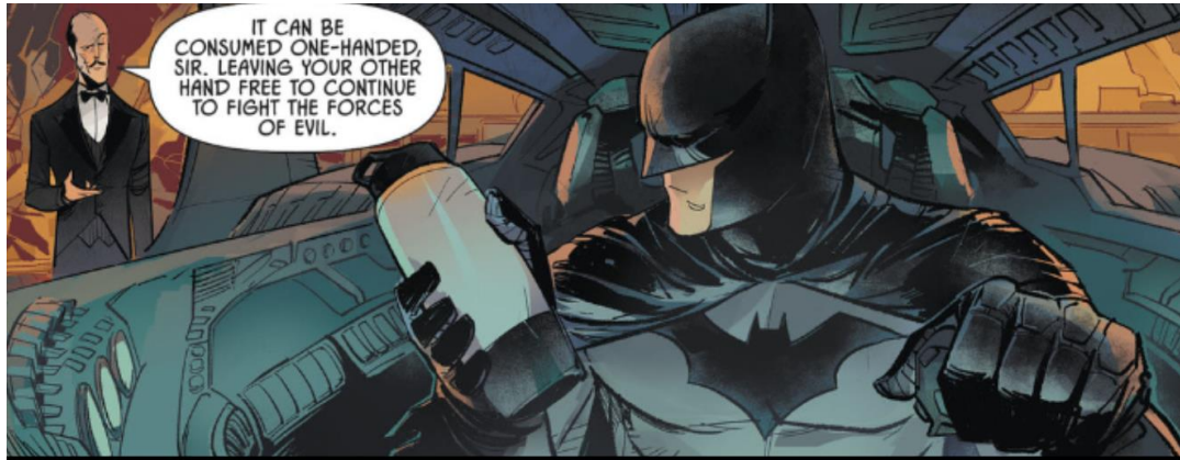
Figura 19 – Habilidades de logística e praticidade

Fonte: Batman Annual #03 em 12 de dezembro de 2018. Imagem retirada da HQ Batman Allies: Alfred Pennyworth (Batman (1940-2011)). Dc Comics, 2018, p. 5. Acervo pessoal.