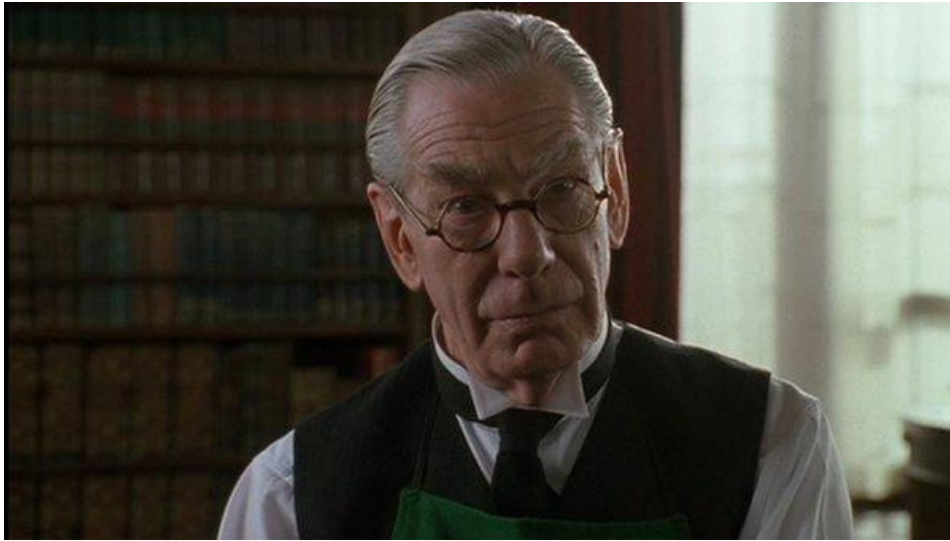
Figura 8 – Ator Michael Gough

Fonte: Ator Michael Gough interpretando o mordomo Alfred Pennyworth na trilogia de 1989-1997 do Diretor Tim Burton. Imagem retirada de: https://whatculture.com/film/batman-every-live-action-alfred-pennyworth-ranked-worst-to-best?page=10 . Acesso em 13/09/2023.