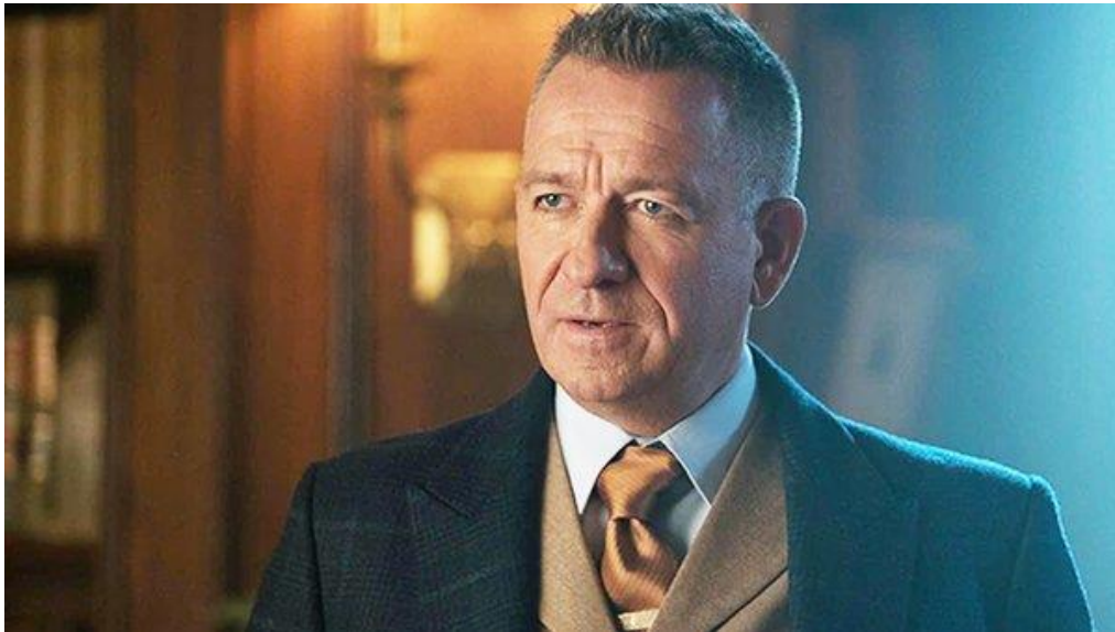
Figura 10 – Ator Sean Pertwee na série Gotham - Warner Bros. Television

Fonte: Ator Sean Pertwee - interpretando o mordomo Alfred Pennyworth no seriado GOTHAM. Imagem retirada de: https://whatculture.com/film/batman-every-live-action-alfred-pennyworth-ranked-worst-to-best?page=5 . Acesso em 15/09/2023.