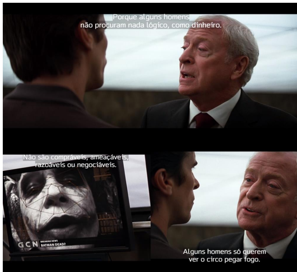
Figura 23 – Alfred aconselha Bruce Wayne.