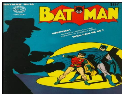
Figura 1- Capa da HQ Batman #16