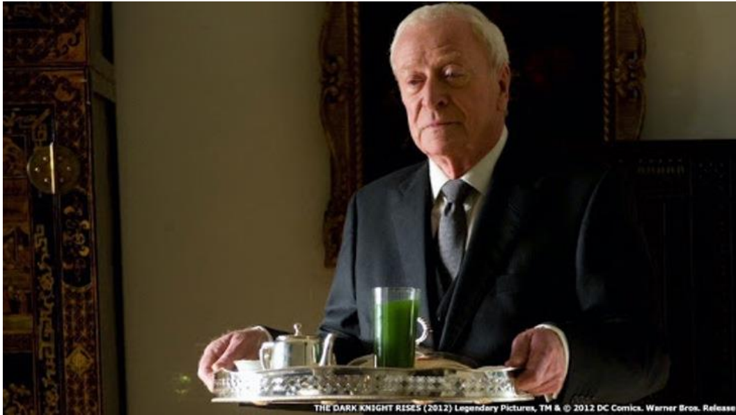
Figura 9 – Ator Michael Cane na trilogia Batman de Christopher Nolan

Fonte: Ator Michael Cane interpretando o mordomo Alfred Pennyworth. Imagem retirada de: https://www.upsocl.com/muvi/batman-es-una-de-las-mejores-cosas-que-he-hecho-dijo-michael-caine-el-mejor-alfred-de-la-historia/ . Acesso em 13/09/2023.