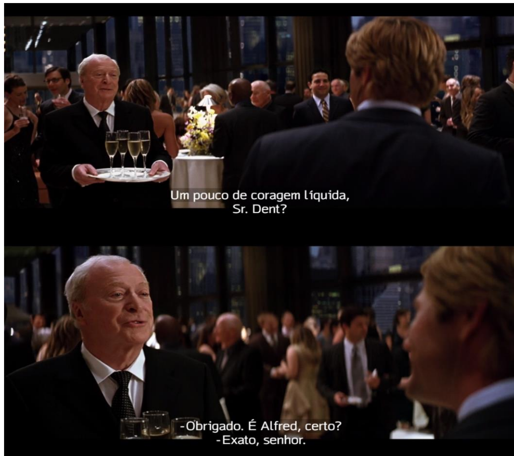
Figura 24 – Alfred recepciona Harvey Dent