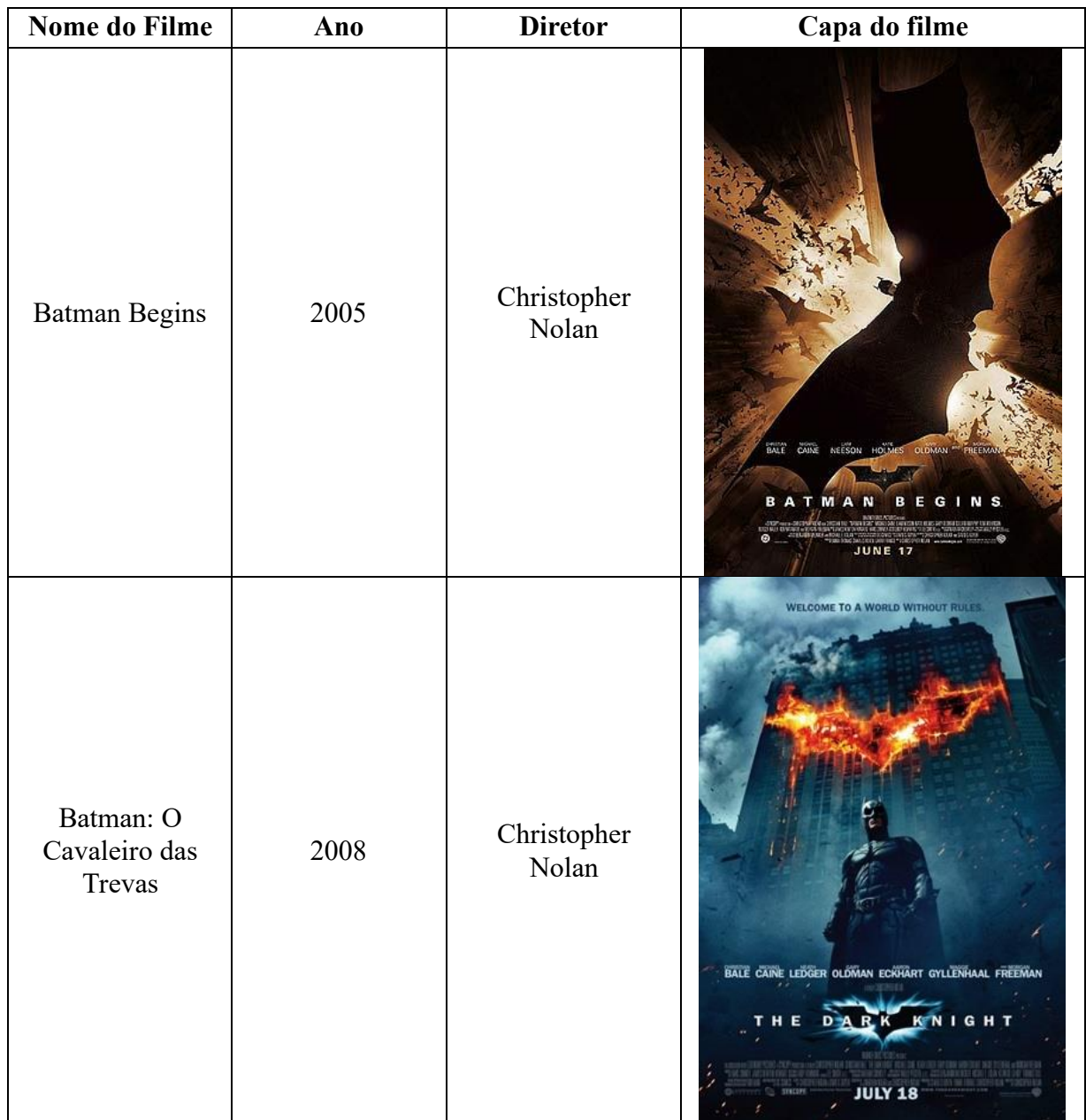
Quadro 1 – Relação de filmes do universo cinematográfico do Batman que serão analisados