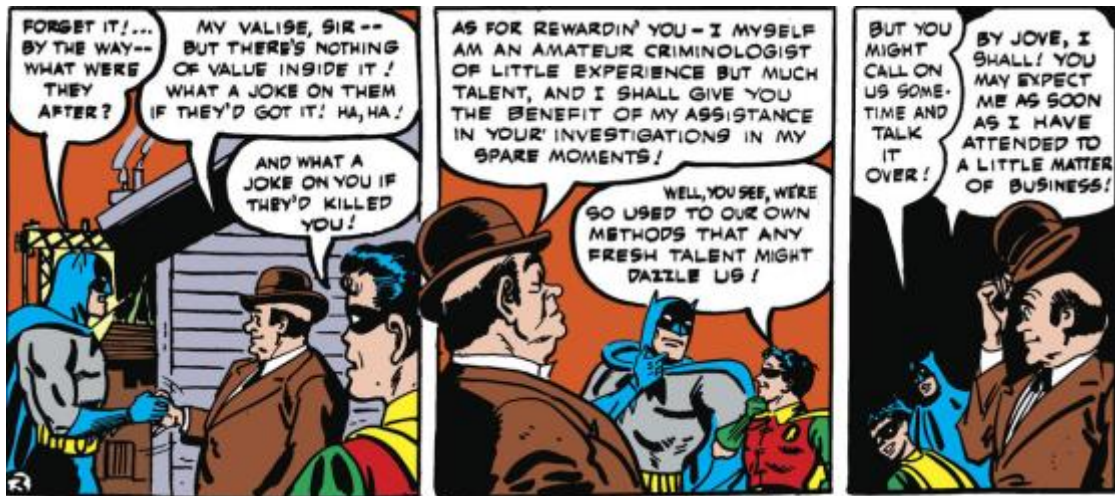
Figura 3– Apresentação de Alfred como Criminologista amador

Fonte: Batman #16 em 10 de abril de 1943. Imagem retirada da HQ Batman Allies: Alfred Pennyworth (Batman (1940-2011). Dc Comics, 2020, p.7. Acervo pessoal.