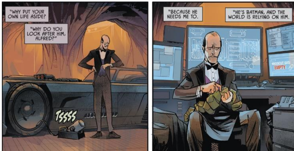
Figura 18 – Habilidades operacionais nos equipamentos tecnológicos do Batman