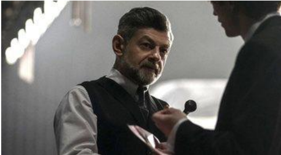
Figura 13 – Ator Andy Serkis em The Batman – 2022 – Warner Bros

Fonte: Ator Andy Serkis - interpretando o mordomo Alfred Pennyworth no filme “The Batman - 2022. Imagem retirada de: https://rollingstone.uol.com.br/cinema/batman-o-que-torna-alfred-pennyworth-diferente-das-versoes-anteriores-andy-serkis-responde/ . Acesso em: 27 set. 2023.