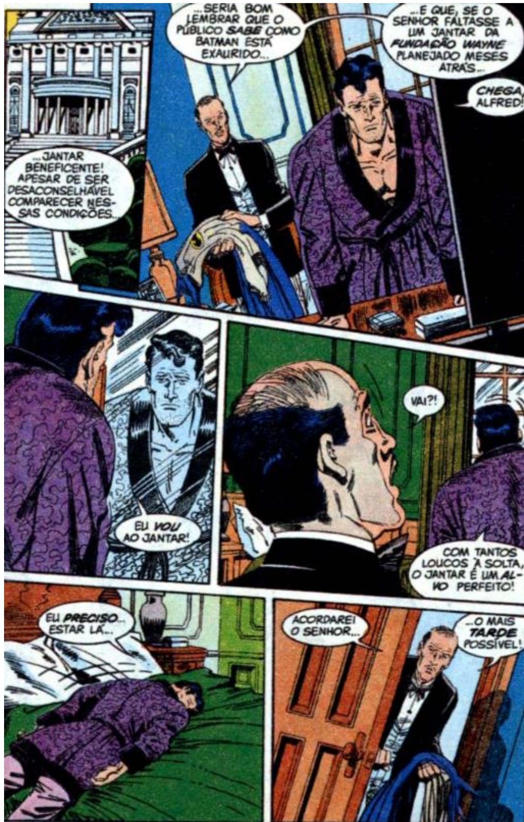
Figura 15 – Assessoria pessoal ao Bruce Wayne