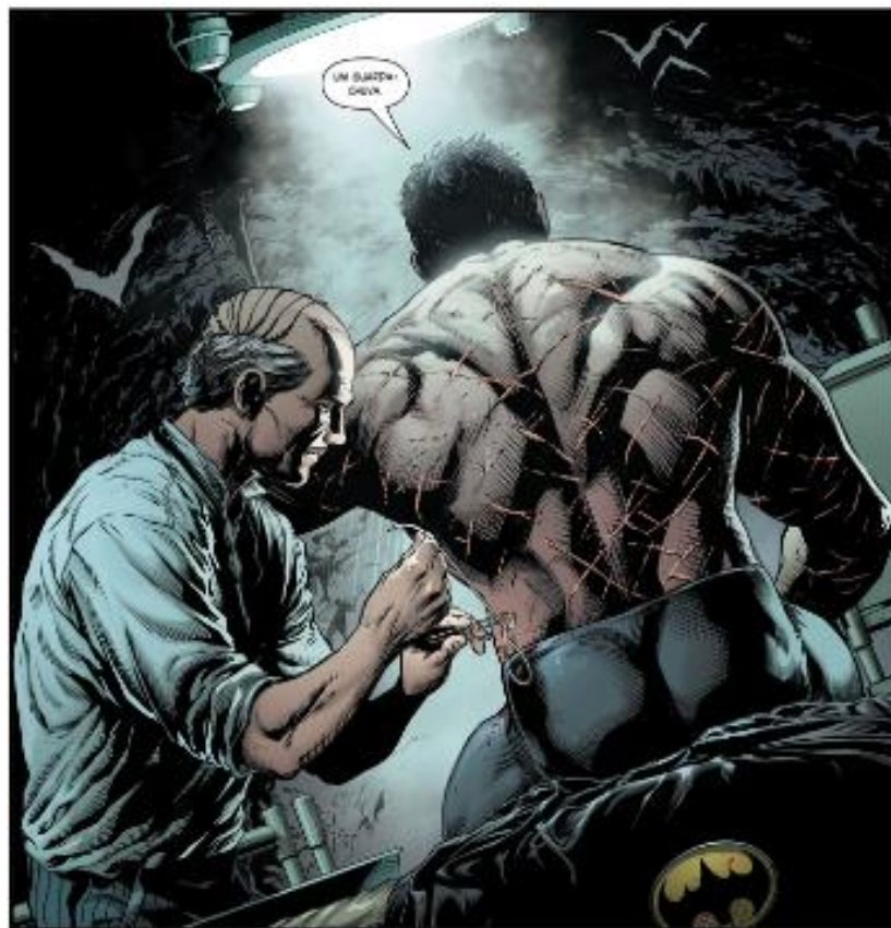
Figura 17 – Demonstração das habilidades médicas de Alfred.

Fonte: Batman – Os Três Coringas em 17 de junho de 2020. Imagem retirada da HQ Batman – Os Três Coringas). Dc Comics, 2020, p. 12. Acervo pessoal.