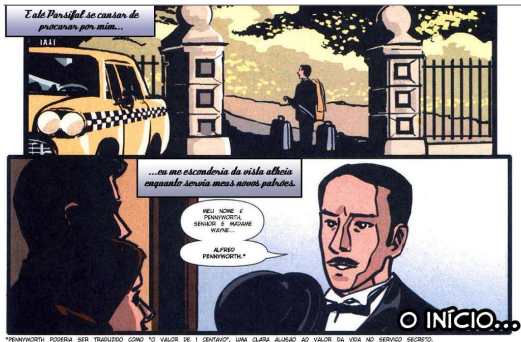
Figura 5 – Um conto de Alfred Pennyworth - Detective Comic #807