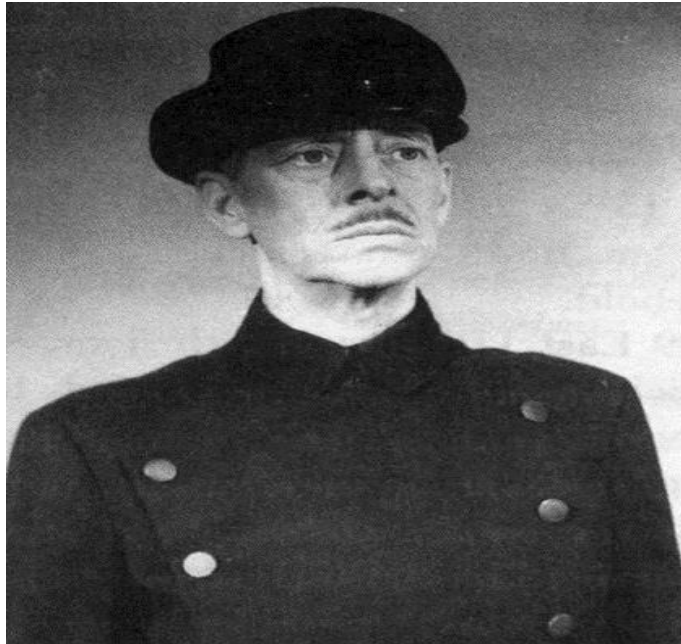
Figura 6 – Ator William Austin - Batman (série de 1943)

Fonte: Ator William Austin interpretando o mordomo Alfred Pennyworth na série de TV (Batman – 1943). Imagem retirada de: https://batman-on-film.com/batman-films/batman-batman-robin-1940s-serials/serials_the-batman-1943_william-austin-alfred/ . Acesso em 13/09/2023.