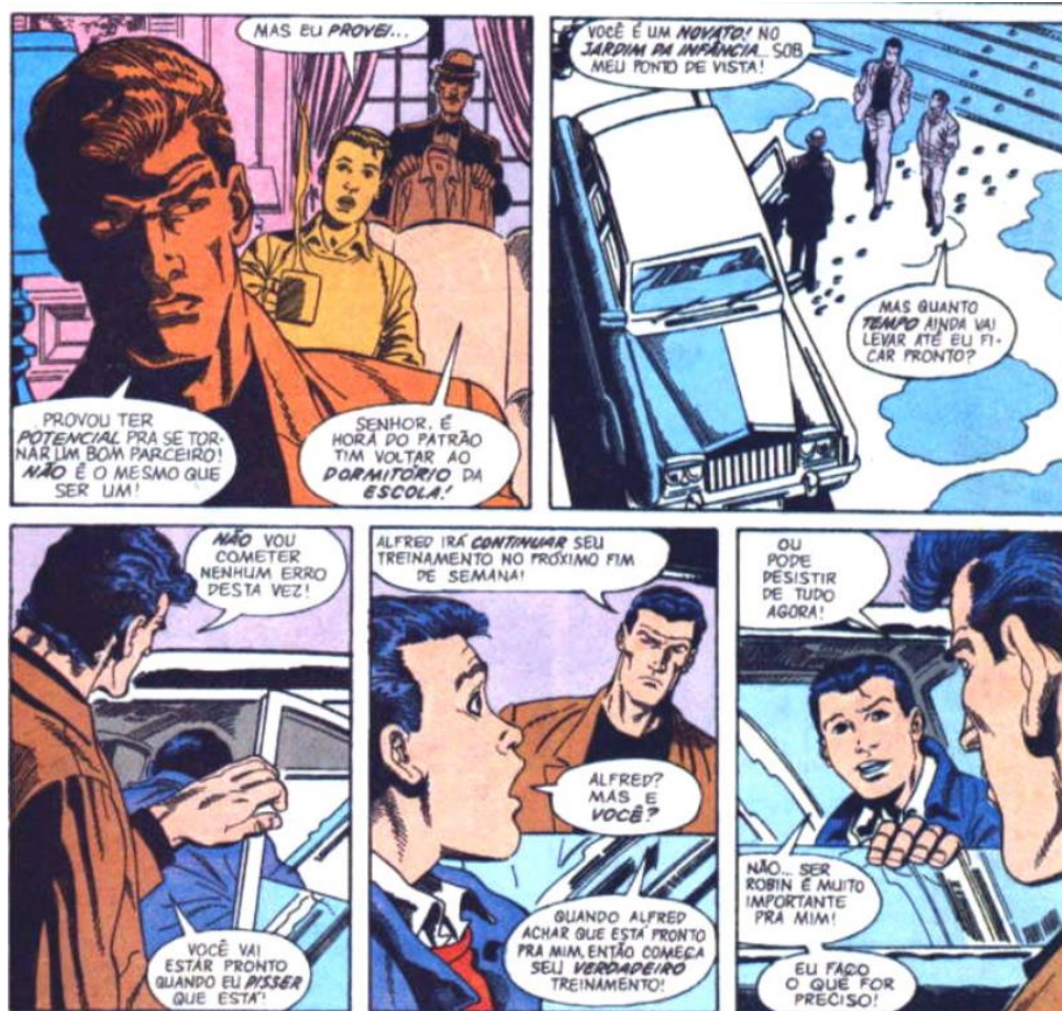
Figura 14 – Habilidades de treinamento de equipes

Fonte: Batman #443 em janeiro de 1990. Imagem retirada da HQ Batman #443. Dc Comics, 1990, p. 63. Acervo pessoal.