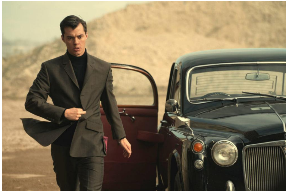
Figura 12 – Ator Jack Bannon em Pennyworth – 2019 – HBO MAX

Fonte: Ator Jack Bannon - interpretando o ex-soldado Alfred Pennyworth no seriado "Pennyworth". Imagem retirada de: https://gogglr.my/pennyworth-a-conversation-with-jack-bannon/ . Acesso em 26/09/2023.