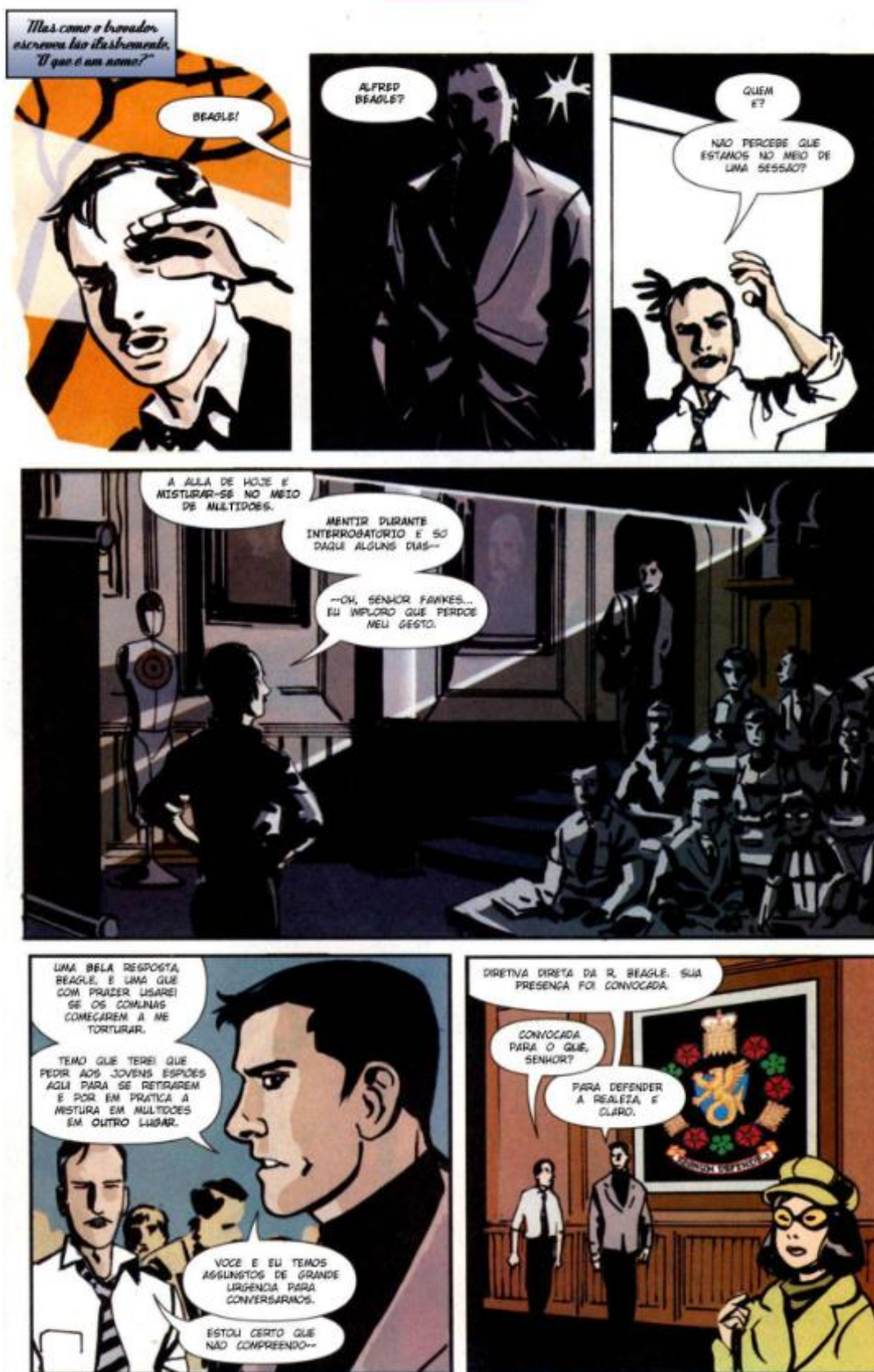
Figura 4 – Um conto de Alfred Pennyworth - Detective Comic #806