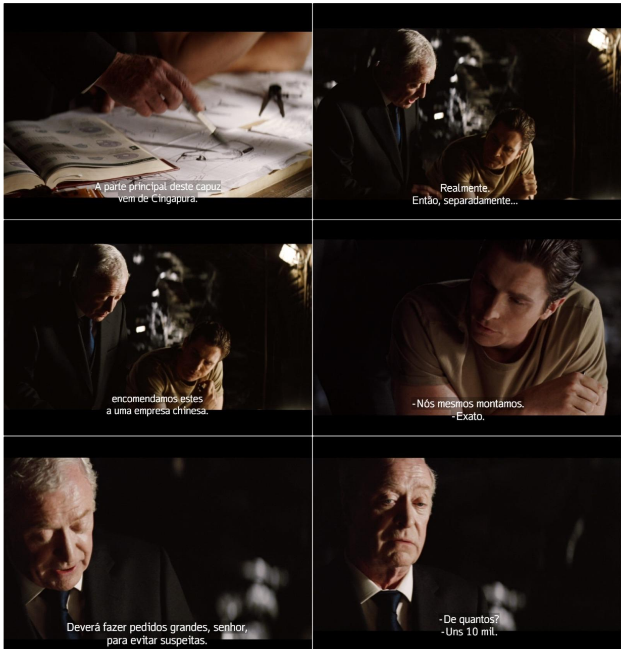
Figura 21 – Alfred detalha compra de equipamentos para o Bruce Wayne