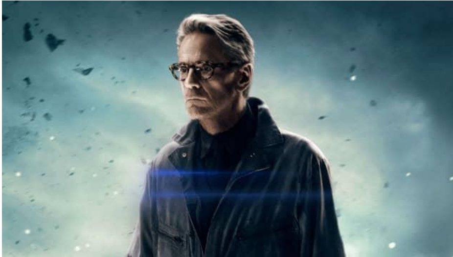
Figura 11 – Ator Jeremy Irons em Liga da Justiça e The Batman (Universo estendido DC)

Fonte: Ator Jeremy Irons - interpretando o mordomo Alfred Pennyworth nos filmes do Universo Estendido da DC (Liga da Justiça e The Batman). Imagem retirada de: https://pt.ign.com/jeremy-irons/37743/feature/jeremy-irons-sobre-o-papel-de-alfred-em-liga-da-justica-e-the-batman . Acesso em 26/09/2023.