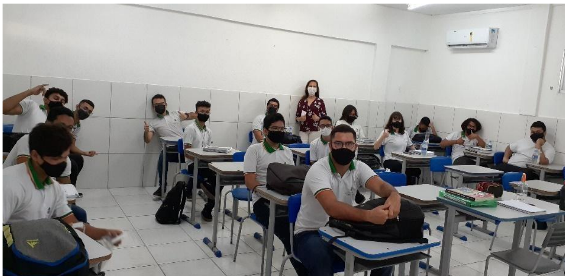
Figura 9 — Sala de aula durante o retorno presencial em setembro de 2021, com 25% da turma.