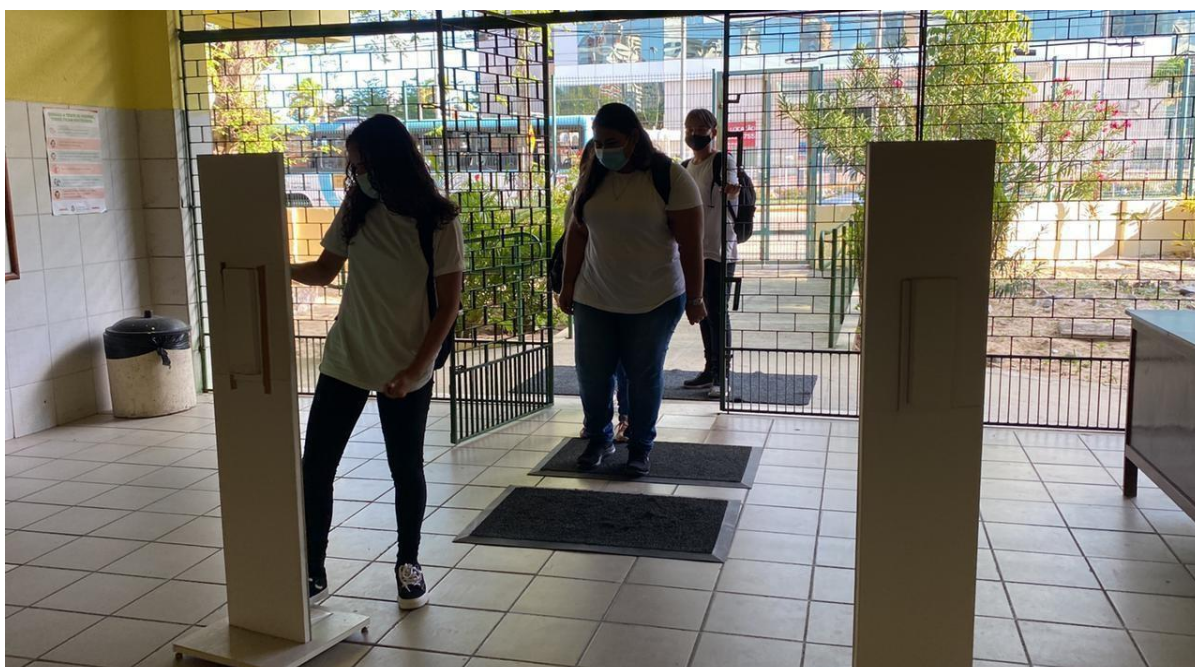
Figura 8 — Estudantes do Ensino Médio integrado ao Ensino Técnico no primeiro dia do retorno às aulas presenciais em 2021.

O retorno contou com a presença de 25% dos estudantes e 100% dos professores(as) em meio período presencial, já que sua modalidade de ensino apresenta aulas em período integral. As demais aulas que compõem o dia letivo foram ministradas de forma assíncrona.