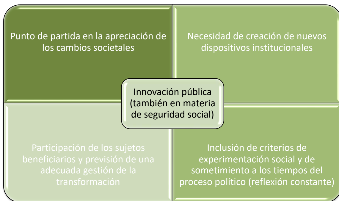
Figura 1 Atributos de la innovación pública