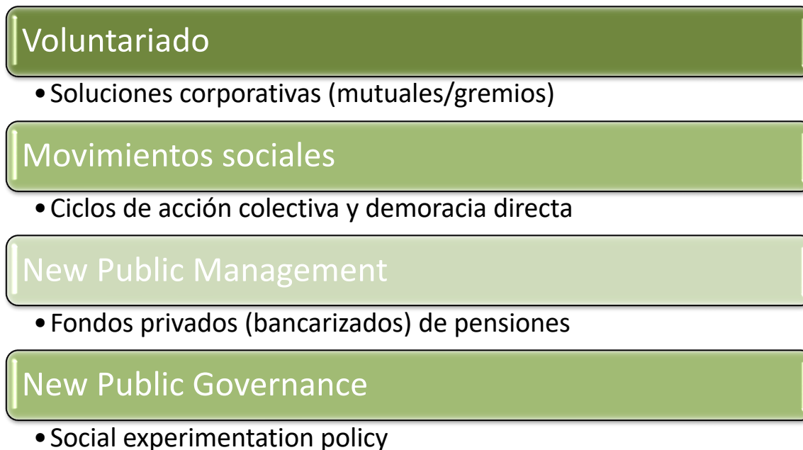
Figura 2 Modos de interacción entre sociedades y estados para la producción de innovación pública