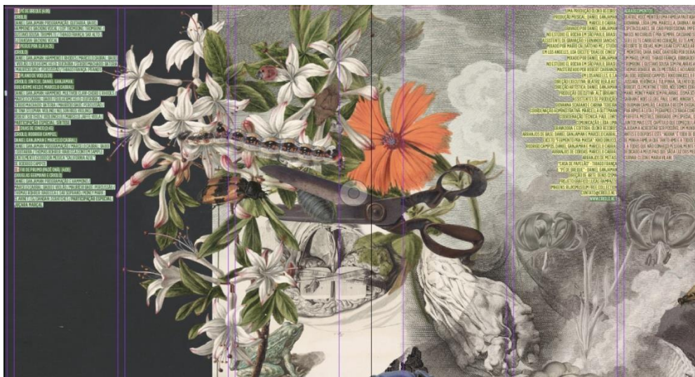
Figura 2: Encarte interior do disco “Convoque seu Buda” (2014), de Criolo