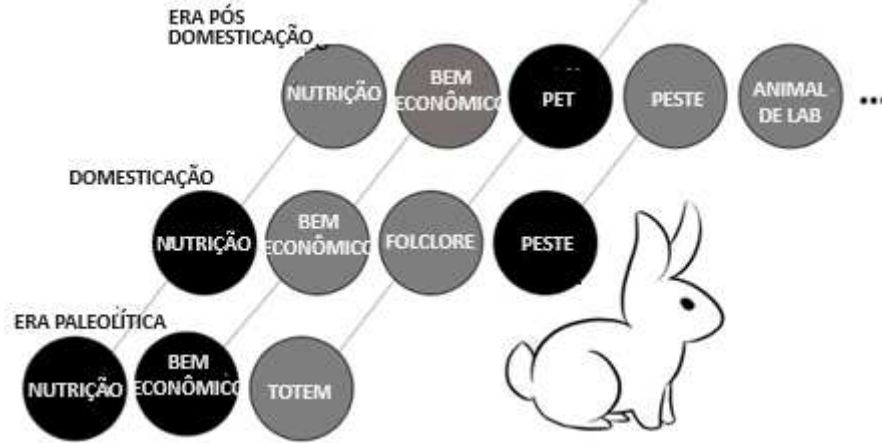
Figura 1 - Papéis sociais sobrepostos dos coelhos ao longo dos tempos (os círculos pretos indicam a função predominante)