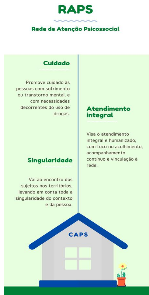
Figura 1 - Rede de Atenção Psicossocial