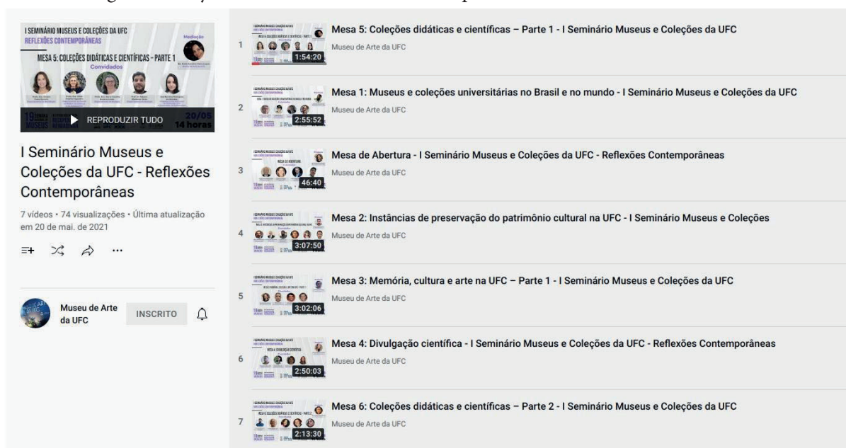
Imagem 1 - Playlist de vídeos do Seminário disponível no Canal do Mauc no Youtube

buscou criar um espaço para identificar, apresentar e difundir as coleções e instituições museológicas, superficialmente conhecidas ou desconhecidas por parcelas da sociedade, sejam aquelas que tenham ou não vínculos institucionais com a UFC.