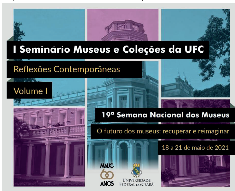
Imagem 2 - Capa do e-book “I Seminário Museus e Coleções da UFC – Reflexões Contemporâneas”