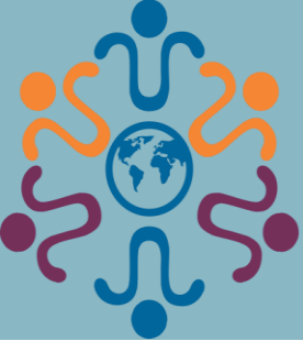
Figura 1: Objetivos de Desenvolvimento Sustentável