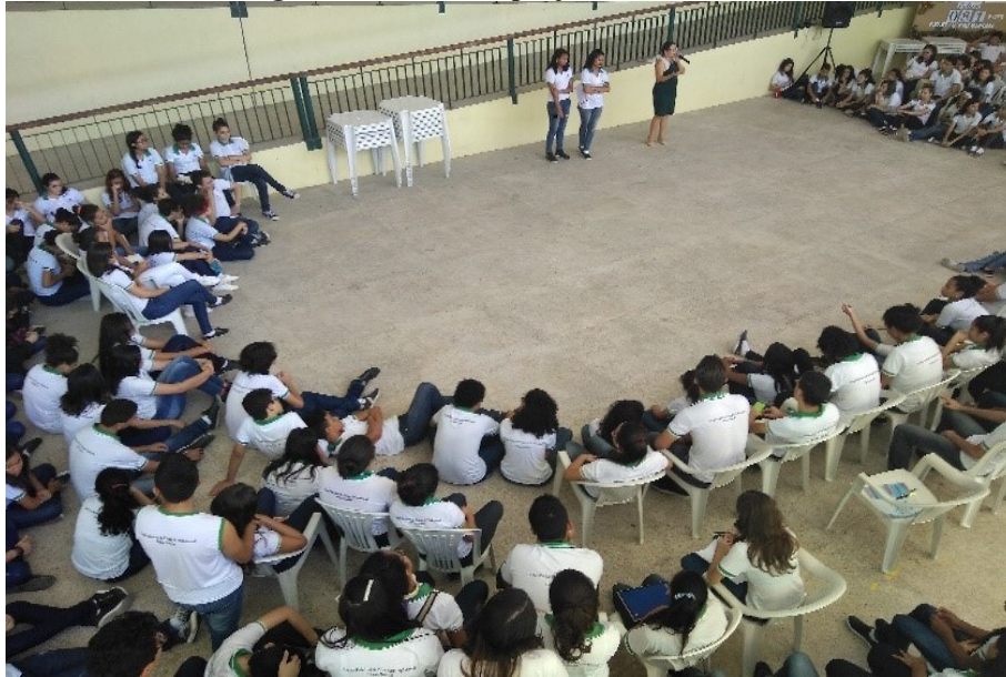
Fig. 3 – Discutindo o projeto com a escola.