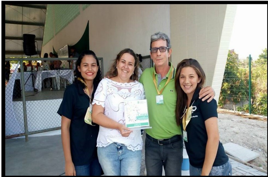
Fig. 4 – 1º lugar na etapa regional.