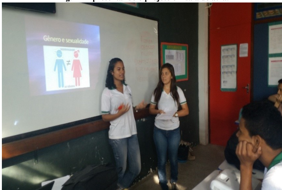
Fig. 2 – Apresentando o projeto em sala de aula.