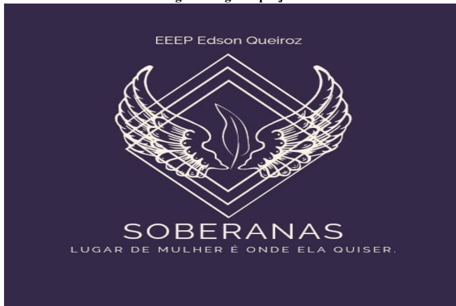
Fig. 1 – Logo do projeto.