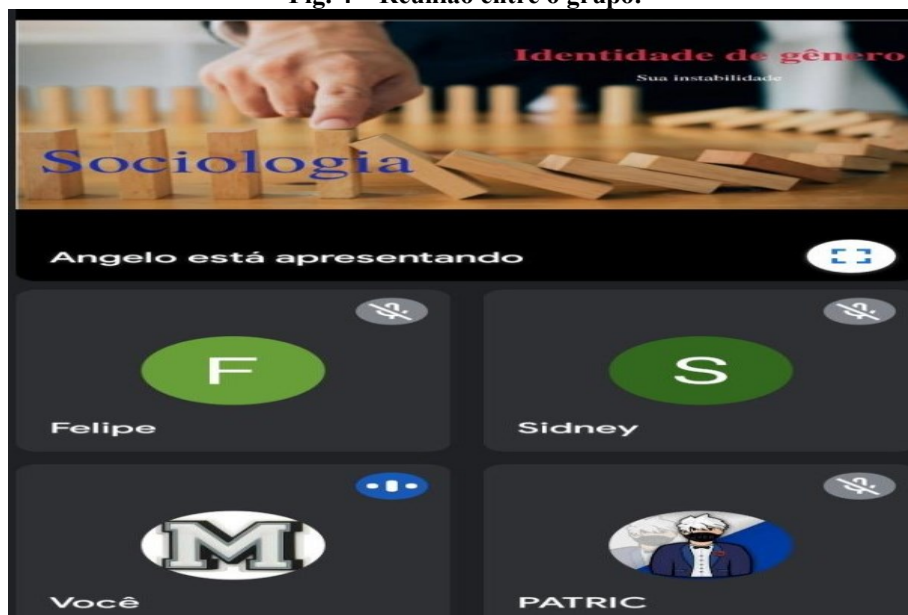
Fig. 4 – Reunião entre o grupo.