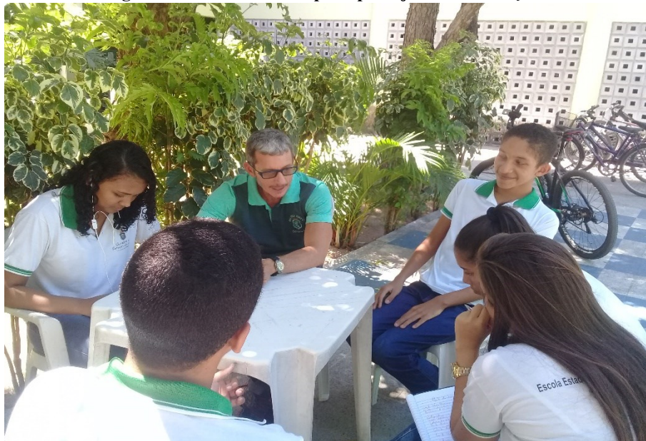
Fig. 1 – Primeira reunião para planejamento das ações.