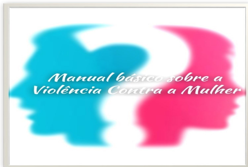
Fig. 3 – Apostila pedagógica utilizada nas oficinas.