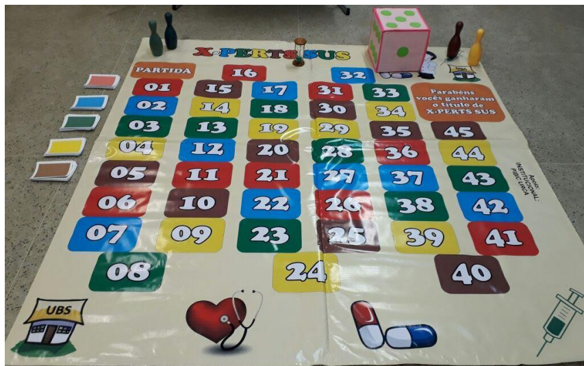
Figura 2: Componentes estruturais do Jogo Educativo de Tabuleiro sobre Ensino de Saúde Coletiva XPERTS-SUS.

representavam as seções (correspondendo, respectivamente, a 20 perguntas e/ou comandos de cada seção do jogo); quatro pinos nas cores amarelo, verde, azul e marrom, com o propósito de representar os participantes; e uma ampulheta, que contabilizava o tempo de 1 minuto (Figura 2).