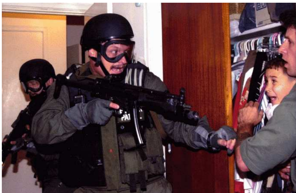
Figura 2: Refugiado cubano Elian Gonzalez e Donato Dalrymple, um dos dois homens que resgataram o menino do mar, em um closet enquanto agentes federais entram na casa dos parentes de Elian. Foto: Alan Diaz, Abril, 2000. Fonte: Prêmio Pulitzer.

Em dado momento, os agentes federais invadiram a casa onde estava o menino Elian, derrubaram a porta e apontaram as armas para Dalrymple, que segurava o menino.