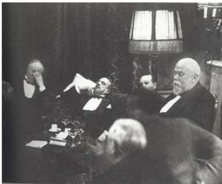
Figura 1: Bastidores da segunda conferência de Haia. Foto: Erich Salomon (1930). Fonte: Wikipédia.

Salomon foi, sem dúvida, um dos pioneiros do fotojornalismo moderno e o primeiro a adotar o termo fotojornalista, em oposição ao título de foto repórter. Considerado o fundador do fotojornalismo político moderno, Salomon ainda conseguia manipular seu equipamento de maneira única em sua época. Dele, é a célebre foto feita após se infiltrar nos bastidores da segunda conferência de Haia, em 1930, em que flagrou ministros alemães e franceses cochilando enquanto ainda não tinham definido questões sobre a dívida da guerra alemã.