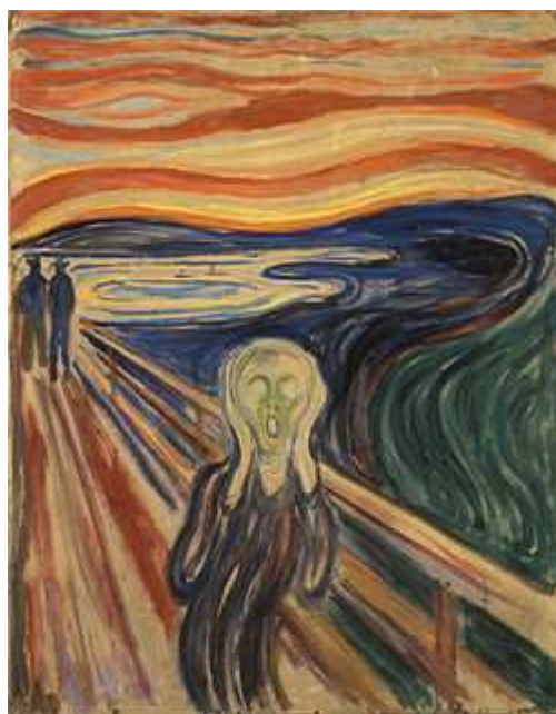
Figura 13: O Grito. Pintura: Edvard Munch, 1893.

A pintura “O Grito” de Edvard Munch possui o elemento visual central que evidencia o pathos da dor, conflito, ansiedade e sofrimento. Elementos estes que se encontram também na fotografia de Houssaine. Para além, tem-se a própria gestualidade da figura tanto na pintura quanto na fotografia.