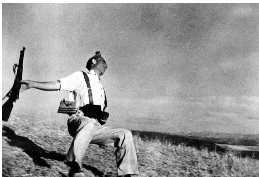
Figura 9: A morte de um miliciano. Foto: Robert Capa, 1936. Fonte: Wikipédia.

Utilizando-se novamente da análise de Aby Warburg, apresenta-se a fotografia de Robert Capa “A morte de um miliciano”. Tal fotografia compreende o evento histórico da guerra civil espanhola e possui um elemento central que dá vida à ideia de dor e sofrimento. A gestualidade e a expressão no rosto do personagem liga-se à morte do fotógrafo Kenji, concretizando o pathos da violência e da dor. Esta relação de dor e sofrimento não se limita à pintura clássica, podendo ser vista, também, em outros trabalhos fotográficos. Essa polissemia da dor circula entre as produções imagéticas de todos os tempos.