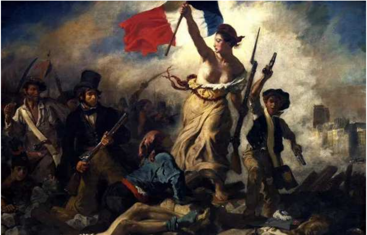
Figura 7: A liberdade guiando o povo. Pintura: Eugène Delacroix, 1830.

Na pintura “A liberdade guiando o povo”, o pathos da liberdade pode ser comparado com a figura da mulher judia que luta pela sua liberdade. É esta relação de dor e sofrimento com liberdade que unem as imagens. Eventos distintos se tornam coletivos a partir dos símbolos que compartilham.