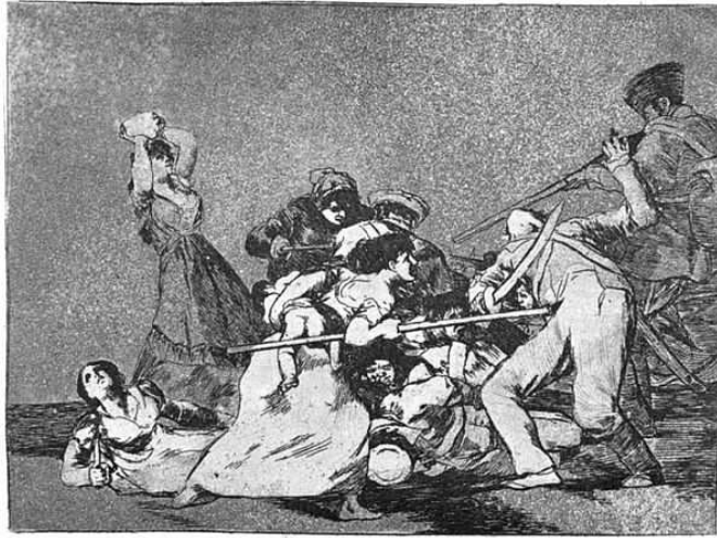
Figura 6: Los Desastres de la Guerra, placa 5. Pintura: Francisco Goya, 1906.

A ilustração de Goya possui diversos elementos visuais que evidenciam a ideia de dor, conflito, resistência e batalhas. Todos os elementos e as expressões nos rostos dos personagens estão de acordo com as escrituras cristãs, com a ideia do pathos da violência e da dor. A luz, como objeto central, destaca a figura feminina, que se encontra na mesma posição da mulher judia na fotografia de Oded Balilty.