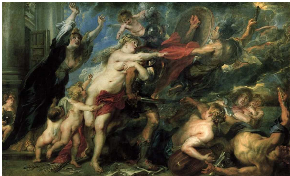
Figura 4: As consequências da Guerra. Pintura: Peter Paul Rubens.

pathos, o Pathosformel. Dentre estas, elencou-se uma das imagens presentes na constelação imaginada pelo autor.