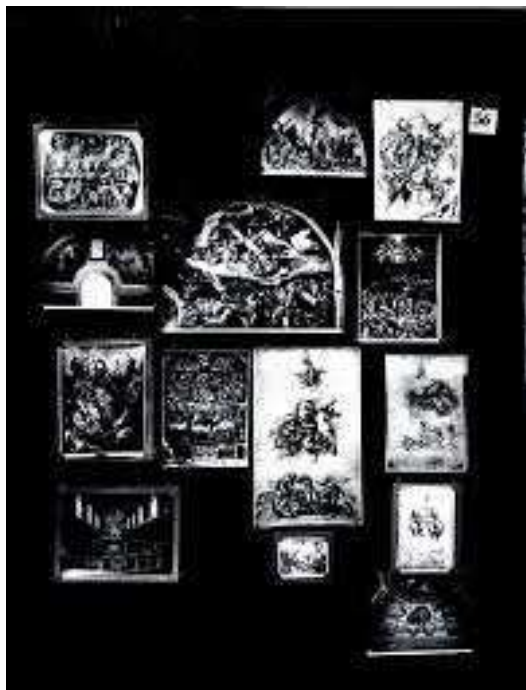
Figura 3: Prancha 56, Abril 22, 2000.

Abandonando os saberes sobre a imagem, ou o nível interpretativo da leitura, o que predomina, inclusive em termos espaciais, é o gestual dos braços do agente federal. Pode-se simplificar ao máximo esse movimento, reduzindo os elementos visuais a dois vetores ou setas dispostas em um ângulo agudo, ou que tenha menos de 90 graus entre elas, apontadas para a direita do quadro. Aqui começa a análise segundo a teoria de Aby Warburg.