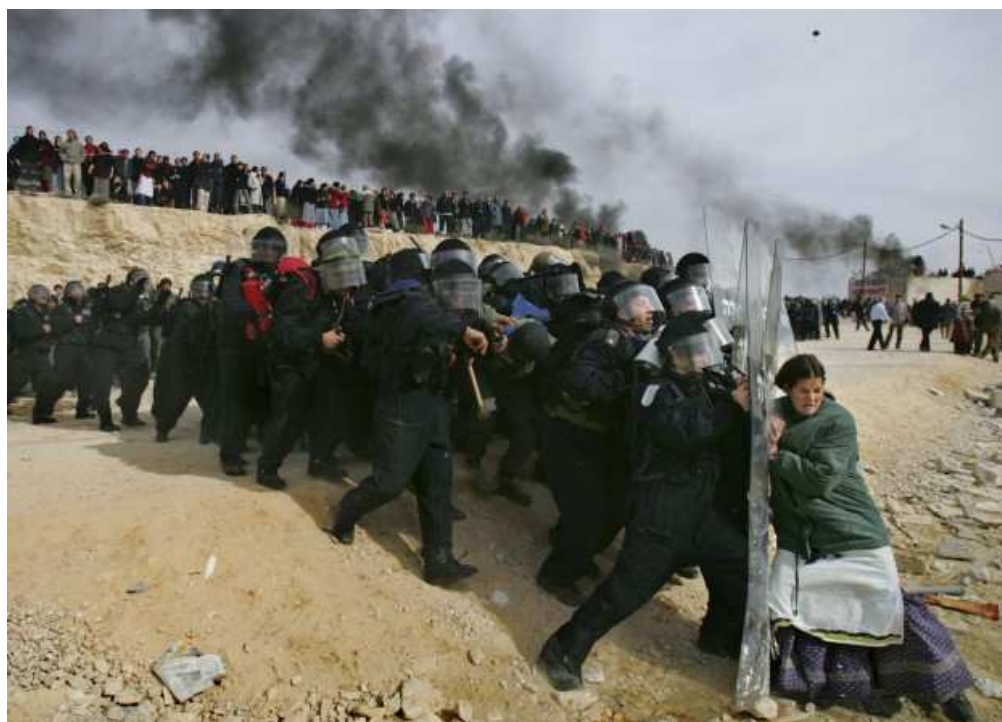
Figura 5: Uma mulher judia sozinha desafia oficiais israelenses durante briga após as autoridades desobsturem West Bank em Amona, leste da cidade Palestina de Ramallah. Fevereiro, 2006.

A cena marca a determinação da suprema corte israelense para evacuar e demolir, no ano de 2006, as nove casas no assentamento de West Bank em Amona, leste da cidade palestina Ramallah. No dia primeiro de fevereiro daquele ano, milhares de oficiais de segurança israelenses com equipamento anti-motim e cavalos atacaram centenas de judeus assentados na região.