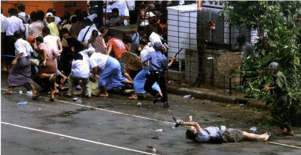
Figura 8: Um fotógrafo japonês ferido, Kenji Nagai, deitado diante de um soldado Burmese no Yangon, Myanmar, enquanto as tropas atacam protestantes, Mr. Nagai morreu pouco depois.

O clique congela, em 2008, em meio a turbulentos protestos em Myanmar, as tropas Birmanesas colocando fim aos protestos contra o governo ditatorial que controlou o país por mais de 45 anos. Foi ao som de armas automáticas projetando balas contra a população de Yangon que o fotógrafo Adrees Latif capturou o momento em que a morte se apoderou do local.