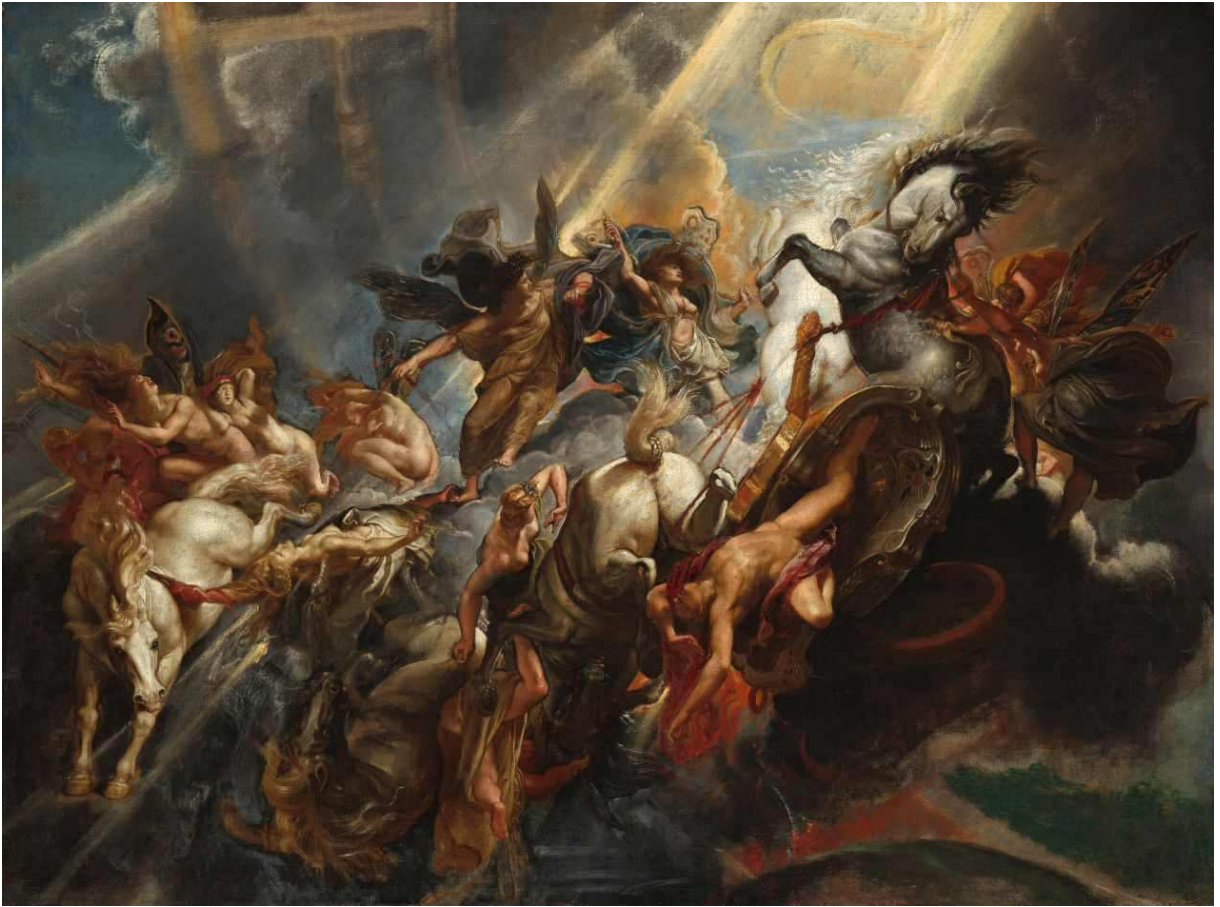
Figura 15: A Queda de Faetonte. Pintura: Peter Paul Rubens, 1604.

Esta pintura de Peter Paul Rubens também possui diversos elementos visuais, gestos e direcionamentos que dão vida à ideia de dor e sofrimento, ascensão e queda, e conflitos caóticos. O posicionamento do corpo que cai, as cores no espectro do vermelho e amarelo, a gestualidade, o movimento capturado e a impressão de confusão, são elementos compartilhados entre as imagens apresentadas e compactuam com o pathos da dor, da queda e do sofrimento.