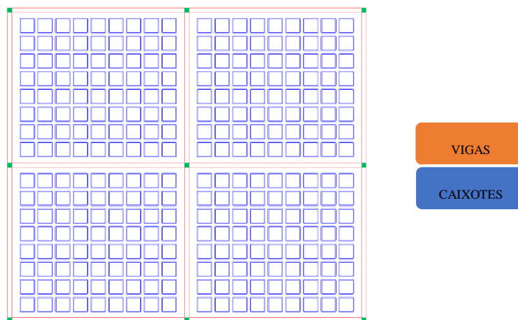
Figura 1 – Tipologia de pavimento estudado.

O pavimento genérico estudado é apresentado na Figura 1, sendo composto por lajes e vigas. As lajes e vigas serão os elementos estruturais estudados. Às vigas, será aplicado um pré-dimensionamento e adoção de taxa fixa de armadura. Às lajes, será aplicado estudo mais acurado, onde todas as dimensões da seção transversal, armaduras nas nervuras e a quantidade de lajes nas duas direções são considerados.