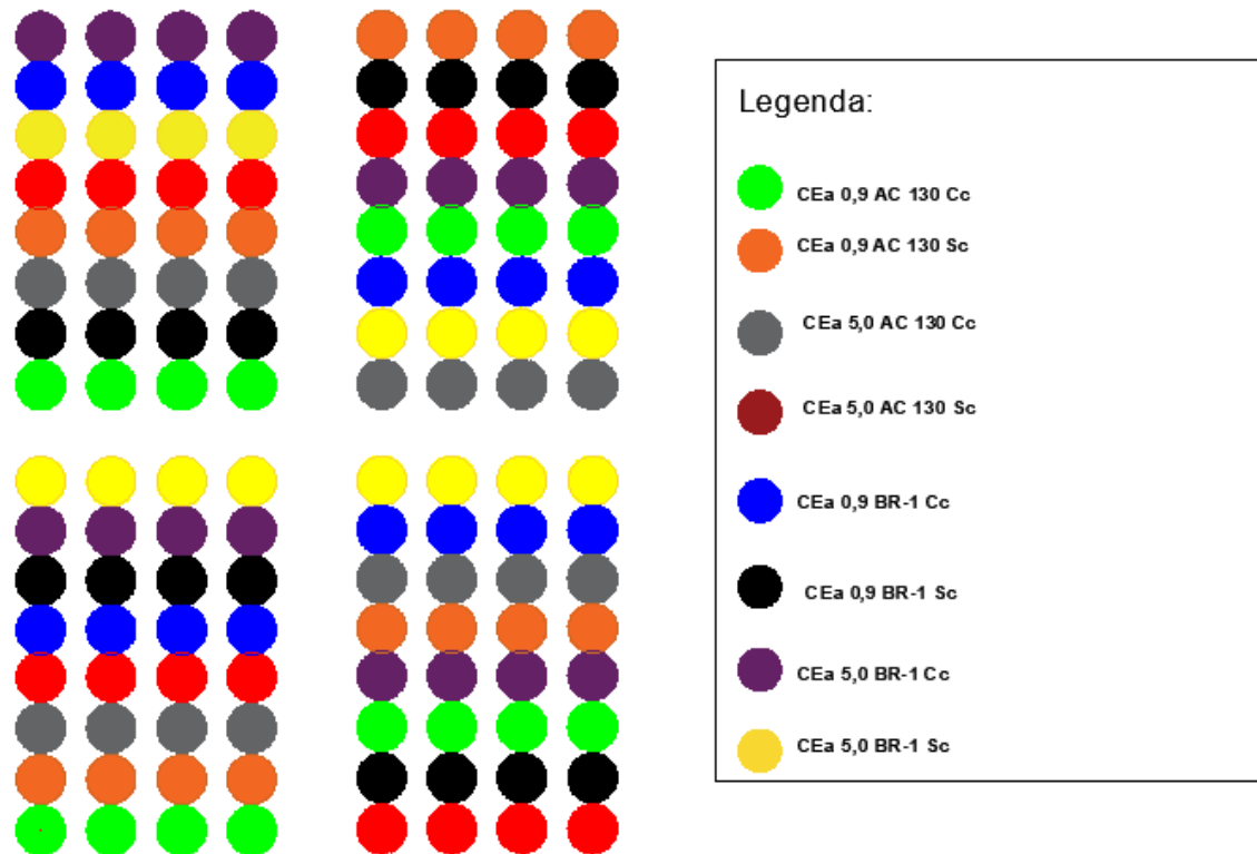
Figura 1 – Croqui do experimento.