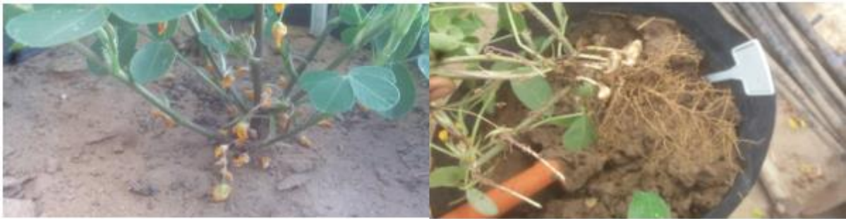
Figura 4 – Período da avaliação do estado reprodutivo dos genótipos (Tempo 0), antes do início dos tratamentos.

As plantas foram colhidas aos 28 (tempo zero da aplicação dos tratamentos, conforme mostra a figura 4), 48 e 72 dias após a semeadura (DAS). A área foliar foi obtida utilizando-se um medidor de área foliar (Area meter, LI-3100, Li-Cor, Inc. Lincoln, NE, USA), conforme Figura 5. Em seguida, as plantas foram colhidas e separadas respectivamente em folhas, caules, raízes, vagens e grãos e fruto, sendo tirado peso fresco e depois colocou-se em uma estufa à 65 °C até atingir a massa seca constante para ser retirada e quantificada em grama (g).