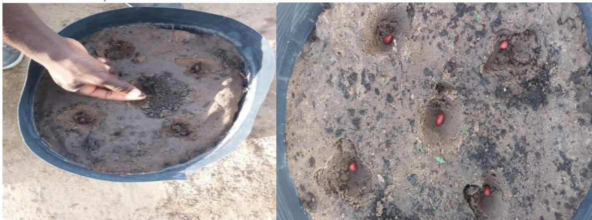
Figura 2 – Semeadura dos genótipos da cultura do amendoim. Estação Agrometeorológica, UFC – Fortaleza, CE.

A semeadura foi feita colocando-se 5 sementes por vaso (Figura 2), sendo a irrigação feita com água de 0,9 \text{ dS m}^{-1} em todos os vasos, mantendo-se o substrato na capacidade de campo, e aos 14 dias após a semeadura (DAS) foi realizado o desbaste deixando-se duas plantas por vaso.