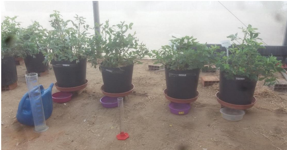
Figura 3 – Manejo da irrigação com lisímetro de drenagem em genótipos da cultura do amendoim, dois genótipos do AC 130 e cv. BR-1, da esquerda para direita, respectivamente.

A diferenciação dos tratamentos salinos foi iniciada no início da fase reprodutiva, aos 28 DAS (Figura 3), adotando-se o método de lisímetro de drenagem no manejo da irrigação, sendo selecionados 8 vasos para tal finalidade (1 lisímetro para cada tratamento).