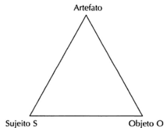
Figura 1 A representação triangular básica de mediação.

Outro conceito relevante para o entendimento do pensamento de Vygotsky é o de mediação. A figura 1 é uma representação simbólica do conceito.