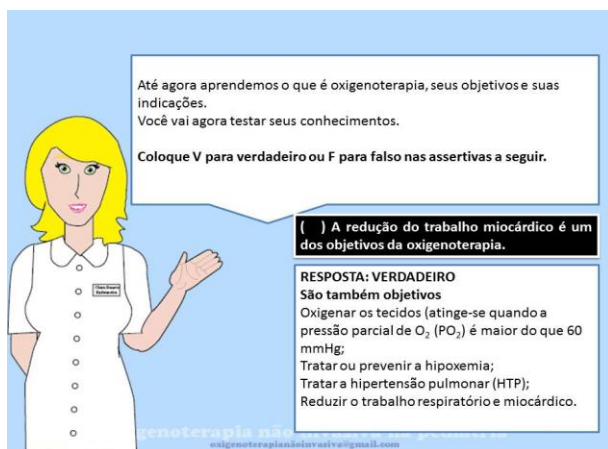
Figura 4 – Modelo de atividade de revisão na hipermissão.

3) Mediação do processo de aprender, organizando o contexto e preparando os recursos didáticos necessários à facilitação e direcionamento do processo: foram utilizados diversos tipos de mídias, tais como figuras, hipertextos, quadros, animações, de modo a proporcionar os melhores recursos didáticos.