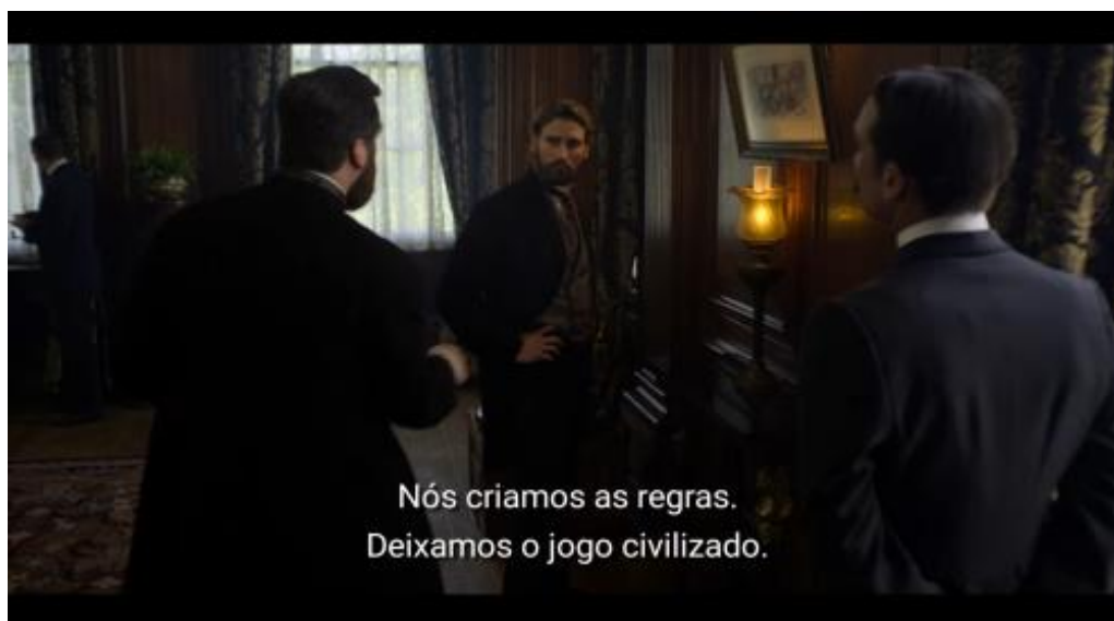
Figura 1 - Cena da série The English Game .

A referida luta para inclusão das camadas populares no futebol é explorada na minissérie The English Game 3 . A trama, que é envolta na história do protagonista Fergus Suter, supostamente o primeiro jogador de futebol profissional da Inglaterra, traz à tela o embate entre a classe operária e a elite inglesa, que dominava a organização da entidade que decidia sobre o esporte (na série retratada pela Football Association ) e que via a remuneração realizada aos denominados “jogadores-operários” como um ato incompatível com os ideais de civilidades que originaram o esporte.