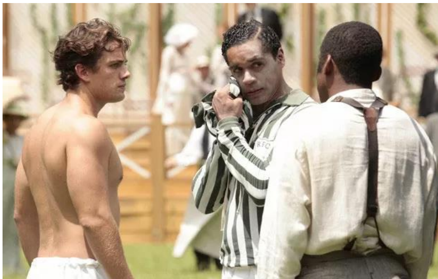
Figura 2 - Cena da telenovela Lado a Lado

de fevereiro de 2013, no qual o personagem Chico utiliza-se dessa artimanha para tentar jogar uma partida. Entretanto, a maquiagem começou a derreter durante a partida, fazendo com que todos percebessem a farsa.