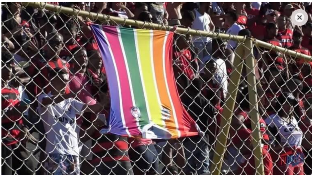
Figura 9 - Camisa da LGBTricolor sendo exposta ao avesso no estádio Barradão

Por fim, relata-se os acontecimentos do clássico disputado entre o Esporte Clube Vitória e o Esporte Clube Bahia, em primeiro de março de 2020, válido pelo Campeonato Baiano. Durante a partida, a torcida do Vitória expôs a camisa 90 da torcida LGBtricolor, torcida organizada LGBT do Bahia 91 , ao contrário, nos alambrados do estádio Manoel Barradas (Barradão), em uma clara demonstração de menosprezo e preconceito.