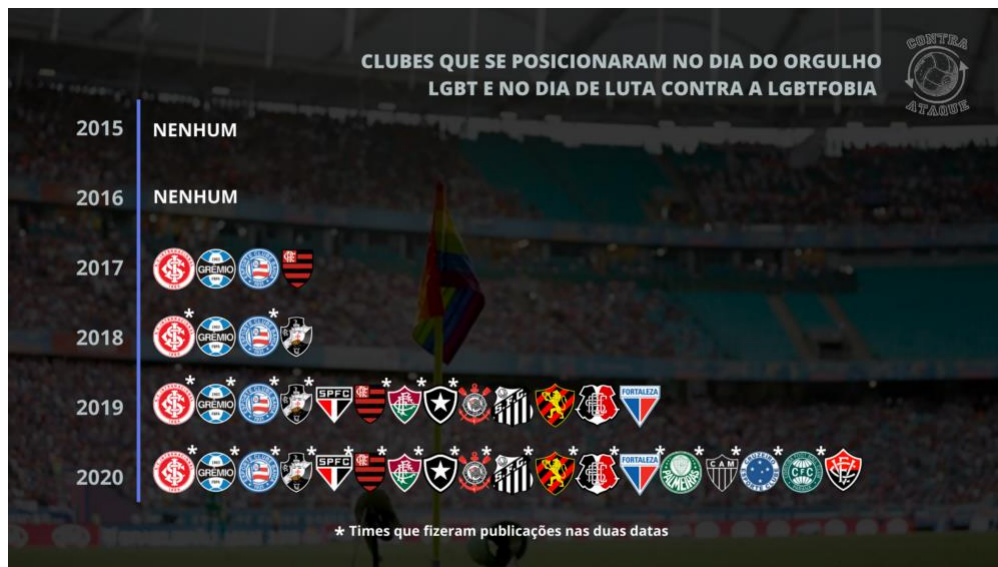
Figura 8 - Clubes que se posicionaram no dia do orgulho LGBT e no dia contra a LGBTFOBIA entre 2015 e 2020