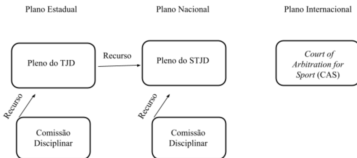
Figura 4 - Órgãos da Justiça Desportiva do Futebol

No caso do futebol, por força da previsão nos regulamentos da CBD, tem-se ainda a jurisdição do CAS, como já estudado anteriormente. O CAS atuará como última instância da Justiça Desportiva, embora não faça parte do quadro de órgãos da Justiça Desportiva brasileira, quando a matéria discutida no processo integrar as hipóteses de jurisdição do tribunal, também indicadas em 2.3.1. Sobre a estrutura organizacional da Justiça Desportiva de Futebol brasileira, incluindo-se a aceitação da jurisdição do CAS, apresenta-se o seguinte esquema: