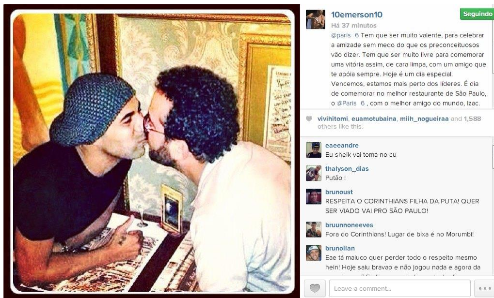
Figura 6 - Foto publicada no perfil do ex jogador Émerson Sheik na rede social Instagram

não” 53 , além de ter recebido diversos ataques nos comentários da publicação e em sua rede social.