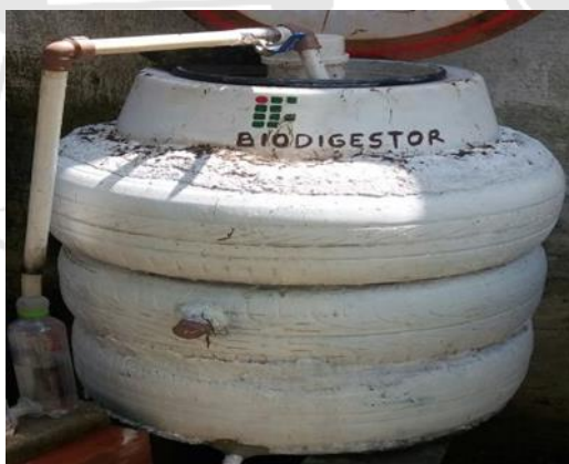
Figura 1: Biodigestor construído de materiais reciclados

Há três subprodutos do processo de biodigestão anaeróbia, porém o foco do atual trabalho foi o efluente produzido. O mesmo foi coletado em 26 de Junho do mesmo ano por meio de mecanismo instalado no próprio recipiente utilizando frascos de aproximadamente 1L como mostram as Figuras 2 e 3, e posteriormente a amostra foi levada ao Laboratório de Análises de Água e Efluentes e Laboratório de Análises Microbiológicas de Água e Efluentes (LAAE/LAMAE) do Instituto Federal de Educação, Ciência e Tecnologia do Ceará - Campus Sobral.