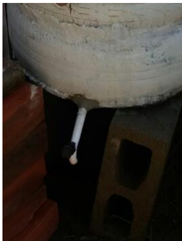
Figura 2: Dispositivo de coleta do efluente