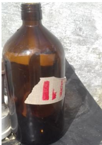
Figura 3: Frasco utilizado para coleta