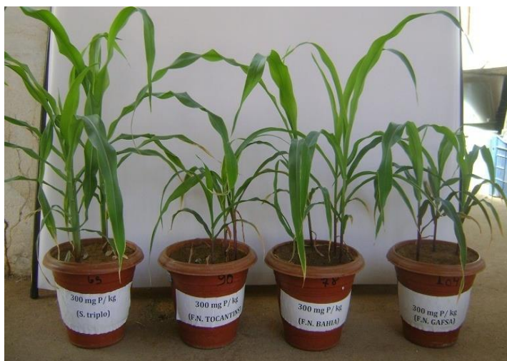
Figura 4: Plantas de milho ( Zea mays ) cultivadas em casa de vegetação com superfosfato triplo, FNT, FNB e FNR na dose 300 \text{ mg kg}^{-1} de P.