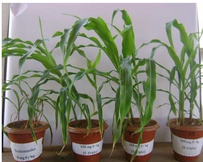
Figura 5: Plantas de milho ( Zea mays ) cultivadas em casa de vegetação sem P e cultivadas com superfosfato triplo nas doses 100, 200 e 300 \text{ mg kg}^{-1} de P.

A análise de regressão que relaciona a altura das plantas de milho com as doses crescentes de fósforo está representada na Figura 1 e Tabela 3. Notou-se que as fontes Superfosfato triplo, FNT e FNR, tiveram os dados de altura de planta ajustados ao modelo quadrático de regressão. De acordo com as equações de regressão, dispostas na Tabela 3, as doses teóricas que proporcionaram o maior crescimento do milho para as fontes, superfosfato triplo, FNT e FNR, foram: 236,89; 161,84 e 240,18 \text{ mg kg}^{-1} de P, respectivamente.