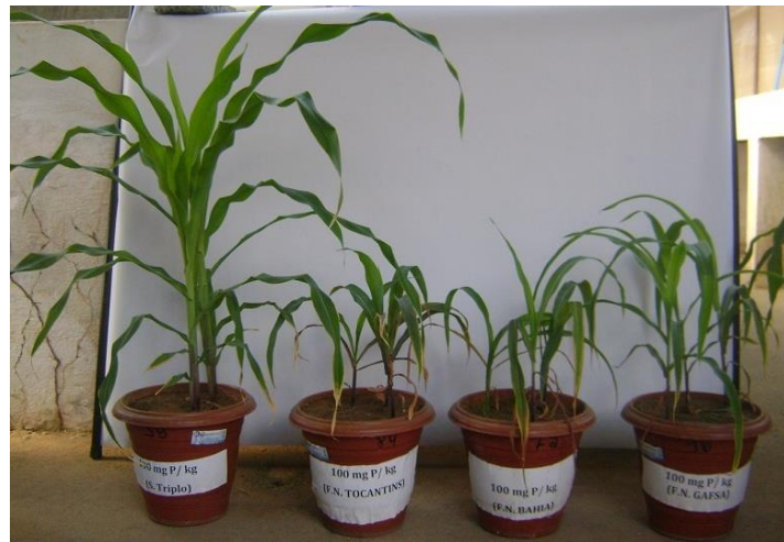
Figura 2: Plantas de milho ( Zea mays ) cultivadas em casa de vegetação com superfosfato triplo, FNT, FNB e FNR na dose 100 \text{ mg kg}^{-1} de P.

Pacheco et al. [9] relatam que a aplicação de fosfato natural de baixa reatividade não supre, em muitos casos, a demanda da planta por fósforo, pois a pequena quantidade de P liberada em curto tempo não é satisfatória para que as plantas cresçam adequadamente, podendo até comprometer sua produtividade. Resende et al. [10] relatam que os efeitos das diferentes solubilidade dos fosfatos resultam em diferenças na aquisição de P e conseqüentemente refletem nas taxas de produção das culturas. Resultado semelhante de altura de plantas de milho cultivadas em Latossolo amarelo e adubadas com superfosfato triplo foi encontrado por Oliveira et al. [11], cuja dose foi de 100 \text{ kg ha}^{-1} de \text{P}_2\text{O}_5 e a altura obtida foi de 108,1 cm.