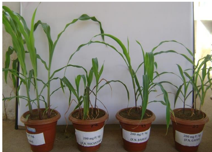
Figura 3: Plantas de milho ( Zea mays ) cultivadas em casa de vegetação com superfosfato triplo, FNT, FNB e FNR na dose 200 \text{ mg kg}^{-1} de P.