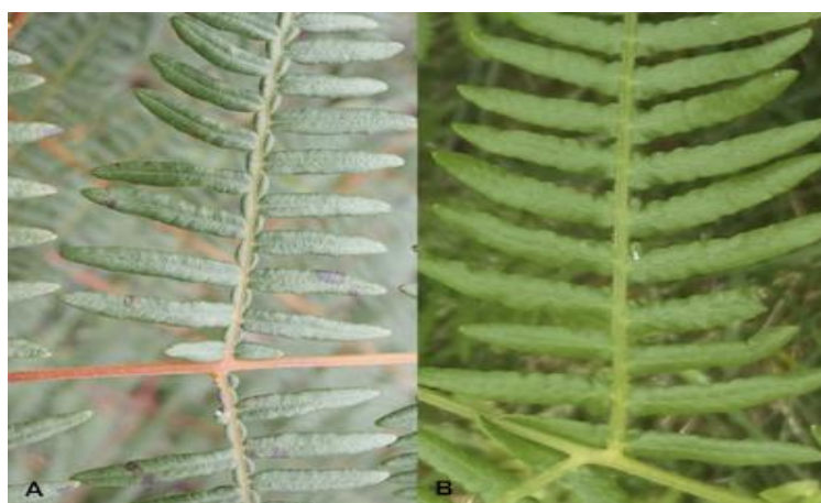
Figura 1: Detalhe de frondes de: A- Pteridium arachnoideum (Belo Horizonte, MG) e B- Pteridium aquilinum (Parque Nacional de Picos de Europa, Espanha).

entanto, após a realização de estudos biomoleculares, o gênero Pteridium passou a pertencer à família Dennstaedtiaceae, e outras espécies foram reconhecidas (THOMSON, 2000). Segundo a classificação proposta por DER et al. (2009), as espécies existentes na América do Sul são Pteridium arachnoideum (Kaulf.) Maxon (Figura 1) e Pteridium caudatum (L.) Maxon (YANEZ et al., 2016).