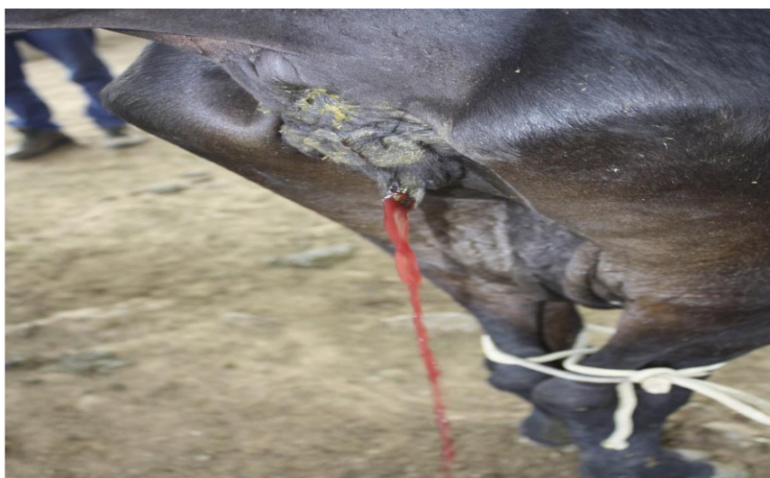
Figura 3: Vaca apresentando hematúria em decorrência do consumo de Pteridium arachnoideum (São Roque de Minas, MG).

A melhora do animal pode ocorrer na fase inicial da doença, se os animais forem retirados do pasto invadido pela planta e receberem boa alimentação; entretanto, se houver nova ingestão, a hematúria recomeça com rapidez (TOKARNIA et al., 2012).