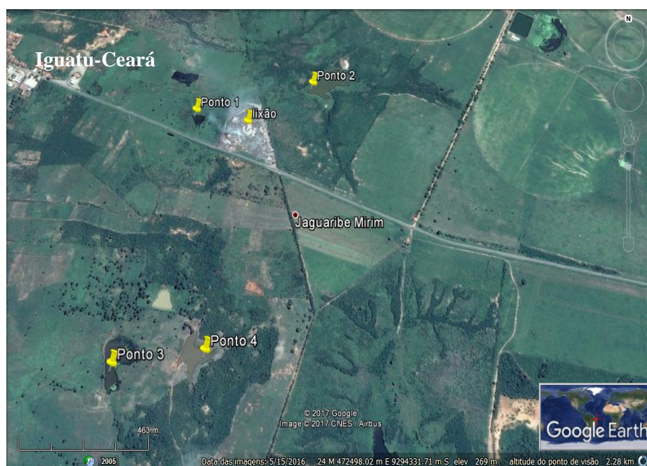
Figura 1- Localização do “lixão” e pontos de coleta de água (P1, P2, P3 e P4) no município de Iguatu-CE.

A amostragem de águas superficiais nas proximidades do “lixão” da cidade de Iguatu/CE, foi realizada em dois períodos, a primeira no mês de novembro de 2016 e a segunda em janeiro de 2017 em quatro pontos distintos (Figura 1). As amostras foram coletadas em garrafas de polipropileno, previamente higienizadas e, em seguida foram transportadas para o laboratório de química do IFCE – Instituto Federal de Ciências e Tecnologia do Ceará campus Iguatu, onde passaram por um processo de acidificação com ácido nítrico ( \text{HNO}_3 ). Com o auxílio de uma pipeta volumétrica foram adicionados 2,20 mL de \text{HNO}_3 em 100 mL de amostra de água, e em seguida foram identificadas e armazenadas sob refrigeração para análise de metais.