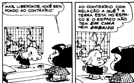
Figura 2 – Tiras da Mafalda.

Referente a esta sensibilização espacial por meio de representações cartográficas, o professor poderá, por exemplo, fazer uso de diversos recursos didáticos pedagógicos, tais como: telejornais, revistas, livros didáticos, quadrinhos para fornecer aos alunos elementos exemplificadores que abordam tais modelos adotados em convenções internacionais. (Figura 2).