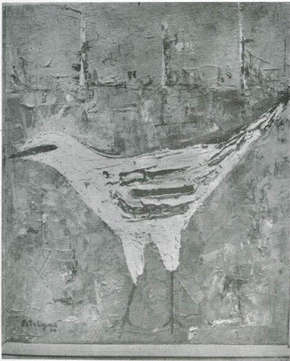
PÁSSARO Estrigas Óleo s/tela