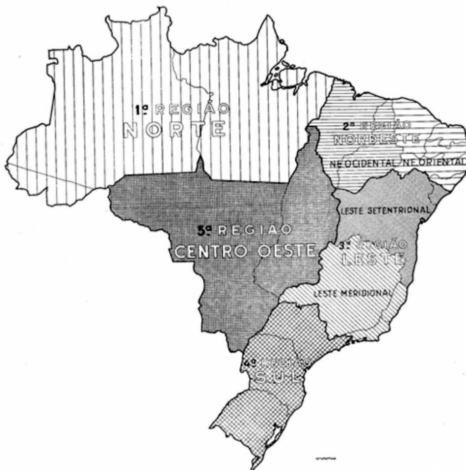
Figura 3 - Cartograma da divisão regional do Brasil (1941).

Assim, a fragmentação do Nordeste encontrava-se assentada pela característica de transição do ambiente físico dos estados de Piauí e Maranhão, que em partes se assemelhava com o bioma amazônico e da caatinga. No caso da subdivisão do Leste, nota-se o papel das características humanas enquanto meio para sanar a problemática dos limites regionais que permeassem frente às unidades ambientais. Deste modo, ao subdividir dois dos maiores centros econômicos do período (Minas Gerais e Rio de Janeiro) dos estados da Bahia e Sergipe, encontrava-se um caminho para sanar a disparidade social existente naquela região.