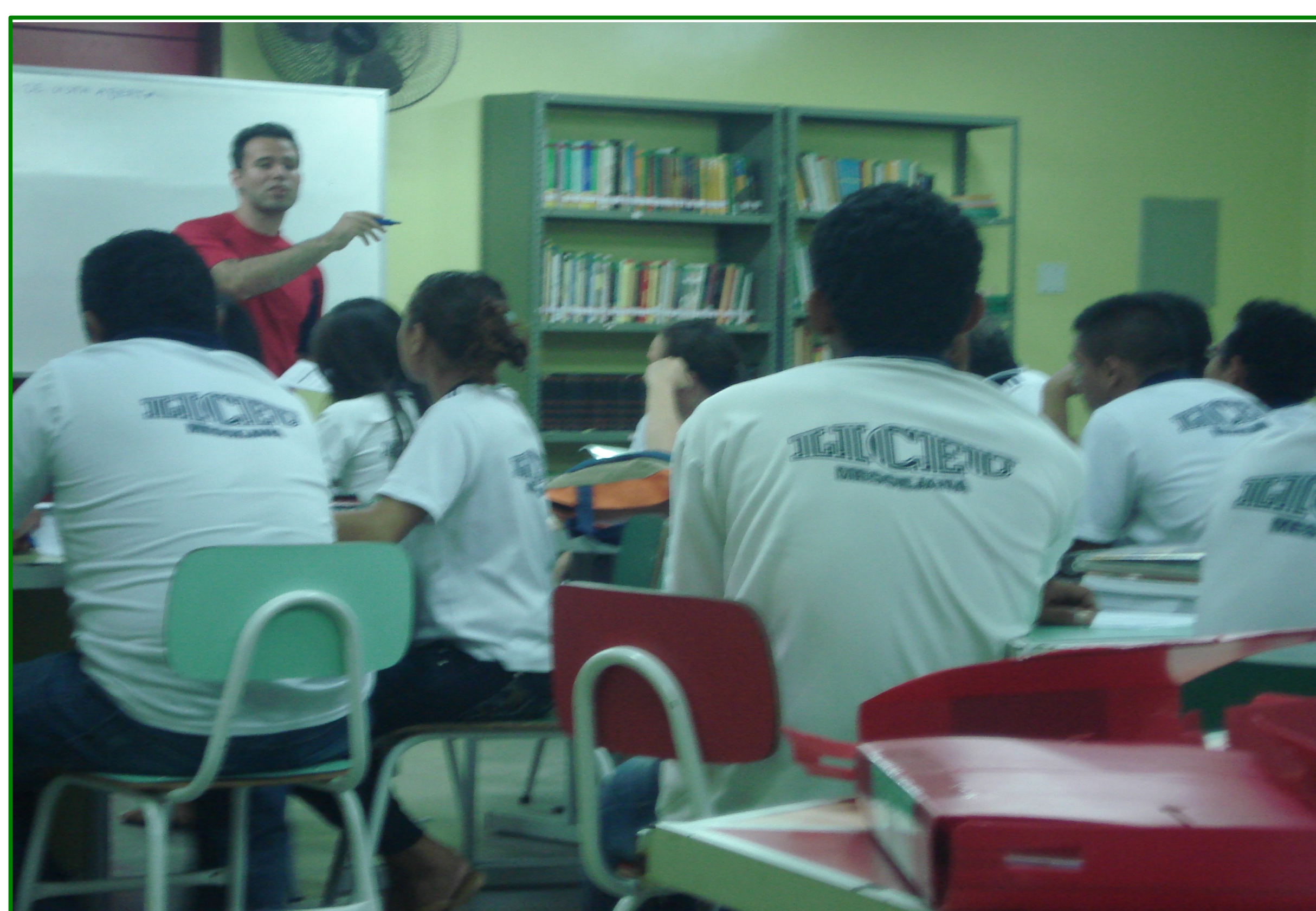
Alunos do Liceu de Messejana recebendo aula sobre sistema eleitoral ministrada por bolsistas do PIBID.