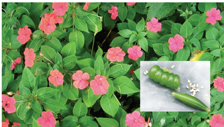
Figura 01: Maria-sem-vergonha, carpelos e valvas.

Maria-sem-vergonha interessa por ser como nós, brasileiras: fuleiras, necessitamos de muito sol e muita água; somos exóticas, invasoras, originárias da África, explosivas. A Maria-sem-vergonha é uma espécie nativa da região de Quênia e de Moçambique. Outros dizem original de Zanzibar. Assim, ela é como nós: brasileira. É uma planta perene, como nós, perenes na efemeridade.