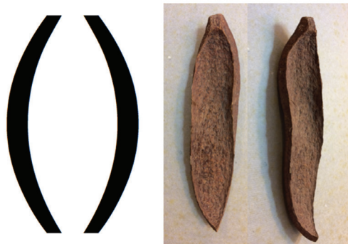
Figura 02: Parênteses e foto de pedaço de casca de mogno.

Assim, em passeio pelas 400 6 , Bia Medeiros percebeu, no chão, um pedaço de casca de semente de mogno e relacionou-a aos ( ) da mar(ia-sem-ver)gonha e/ou a uma buceta que faltava pensar na (de)composição do termo “mar(ia-sem-ver)gonha”.