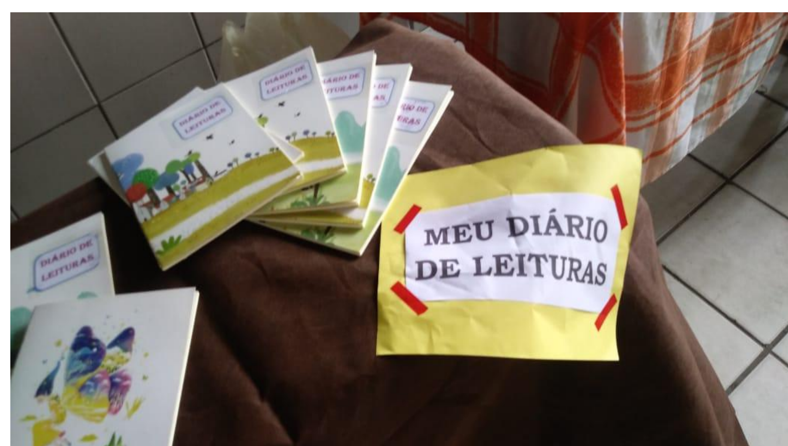
Fig. 1 – Diário de leituras

SOARES, Magda Becker. Letramento: um tema em três gêneros . 3. ed. Belo Horizonte: Autêntica Editora, 2009.