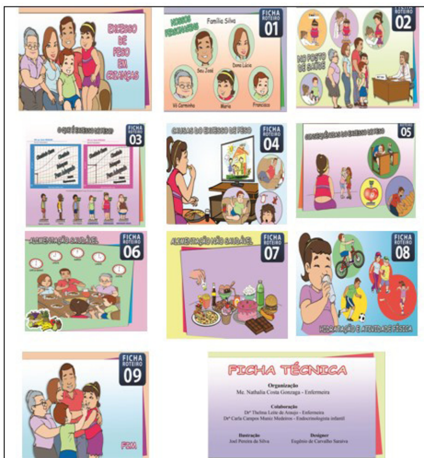
Figura 1 – Capa, figuras e ficha técnica da primeira versão do álbum seriado, intitulado “Excesso de peso em crianças”. Fortaleza, CE, Brasil (2014)