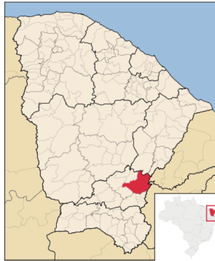
Figura 1. Localização de Icó no Ceará