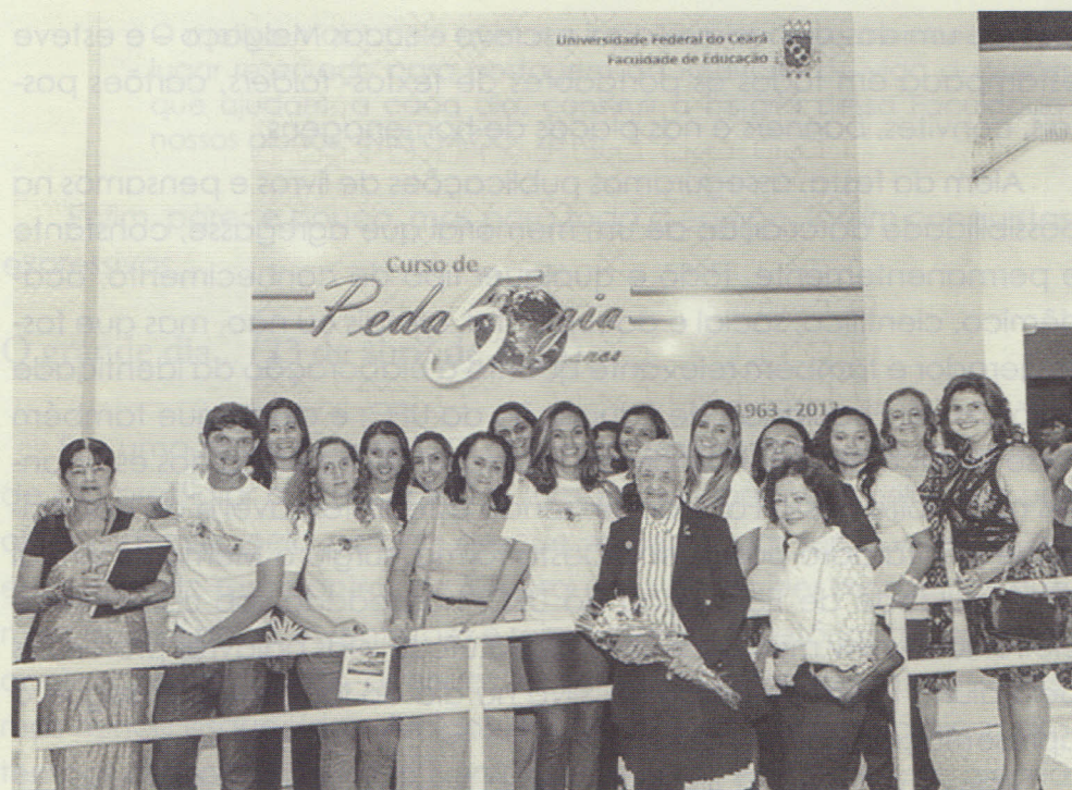
Figura 1 - Disponibilizada In: www.memorialvirtualfaced.ufc.br .

Como vimos, a vontade de toda a equipe em fazer desse evento algo marcante no contexto histórico da Faculdade de Educação era maior do que qualquer dificuldade. Desse modo, a mobilização interna junto aos estudantes e professores da FACED e Administração Superior da Universidade permitiu a divulgação, com direito a banner , folders , convites e uma comemoração com coquetel e de toda uma infraestrutura necessária ao evento comemorativo.