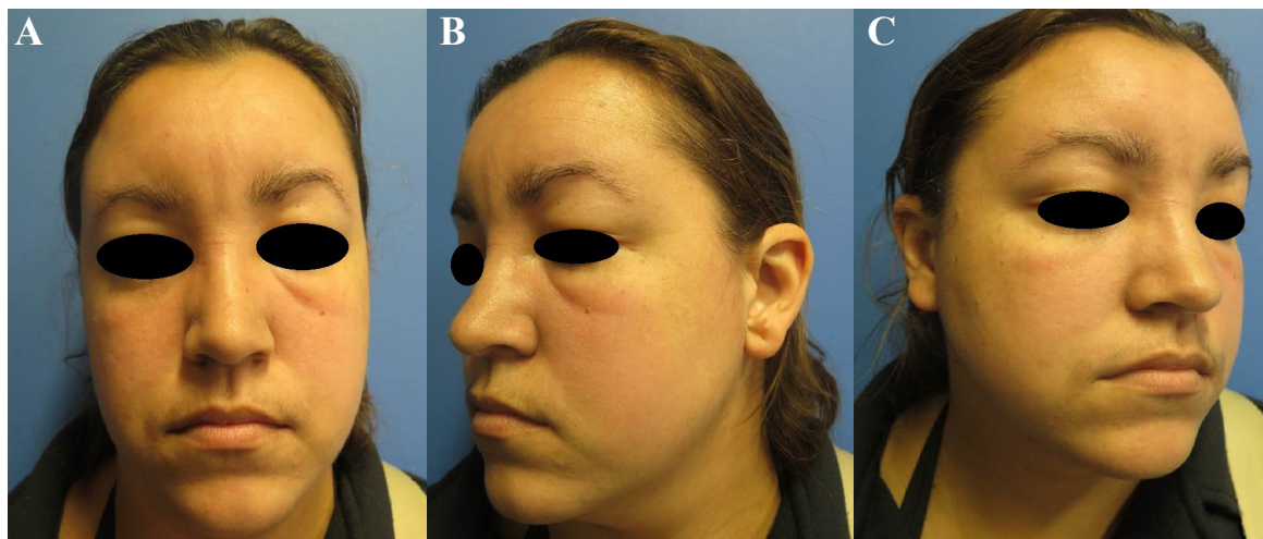
Figura 1. (A): Eritema e edema duro nas regiões malares e no fronte - visão frontal; (B): Eritema e edema duro nas regiões malares e no fronte - visão lateral esquerda; (C): Eritema e edema duro nas regiões malares e no fronte- visão lateral direita.

Paciente do sexo feminino, 28 anos, procedente de Campinas, São Paulo, sem comorbidades prévias, procurou o ambulatório de Dermatologia apresentando eritema e edema endurecido nas regiões malares e na frente (Figura 1). Apresentava cefaleia acompanhando o quadro cutâneo. Ao exame dermatológico apresentava placa eritematoedematosa, lisa e endurecida no terço superior da face. O exame anatomopatológico evidenciou infiltrado perivascular linfocitário e histiocitário de grandes células e células de tamanho intermediário com imunohistoquímica positiva para marcadores linfocitários de imunofenótipos B e T, de padrão politípico reacional. No primeiro momento foi aventada hipótese de Infiltrado Linfocítico de Jessner e iniciado tratamento com hidroxycloquina 400 mg e prednisona 10 mg empiricamente.