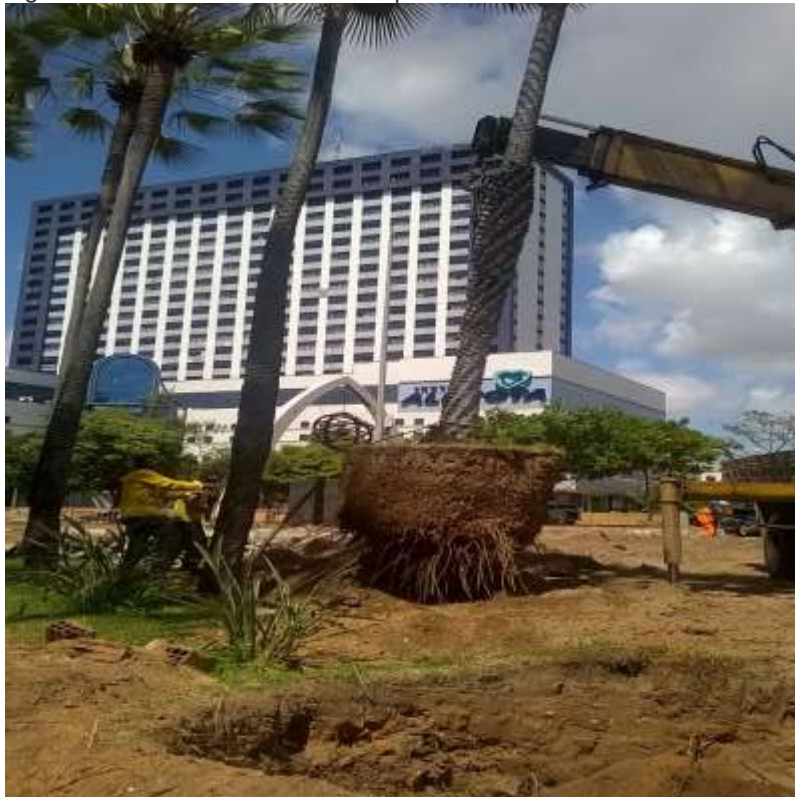
Figura 9 : Carnaubeira sendo transplantada.