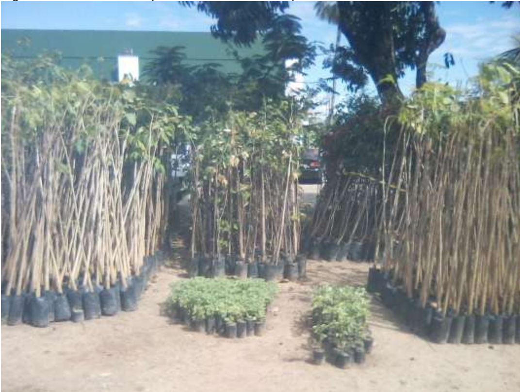
Figura 12: Mudas doadas para a Secretaria Municipal de Urbanismo e Meio Ambiente.