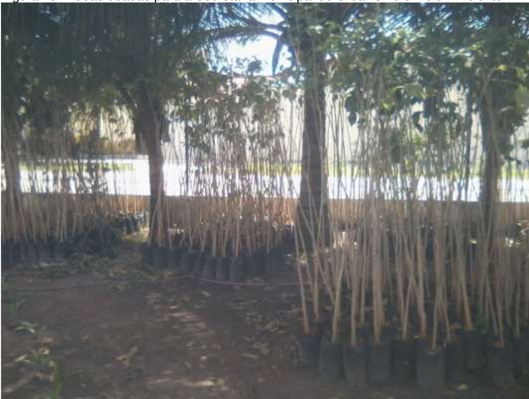
Figura 13: Mudas doadas para a Secretaria Municipal de Urbanismo e Meio Ambiente.