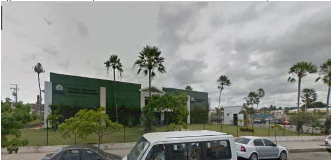
Figura 2. Secretaria Municipal de Urbanismo e Meio Ambiente. Fortaleza- CE, 2016.