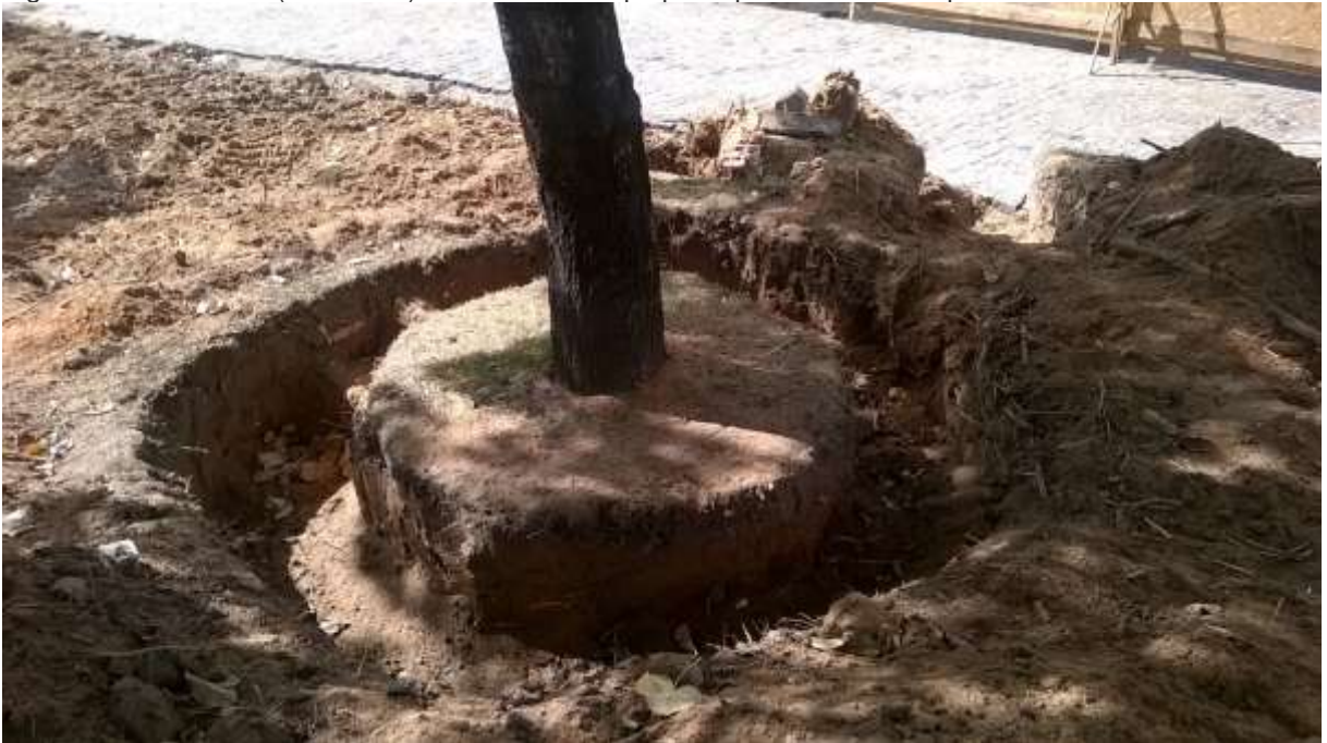
Figura 6: Cova aberta (desmame) ao redor de um ipê para que ocorra o transplante.