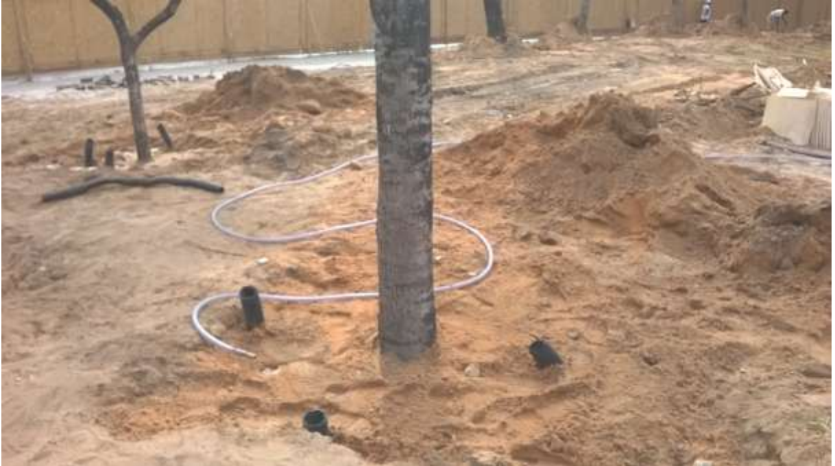
Figura 8: Canos de PVC colocados ao redor da árvore transplantada.