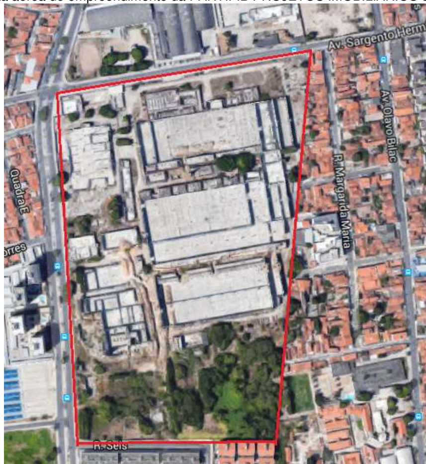
Figura 10: Vista aérea do empreendimento da PARTIFIB PROJETOS IMOBILIÁRIOS SHFOR LTDA.

A área do terreno atualmente conta com uma vegetação caracterizada por uma vegetação implantada pelo homem. Na área existia uma fábrica, que no dia da vistoria já havia sido demolida.