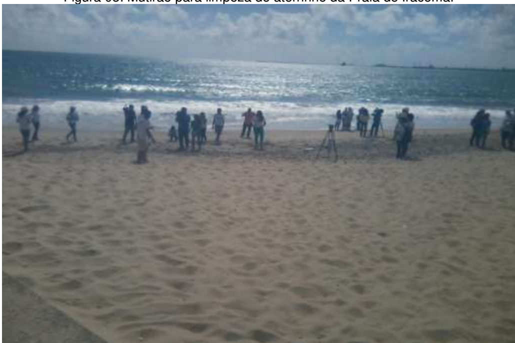
Figura 03: Mutirão para limpeza do aterrinho da Praia de Iracema.

Ainda durante a semana foram realizadas doações de mudas, passeios ciclísticos, palestras com o intuito de aumentar o número de propagadores da ideia de uma cidade mais sustentável. Também foi realizada a comemoração do dia do Boto Cinza ( Sotalia guianensis ) em Fortaleza, espécie considerada um patrimônio natural do município além doo dia mundial dos Oceanos.