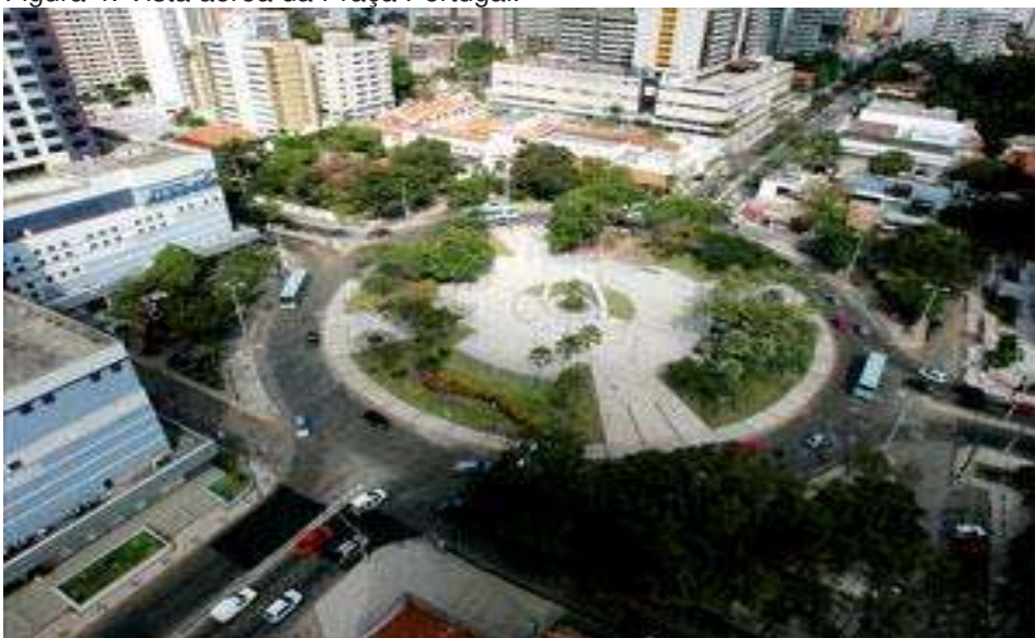
Figura 4: Vista aérea da Praça Portugal.

A Praça Portugal é um marco histórico da cidade de Fortaleza. A praça fica entre as avenidas Desembargador Moreira e Avenida Dom Luís, no centro do bairro Aldeota. Criada em 1947 pela arquiteta e paisagista Maria Clara Nogueira Paes, a praça passa atualmente por uma reforma a fim de se melhorar a mobilidade do trânsito no bairro em questão.