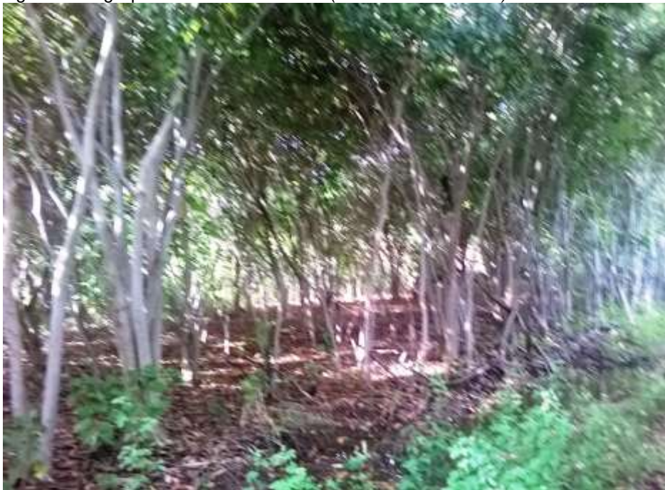
Figura 11: Agrupamento de Sombreiro ( Clitoria fairchildiana ) na área.

Para a continuação dos trabalhos no empreendimento, a empresa deve apresentar o devido resgate e destinação da fauna existente no local.