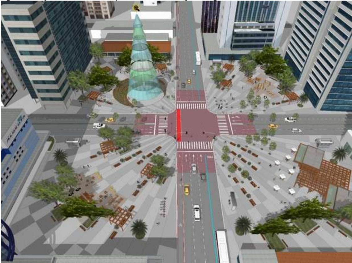
Figura 5: Projeto com retirada da parte central da Praça Portugal.