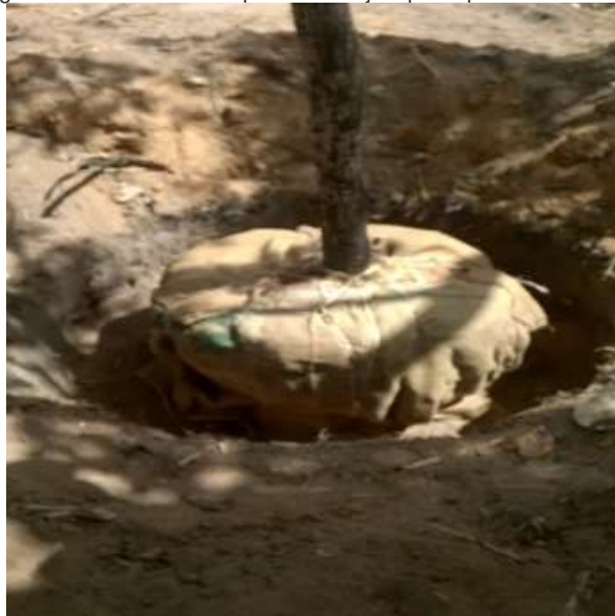
Figura 7: Torrão revestido por saco de juta para que a árvore de ipê seja transplantada.