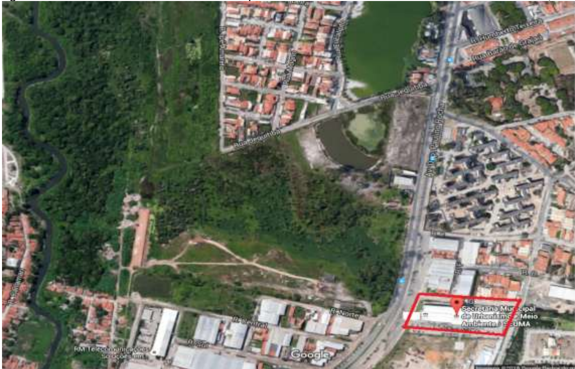
Figura 1. Vista aérea da Secretaria Municipal de Urbanismo e Meio Ambiente. Fortaleza- CE, 2016.