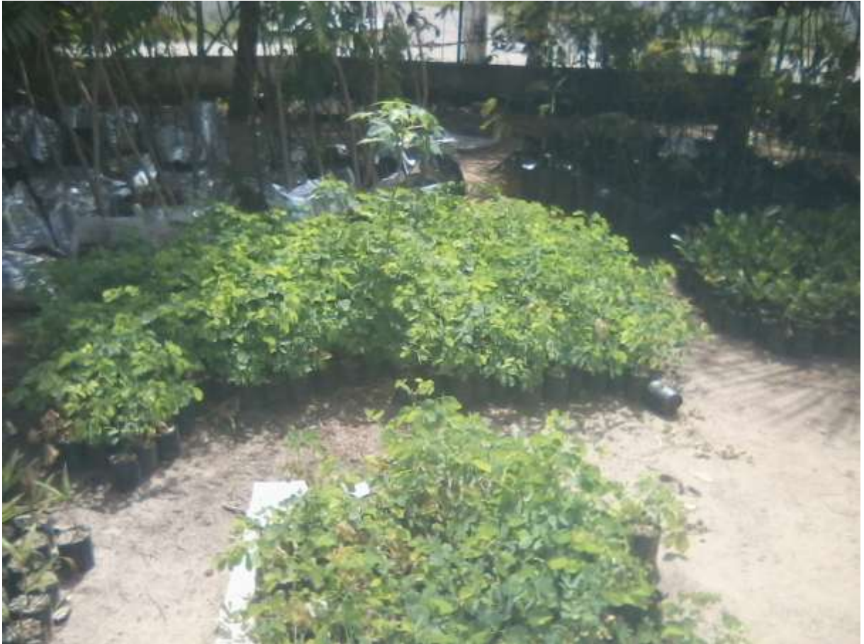
Figura 14: Mudanças de sabiás ( Mimosa caesalpinifolia ) doadas à SEUMA.