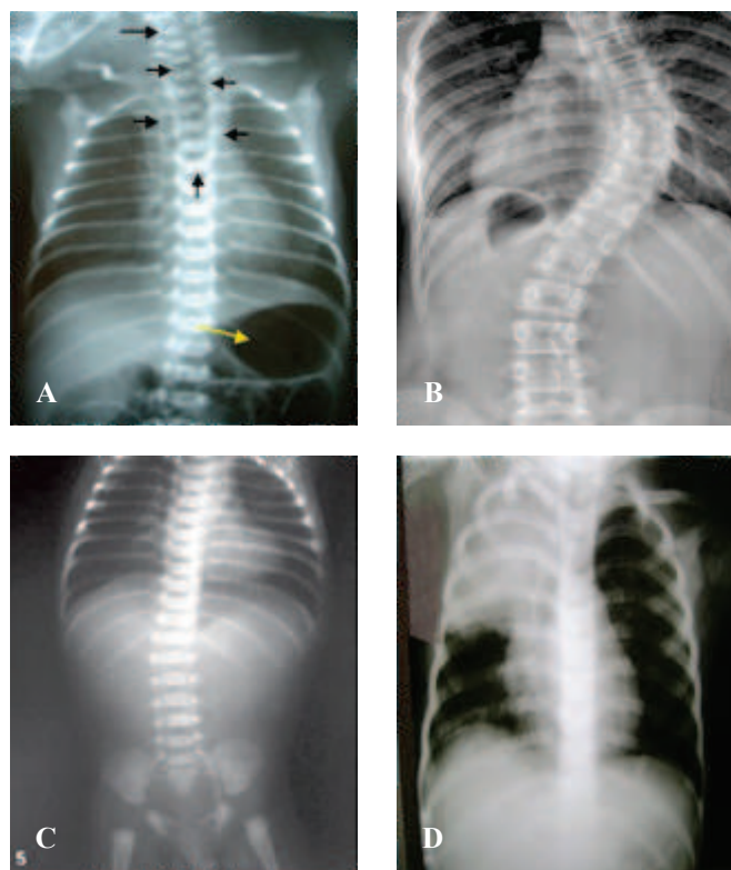
Figura 3. Radiografias panorâmicas com contraste de neonatos com Atresia de Esôfago. Em evidência, o coto esofágico proximal preenchido por contraste iodado radiopaco.

Figura 2. Radiografias panorâmicas sem contraste de neonatos com atresia de esôfago: (A) Em detalhe, coluna de ar em fundo cego (setas pretas) e presença de ar em trato gastrointestinal (seta branca). (B) Malformações vertebrais. (C) Ausência de ar no trato gastrointestinal. (D) Pneumonia em pulmão direito.