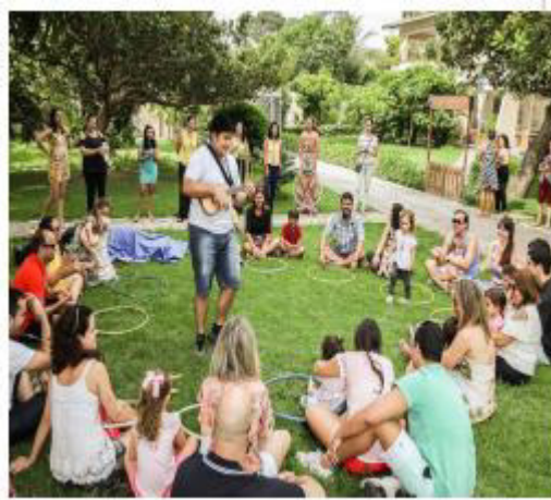
Figura 7 - Dinâmica de música