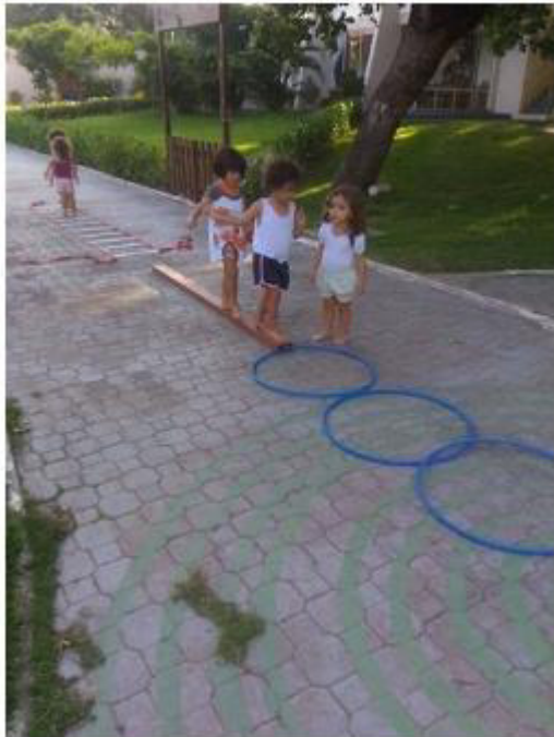
Figura 4 – Brincadeira de circuito

básicas e que precisam exatamente serem trabalhadas nessa idade. Andar, correr, rastejar, saltitar, equilibrar, saltar... tudo isso é executado de maneira prazerosa naquele ambiente.