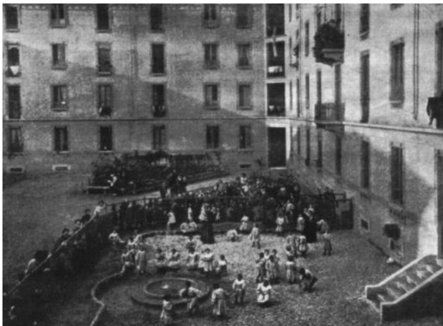
Figura 2 – A escola de San Lorenzo

Em seguida, surgiu a oportunidade de trabalhar seus métodos pedagógicos em crianças sem deficiência mental em um bairro pobre da periferia de Roma, em San Lorenzo . Desse modo, pôde comprovar aquilo que constatara na prática com a educação das crianças que tinham retardo, ou seja, a eficiência do seu método pedagógico. Assim, surgiu um número cada vez maior de escolas que utilizavam seus métodos não somente na Itália, mas em diversas outras partes do mundo.