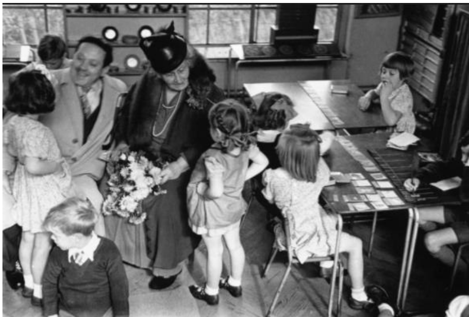
Figura 1 – Maria e Mario Montessori com as crianças

Em 1899 assumiu a direção da escola para deficientes mentais em Roma. Nesse momento, ela conseguiu pôr em prática algumas de suas ideias pedagógicas, muitas delas através de suas leituras de autores como Seguin, Froebel e Itard, este último bastante conhecido pelas intervenções realizada em “Victor”, o garoto selvagem de Aveyron. Ele fora encontrado em uma floresta francesa longe do contato humano e da civilização moderna. Desta forma, seu comportamento se assemelhava bastante a de um animal selvagem do que de um ser humano “civilizado”. Este caso foi muito importante para o desenvolvimento de teorias a respeito da influência da cultura no processo de aprendizagem.