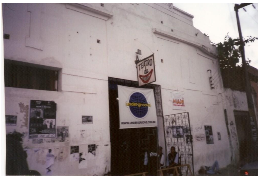
Figura 3: Sede do Undergroove.