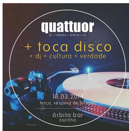
Figura 4 Flyer festa Quattuor.