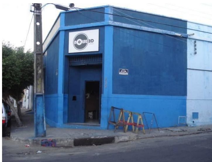
Figura 5: fachada Noise 3D Club

Voltando ao asfalto da capital, no começo dos anos 2000, vão surgindo novos espaços dedicados a determinados gêneros musicais além do eletrônico. Na maioria das vezes, esses espaços estavam situados na Praia de Iracema, aos arredores do mais novo complexo cultural da cidade, o Centro Cultural Dragão do Mar de Arte e Cultura (CDMAC), fundado em abril de 1999. Vale destacar que tal região, antes de ser implementado tal centro cultural, era ocupada em sua maioria por antigos galpões abandonados da antiga Alfândega do Ceará, mas de caráter boêmio. Após a inauguração, a região se tornou mais atrativa para os empreendedores locais, sobretudo aqueles que trabalhavam no campo do entretenimento, lazer e serviço.