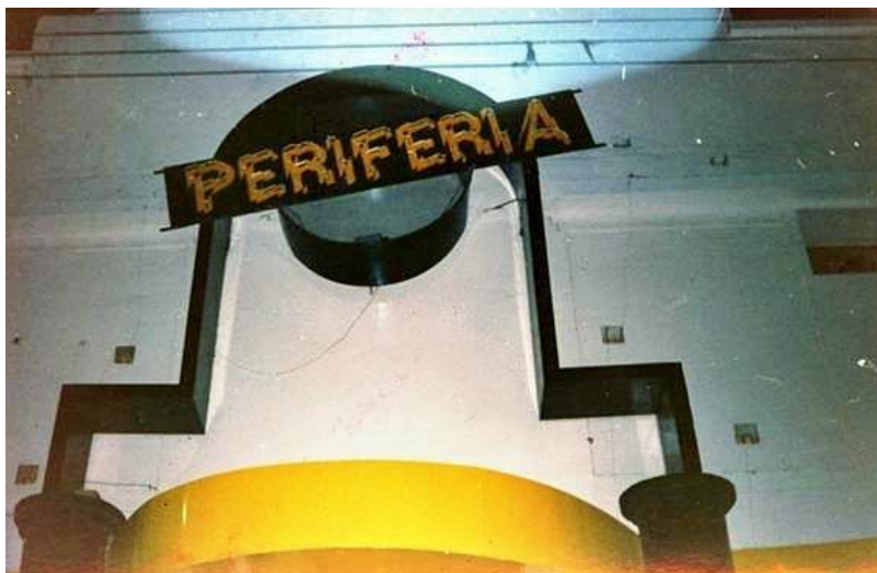
Figura 2: Fachada da Periferia

Assim, a Periferia se colocava como uma provocação em relação ao Éden já pelo seu nome, que tinha a proposta de aglomerar as diversidades, indo da questão social, econômica, etária e orientação sexual.