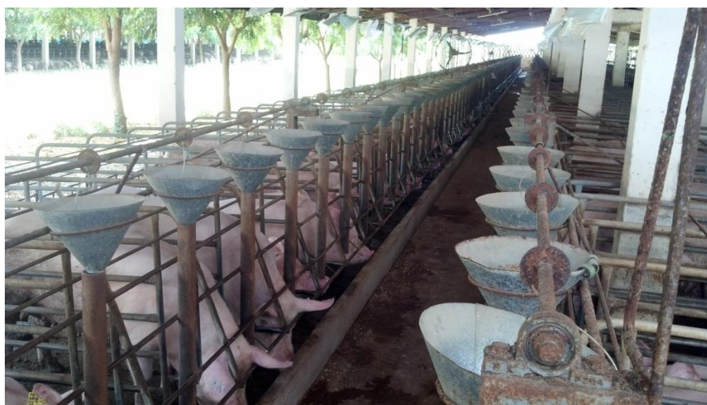
Figura 42: Galpão climatizado com sistema de ventilação por aspersão.

Ao serem transferidas para o galpão de gestação as fêmeas prenhes são vacinadas contra clostridiose, rotavírus, colibacilose e rinite atrófica e mantidas sob dieta de três quilos de ração de pré-lactação oferecida uma vez ao dia, no período da manhã, e água a vontade. Os galpões de gestação são equipados com sistema de arrefecimento por ventiladores e aspersores (Figura 42), onde a climatização é controlada, mantendo as fêmeas sempre em sua zona de conforto térmico e garantindo bons resultados durante essa fase da produção.