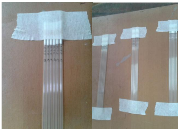
Figura 13: Identificação das palhetas e separação por tratamento.