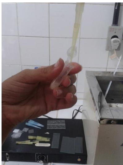
Figura 10C: Diluição do sêmen caprino.