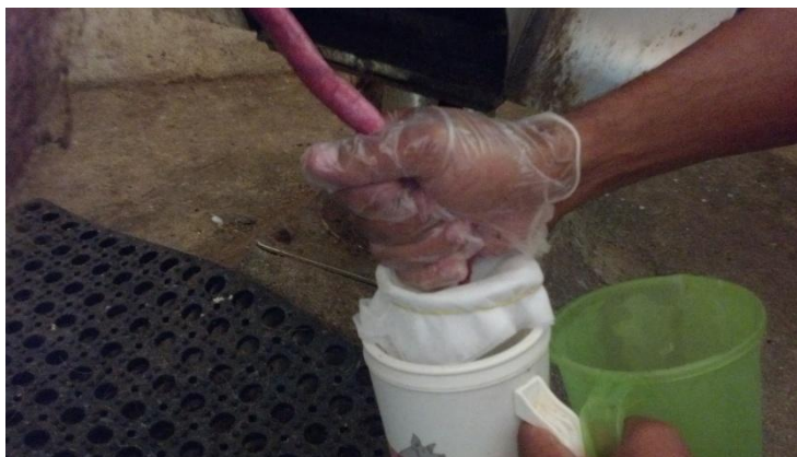
Figura 28: Coleta de sêmen (mão enluvada).

não deixando o sêmen entrar em contato com a luva, para isso, o coletor deixava a glândula do reprodutor livre sobre o copo de coleta. O ejaculado foi em torno de 400 ml.