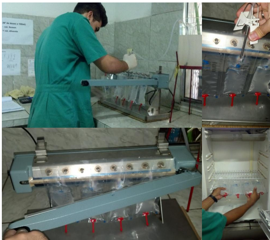
Figura 32: Embalagem e resfriamento do sêmen suíno.

Após a diluição, o sêmen diluído foi despejado em embalagens apropriadas para o resfriamento e adaptadas para a I.A., cada embalagem contendo 100 ml de sêmen. Após ser embalado, o sêmen armazenado uma geladeira adaptada para o procedimento de resfriamento, onde permaneceu em temperatura balanceada de 15 a 17°C (Figura 32).