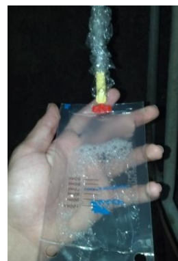
Figura 37: Deposição do sêmen