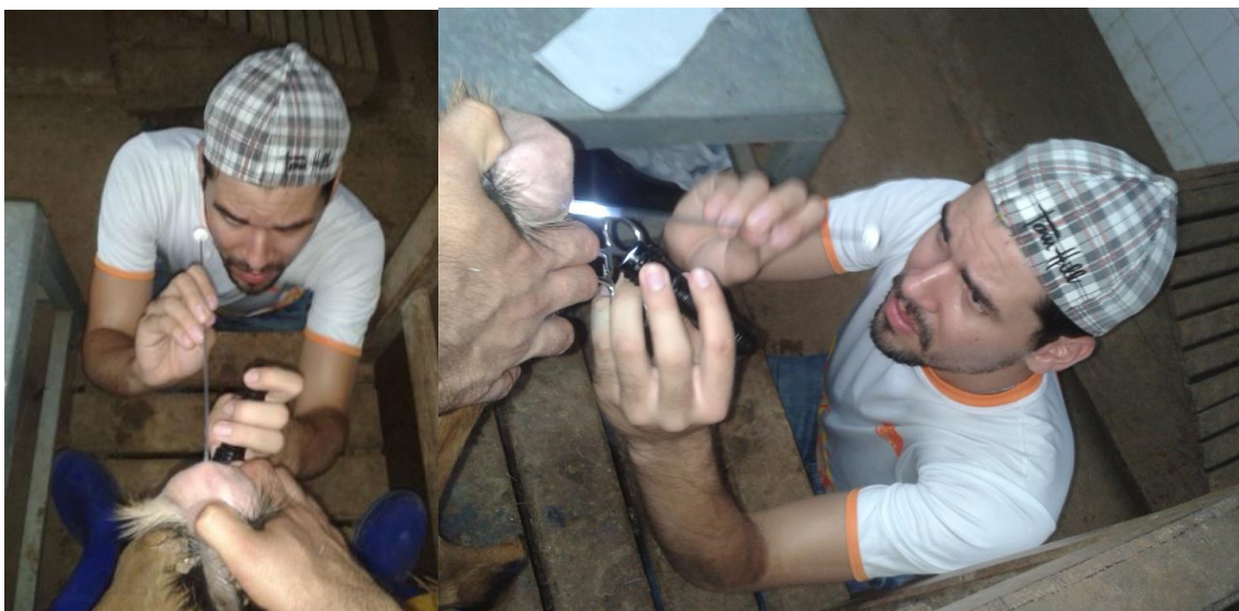
Figura 22: Inseminação artificial (I.A.) (cabra).