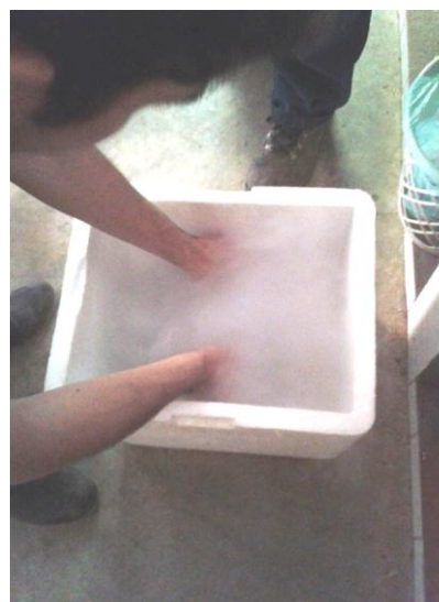
Figura 16: Deposição das palhetas no nitrogênio líquido.