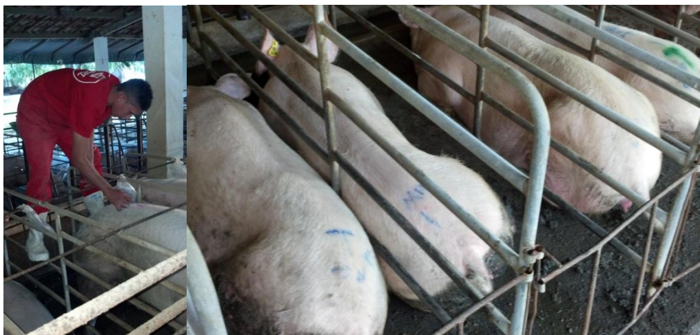
Figura 34: Marcação e separação das fêmeas com (DC positivo) para I.A.