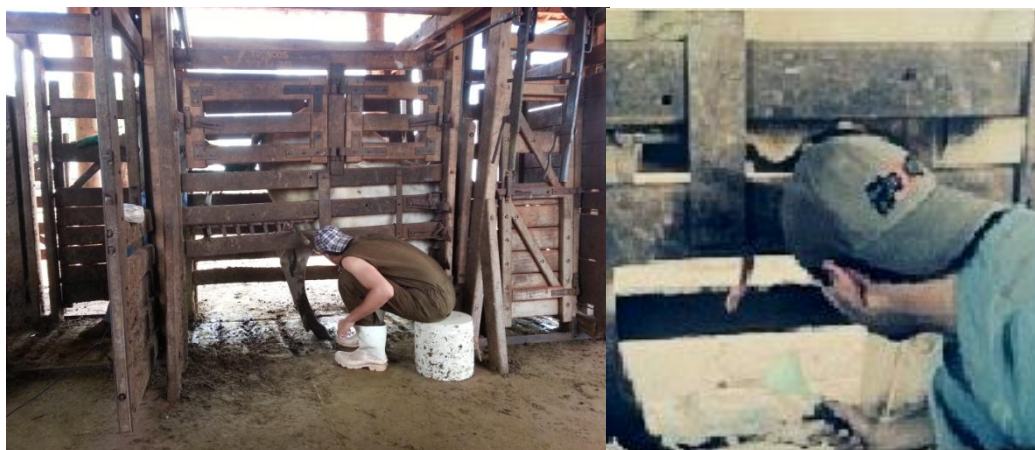
Figura 6: Coleta de Sêmen de tourinho por eletro ejaculação.