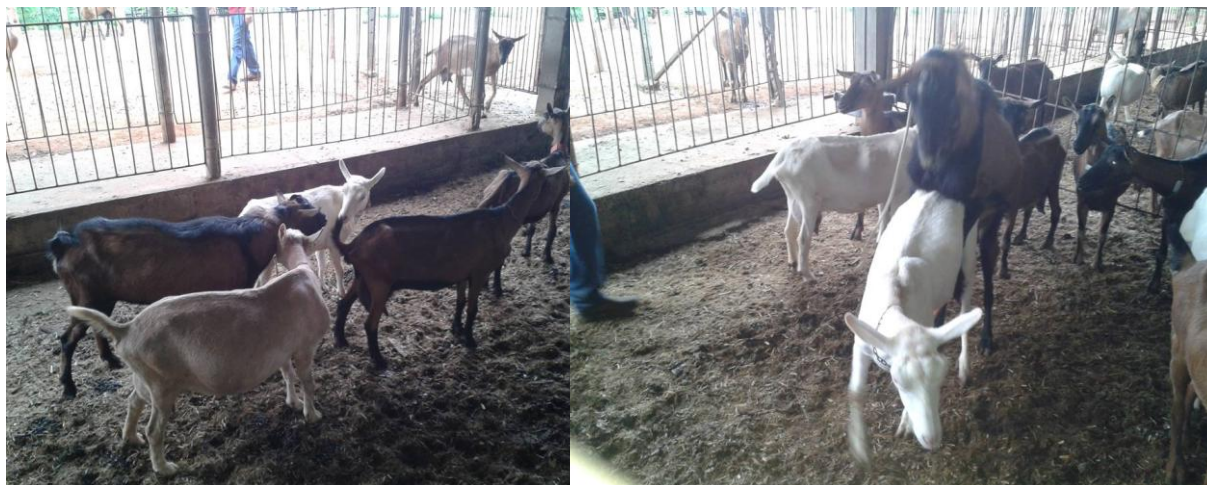
Figura 21: (DC positivo) fêmeas procuram o macho e aceitam a monta.