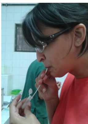
Figura 11: Preenchimento das palhetas por sucção.

Após a diluição, o sêmen foi novamente analisado e colocado nas palhetas por sucção (Figura 11). Cada conjunto de palheta (6 palhetas por tratamento) foi vedado com massinha de modelar de cores distintas (Figura 12) (a massinha foi escolhida para vedação pois era o material que mais resistia à criogenização) e identificadas quanto a numeração do reprodutor e o tratamento (Figura 13).