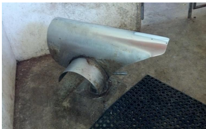
Figura 25: Manequim de aço inoxidável e tapete antiderrapante.

(Figura 26), e um copo de coleta (Figura 27), contendo um copo de plástico térmico de boca larga, um copo de Becker de 400 ml (recipiente onde o sêmen era depositado) cobertos por um filtro apropriado para impedir a entrada de gelatina e impurezas no sêmen coletado (fração rica). O recipiente utilizado para coleta protege o sêmen de variações bruscas de temperatura, bem como da incidência da luz solar ou artificial.