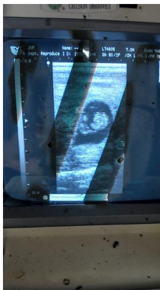
Figura 8: Diagnóstico de gestação positivo – Ultrassonografia Transretal.

corpo lúteo, e finalizar a fase luteínica. Após isso, inicia-se uma nova fase folicular, e o animal apresentará estro e ovulará. A fertilidade no cio induzido é semelhante à do estro natural (BARUSELLI, 2007).