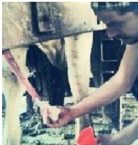
Figura 4: Exposição peniana.