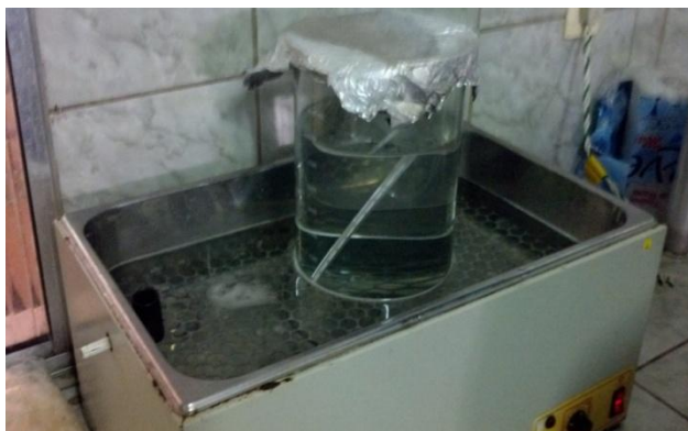
Figura 30: Diluente em banho maria.