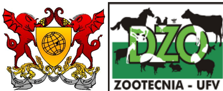
Figura 10A: Braço UFV e logomarca do Departamento de Zootecnia da UFV.

Durante duas semanas, acompanhei os procedimentos de coleta e congelamento de sêmen em machos, sincronização de estro, I.A e diagnóstico de gestação em fêmeas das raças Saanen e Pardo Alpina.