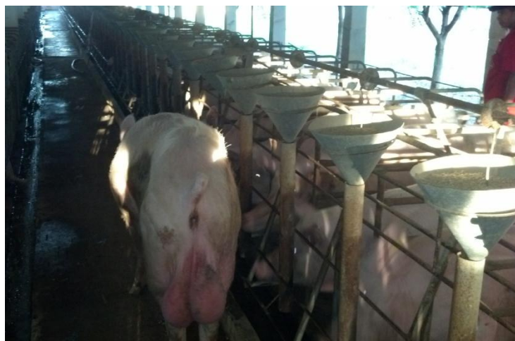
Figura 33: Passagem do macho para DC.

A detecção de cio (DC) ocorria diariamente e duas vezes ao dia nos horários mais frescos (entre 6 e 7 horas da manhã e entre 16 a 17 horas da tarde). Após a alimentação das fêmeas, os funcionários passavam o Varrão pelo galpão das porcas vazias (não prenhes) para o DC (Figura 33), onde, ao passar o macho, era observado o comportamento das fêmeas como a imobilidade na presença do macho, fêmeas urinando com frequência e em baixas quantidades e orelhas erguidas. Este processo envolve estímulos feromonais, auditivos, visuais e táteis, que afetam a liberação da ocitocina da hipófise nas matrizes e marrãs (MADEJ et al., 2005).