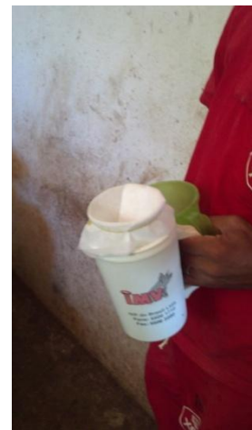
Figura 27: Copo de coleta.