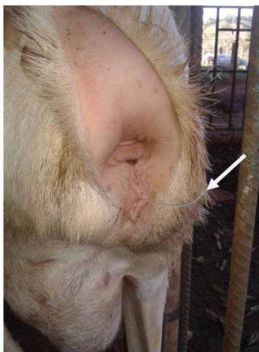
Figura 20: Fêmea com dispositivo intravaginal P4 implantado.