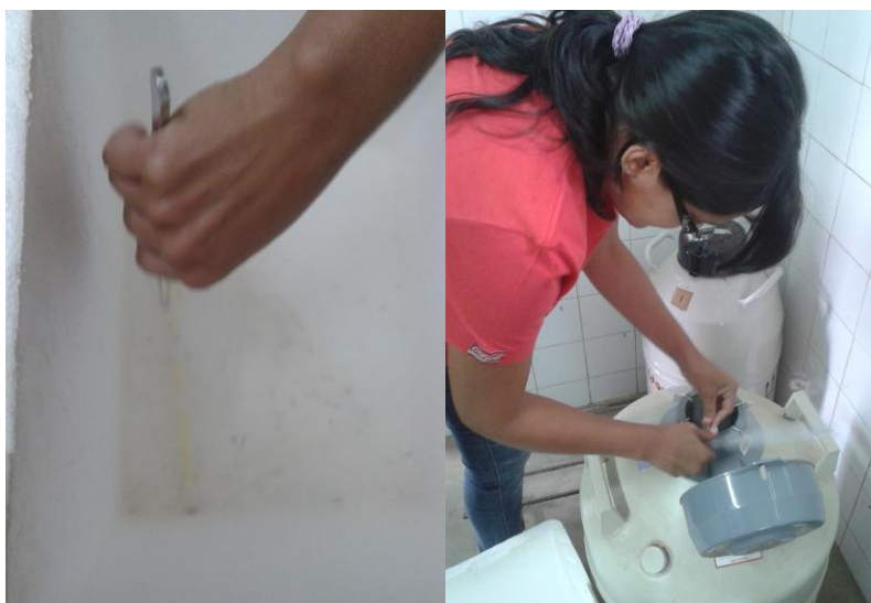
Figura 17: Manipulação das palhetas no nitrogênio líquido e armazenamento das doses no botijão.