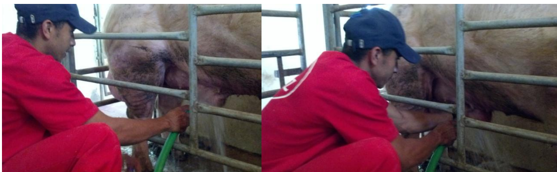
Figura 24: Limpeza do prepúcio do reprodutor.

A parte externa do prepúcio do reprodutor foi lavada com água corrente e detergente neutro e a parte de dentro foi lavada apenas com água corrente, eliminando qualquer tipo de resíduo (urina, sêmen etc) (Figura 24).