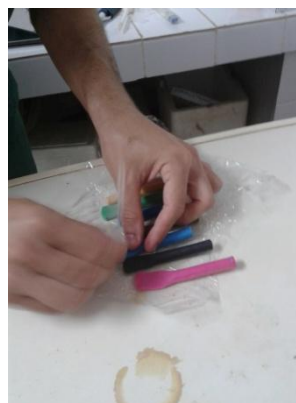
Figura 12: Vedação das palhetas com massinha colorida.