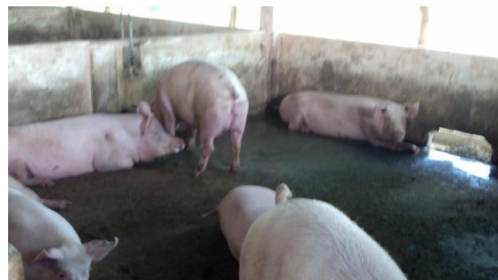
Figura 41: Baias coletivas.