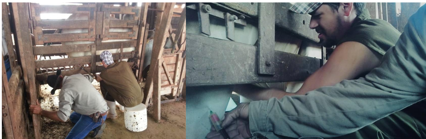
Figura 5: Coleta de sangue e sêmen realizadas simultaneamente.