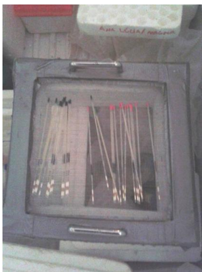
Figura 15: Rampa para pré-congelamento do sêmen.

Para o congelamento final das doses, foi utilizada uma caixa de isopor onde foi despejada uma quantia de nitrogênio líquido. Durante um período de 15 minutos, a rampa com as palhetas flutuou no nitrogênio líquido para promover um pré-congelamento das dosagens, que após esse período foram introduzidas no nitrogênio líquido (Figura 16) e ainda imersas, foram postas, de acordo com o tratamento nas raques e armazenadas no botijão de criogenia a -196^{\circ}\text{C} (Figura 17).