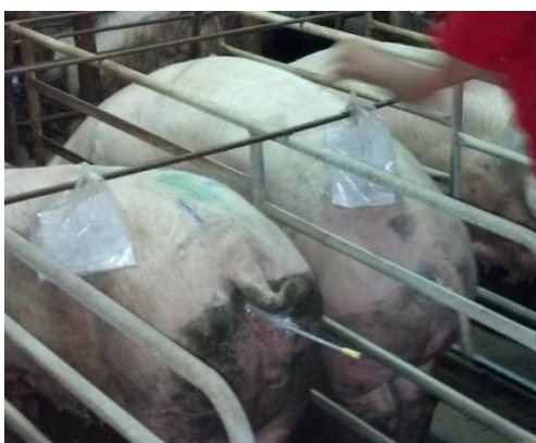
Figura 38: Permanência do aplicador evitando refluxo de sêmen.