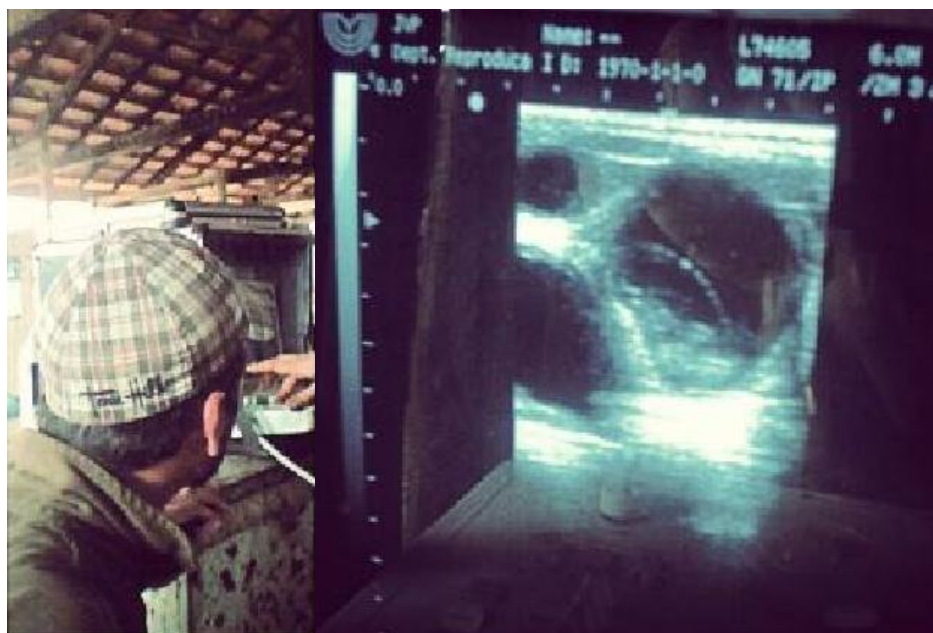
Figura 9: Acompanhamento no procedimento de avaliação das novilhas – Ultrassonografia Transretal.