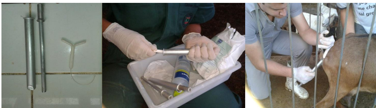
Figura 19: Dispositivo contendo P4 com aplicador, montagem e aplicação do dispositivo intravaginal.