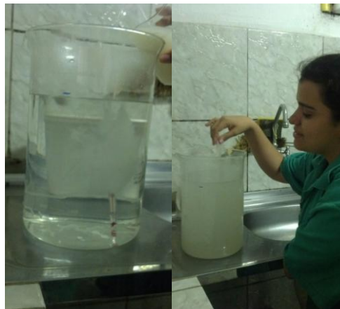
Figura 31: Diluição do sêmen suíno.