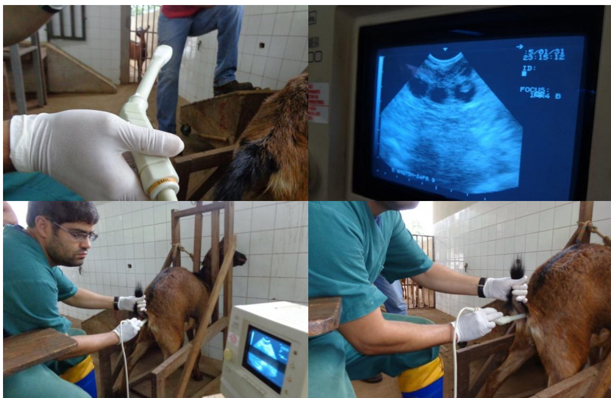
Figura 23: Probe utilizada na ultrassonografia transretal (DG positivo).

separadas para o procedimento de diagnóstico de gestação (DG). Estas fêmeas estavam no terço inicial da gestação, entre 35 e 50 dias após serem cobertas/inseminadas. O DG foi feito através de ultrassonografia em tempo real, via transretal (Figura 23). Este método é mais seguro (não invasivo) e rápida na determinação precoce de gestação na cabra (SIMÕES & POTES, 2001), mesmo quando comparada com outros métodos (GONZÁLEZ et al., 2004).