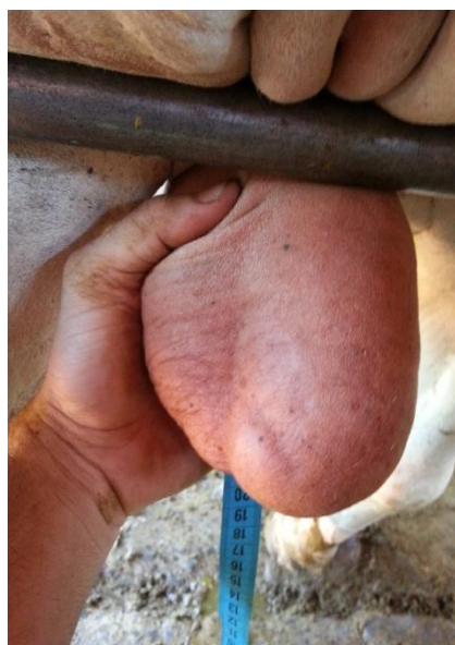
Figura 2B: Testículos assimétricos.