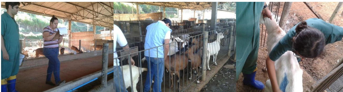
Figura 18: Registro, separação e marcação das fêmeas para o (Prot.1).