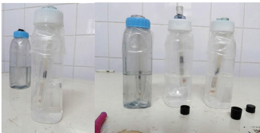
Figura 14: Recipientes adaptados para o resfriamento progressivo do sêmen.

O resfriamento foi realizado a +5^{\circ}\text{C} / 1h em um congelador convencional. Foram utilizados quatro recipientes adaptados para este procedimento. Cada recipiente era feito com uma mamadeira que continha álcool e um tubo de ensaio acoplado. Estes recipientes evitavam a queda brusca de temperatura das palhetas (Figura 14). O álcool é fundamental para o resfriamento progressivo, pois seu ponto de congelamento é maior que o da água, fazendo com que o resfriamento inicial das doses de sêmen seja lento, evitando choque térmico aos espermatozoides. A gema de ovo, presente no diluente, protege a membrana plasmática da célula espermática, restaurando fosfolipídios perdidos durante o choque térmico oriundo da mudança de temperatura que ocorre durante o resfriamento do sêmen (HAMMERSTEDT et al., 1990).