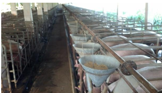
Figura 40: Gaiolas individuais.