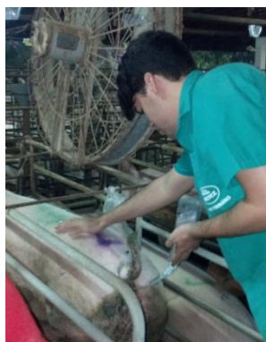
Figura 36: Inseminação (I.A.) (porca)