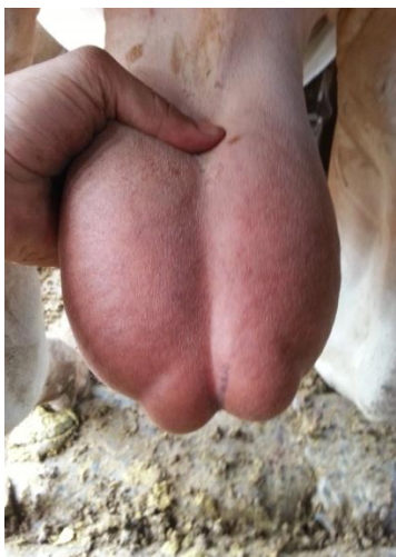
Figura 3: Análise da consistência testicular.