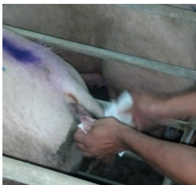
Figura 35: Limpeza da vulva da porca.