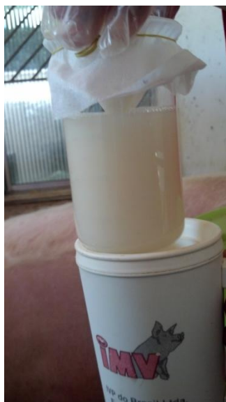
Figura 29: Copo de Becker contendo o ejaculado (fração rica).

Após a coleta, o sêmen, dentro do copo de Becker (Figura 29), foi posto em banho maria e mantido a uma temperatura de 37°C. Na granja só se faz a avaliação da motilidade do sêmen, pois o valor é utilizado nos cálculos para a diluição.