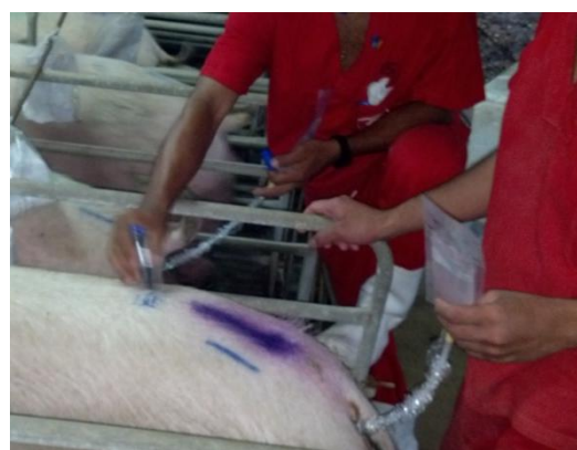
Figura 39: Marcação das fêmeas inseminadas.