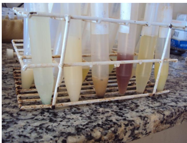
Figura 7: Análise de volume e aspecto do sêmen coletado.