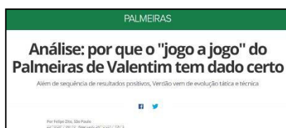
Figura 35 – Manchete após terceira vitória seguida.