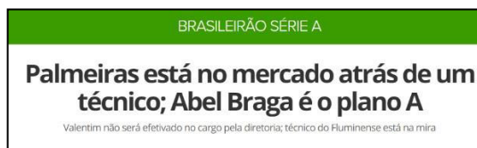
Figura 28 - Especulação da chegada de Abel Braga