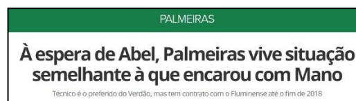
Figura 32 – Especulação de chegada de Abel e comparação com caso Mano

O interessante desse estudo é perceber o quanto um pequeno conjunto de resultados obtidos em um curto período de análise, leva a mídia a cometer até contradições em sua opinião sobre o trabalho de um treinador de Futebol. As figuras 33 e 34 demonstram exatamente isso. Após apenas 2 rodadas do Campeonato, o time comandado pelo treinador Cuca foi de um “Time Ideal” a um “Time não tem Nada”, confirmando a retórica entre heróis e vilões criadas pela mídia, entendida no trabalho de Bianchi e Hatje (2006).