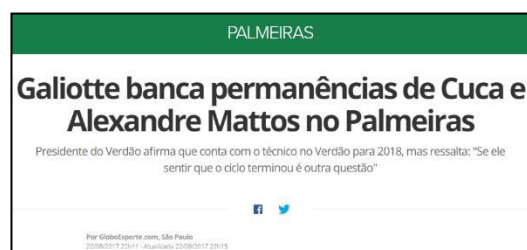
Figura 8 – Diretoria banca treinador