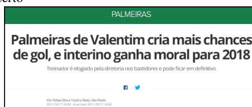
Figura 23 - Especulação da Permanência de Valentim e Justificativa