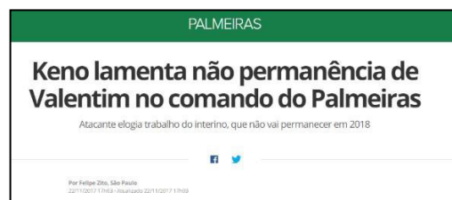
Figura 30 – Elenco lamenta não efetivação de Interino