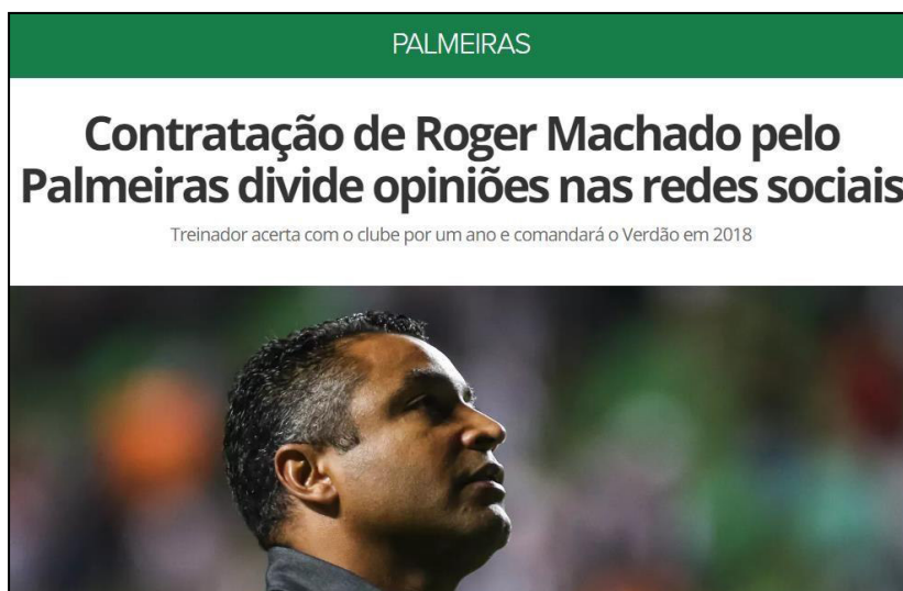
Figura 37 – Uso do termo “Redes Sociais” para aproximar o que o site pensa do que o público pensa.

Estas análises confirmam Betti (1997) quanto a lógica externa que existe no futebol e que a cada dia influencia ainda mais a lógica interna dos clubes, além disso, confirmamos o que foi dito por Hochmüller (2011), pois em todos os casos apresentados, o globoesporte.com produziu uma série de ideias sobre os treinadores, baseando-se principalmente nos resultados obtidos em curtos períodos, para serem interpretadas como discursos e modelos absolutos, únicos e verdadeiros, desestimulando a reflexão e confronto crítico, ferindo até mesmo aspectos éticos e morais. Outro aspecto a ressaltar, foi ilustrado pelo termo “Redes Sociais”, como aparece na Figura 37, ao apresentar algo comum com o torcedor que frequenta tais meios midiáticos.