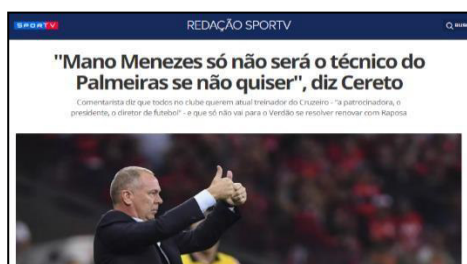
Figura 15 – Especulação sobre a chegada de Mano