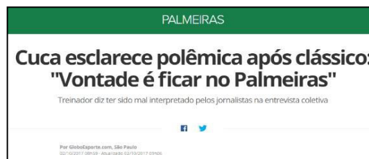
Figura 12 – Especulação retorna com derrota