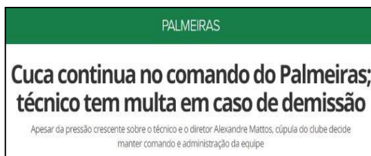
Figura 5 – Especulação de Saída e Justificativa Para a Não Saída

por exemplo, utiliza-se diversos argumentos, como apresentado entre as Figuras 5 e 14. Somente durante o Segundo Turno de 2017, em um período de exatos dois meses e de 8 rodadas, foram especuladas por 10 vezes sua saída, onde por diversas vezes, a diretoria teve que atuar e afirmar que sua demissão não fazia parte do programado.