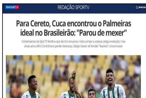
Figura 33 – Manchete após vitória fora de casa contra o Fluminense vindo de outra vitória diante o Curitiba – Rodada 25.

O interessante desse estudo é perceber o quanto um pequeno conjunto de resultados obtidos em um curto período de análise, leva a mídia a cometer até contradições em sua opinião sobre o trabalho de um treinador de Futebol. As figuras 33 e 34 demonstram exatamente isso. Após apenas 2 rodadas do Campeonato, o time comandado pelo treinador Cuca foi de um “Time Ideal” a um “Time não tem Nada”, confirmando a retórica entre heróis e vilões criadas pela mídia, entendida no trabalho de Bianchi e Hatje (2006).