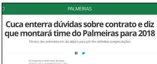
Figura 11 – Especulação de Saída encerrada