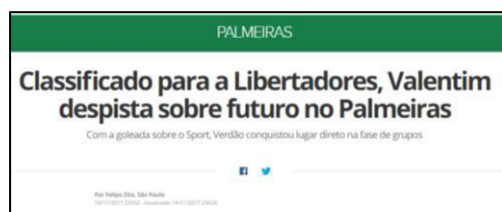
Figura 25 - Especulação da Permanência de Valentim