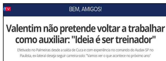
Figura 26 – Negativa de Interino em caso de chegada de novo treinador.