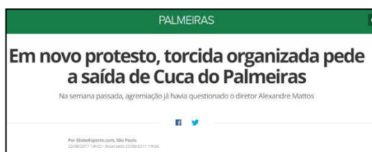
Figura 7 – Especulação de Saída a pedido da Torcida