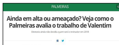
Figura 36 – Manchete após segunda derrota seguida

Estas análises confirmam Betti (1997) quanto a lógica externa que existe no futebol e que a cada dia influencia ainda mais a lógica interna dos clubes, além disso, confirmamos o que foi dito por Hochmüller (2011), pois em todos os casos apresentados, o globoesporte.com produziu uma série de ideias sobre os treinadores, baseando-se principalmente nos resultados obtidos em curtos períodos, para serem interpretadas como discursos e modelos absolutos, únicos e verdadeiros, desestimulando a reflexão e confronto crítico, ferindo até mesmo aspectos éticos e morais. Outro aspecto a ressaltar, foi ilustrado pelo termo “Redes Sociais”, como aparece na Figura 37, ao apresentar algo comum com o torcedor que frequenta tais meios midiáticos.