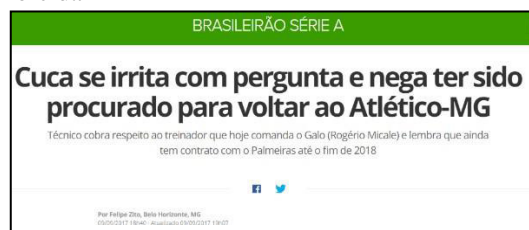
Figura 9 – Especulação de Saída para outro time