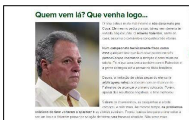
Figura 29 – Imprensa exige novamente definição imediata de novo treinador