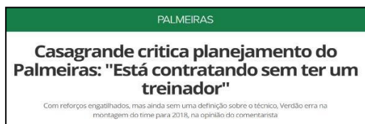
Figura 27 – Imprensa exige definição imediata de novo Treinador