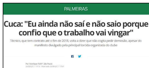
Figura 6 – Cuca justifica provável não saída