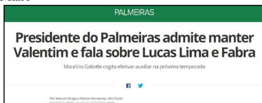
Figura 17 - Especulação da Permanência de Valentim