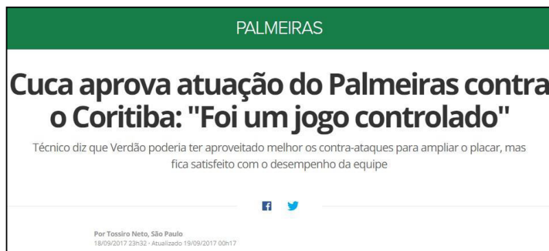
Figura 38 - Notícia sobre o modo de jogar

Apesar da análise quantitativa apresentar que o maior número de notícias está direcionado ao fator esportivo, ou seja, ao modo da equipe jogar, é perceptivo que todas as notícias vinculadas durante o Segundo Turno, buscaram avaliar o trabalho do treinador da equipe, questionando sempre que possível e indicando caminhos, ou seja, desenhando uma influência indireta no modo de trabalhar do profissional. Além disso, podemos avaliar que as notícias esportivas se evidenciam em um período que denomino “Período de Sossego”, quando a equipe apresentou uma sequência positiva de resultados, e logo, as críticas são reduzidas, porém retornando logo após uma curta sequência ruim.