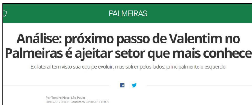
Figura 39 – Jornalista indica que o treinador deve corrigir os erros na Lateral.

Também é evidente que uma equipe não é avaliada somente pelo que demonstra em campo durante o transcorrer da temporada, mas por uma perspectiva inicial que a mídia coloca sobre este, a partir de uma soma de valores que analisam o elenco, o orçamento e o histórico que o clube possui para aquela temporada. Em trecho de matéria sobre o Campeonato Brasileiro de 2017, anterior o início do evento, vinculado no Globoesporte.com, verificamos exatamente isto, a Sociedade Esportiva Palmeiras foi considerada favorita a ganhar a competição: