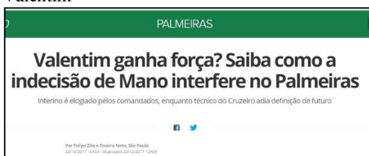
Figura 19 - Especulação da Permanência de Valentim