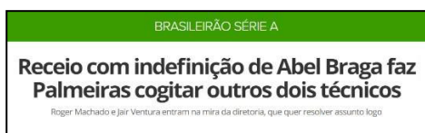
Figura 31 – Especulação de Negativa de Abel