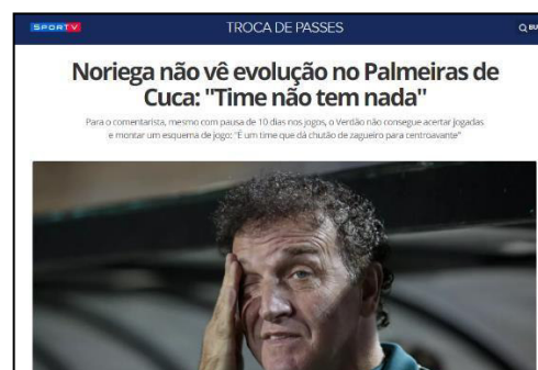
Figura 34 – Manchete após empate em casa contra o Bahia vindo de uma derrota para o Santos – Rodada 27