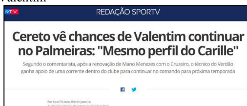
Figura 21 - Especulação da Permanência de Valentim e comparação com exemplo que deu certo