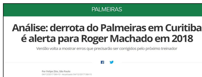
Figura 40 – Pressão para a temporada 2018 registrada da penúltima Notícia coletada em 2017.

Após a apresentação e a discussão dos dados nas oito categorias elencadas, apontamos algumas considerações finais sobre esta pesquisa.