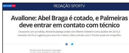
Figura 22 – Especula-se novo treinador após derrota em clássico