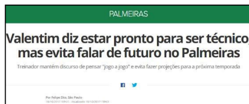
Figura 18 - Especulação da Permanência de Valentim