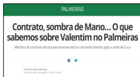
Figura 16 – Especulação da Permanência de Valentim