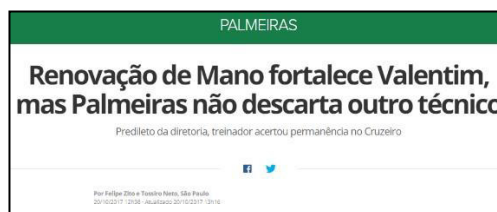
Figura 20 - Especulação da Permanência de Valentim e Negativa de Mano