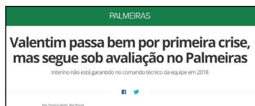
Figura 24 - Especulação da Permanência de Valentim