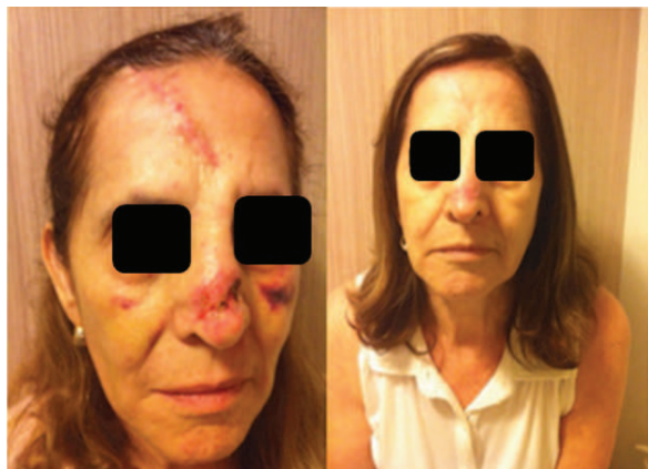
Figura 3. Pós-operatório 1 e 4 meses, respectivamente.