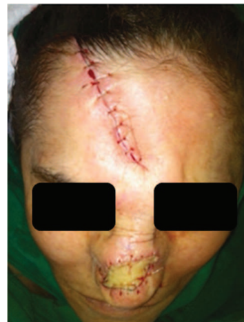
Figura 2. Pós-operatório imediato.