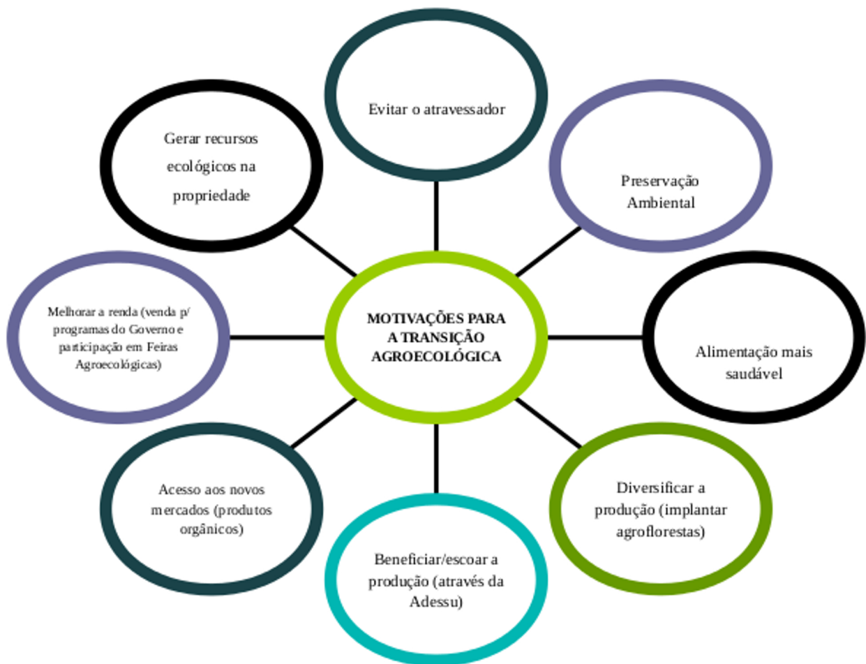
Figura 1: Esquema das motivações para a realização da transição agroecológica do grupo pesquisado

Entretanto, ainda que se reconheça que as preocupações dos agricultores familiares de Santa Cruz da Baixa Verde girassem em torno do caráter predatório da agricultura convencional e dos custos excessivos dos insumos a ela relacionados, constatou-se que as ações do grupo pesquisado moviam-se também em torno de questões ligadas à saúde e ao bem-estar do produtor e de sua família e, principalmente, em torno da preocupação com a possibilidade de garantir maior rendimento econômico permitido por um mercado em rápido crescimento.