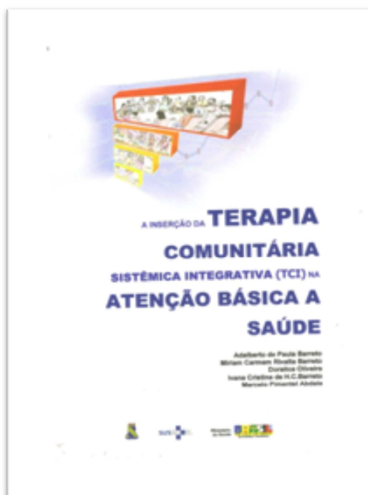
Figura 8 - Capa da cartilha pedagógica produzida no Convênio nº 2397, de 2008, firmado entre o Ministério da Saúde, a Fundação Cearense de Pesquisa e Cultura e a Universidade Federal do Ceará