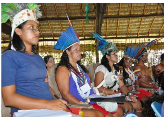
Figura 5 – Alunos do Curso de Formação de Terapia Comunitária Integrativa para Lideranças Indígenas com Ênfase na Temática de Álcool e Drogas ministrado em Morro Branco-Beberibe, Ceará, 2010.

Participaram das rodas de TCI facilitadas pelos cursistas indígenas, em 2010 e 2011, 14.889 moradores das aldeias. Os temas apresentados e as estratégias de enfrentamento dos problemas foram registrados pelos alunos. Os temas que sobressaíram foram: alcoolismo (27,9%); estresse (18,5%) e conflitos familiares (14,7%). As principais estratégias de enfrentamento utilizadas foram: participar da Terapia Comunitária Integrativa (24,4%); buscar ajuda religiosa ou espiritual (17,1%) e buscar redes solidárias (15,8%). A TCI se mostrou novamente um recurso terapêutico de atenção ao uso de drogas, tanto pela exposição direta do tema, a exemplo do alcoolismo, ou de outras questões que podem ser relacionadas a problemas advindos do uso indevido de drogas, como o estresse e os conflitos familiares (BRASIL, 2011).