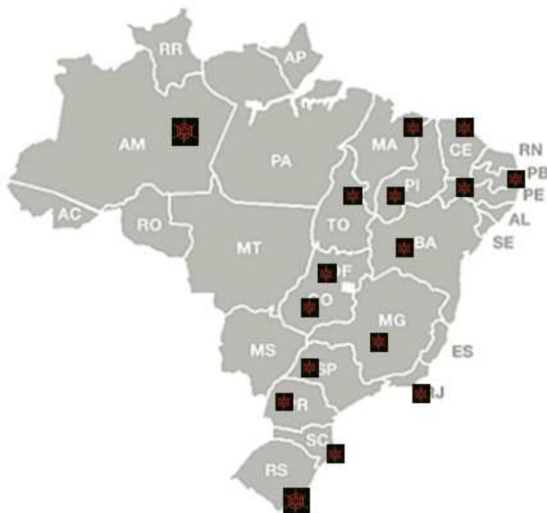
Figura 1 – Estados brasileiros que possuem polos de formação

Foram criados polos de formação em todas as regiões do país. A distribuição dos mesmos é apresentada na figura 3 e mais bem discriminada no quadro 4. O maior número de polos encontra-se na região Sudeste, num total de 30 instituições. Desses, 21 (vinte e um) estão no Estado de São Paulo, sendo 14 (quatorze) na capital e 7 (sete) no interior.