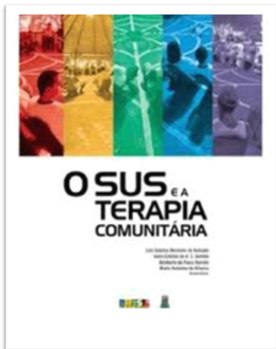
Figura 7 – Capa da cartilha pedagógica produzida no Convênio nº 3363, de 2007, firmado entre o Ministério da Saúde, a Fundação Cearense de Pesquisa e Cultura e a Universidade

Qualquer processo de mudança nos atores da atenção básica provoca impacto na sua atuação, modificando a assistência prestada à comunidade....podemos observar que a formação [em TCI] promove uma mudança interna, consistente e amadurecida, que inevitavelmente impacta na sua relação com o outro, seja usuário da ESF ou colega de equipe, culminando na sintonia necessária para uma prática diferenciada.