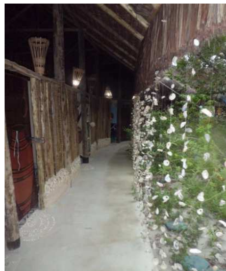
Figura 4 - Interior da Oca de Saúde Indígena para sessões de massoterapia na Aldeia Pataxó – Coroa Vermelha, BA

Participaram da formação em Terapia Comunitária 35 indígenas das etnias Ticuna (Norte), Munduruku (Norte), Desano (Norte), Tariano (Norte), Pataxó (Nordeste), Pitaguary (Nordeste), Tapeba (Nordeste), Kaingang (Sul), Kaiowá (Centro Oeste), Terena (Centro Oeste), Guarani (Centro Oeste), Xacriabá (Sudeste) e