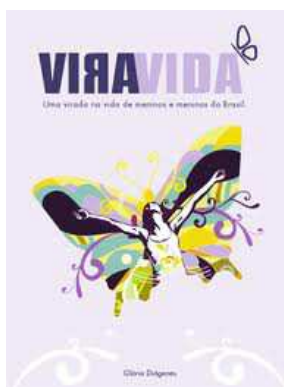
Figura 11 – Capa da publicação do Programa Vira Vida do SESI

Em âmbito nacional, a TCI foi implantada pelo Conselho Nacional da Indústria do Serviço Social da Indústria (CNI/SESI) no Programa Vira Vida. Trata-se de um programa social do SESI, criado em 2008, que visa contribuir para a elevação da autoestima e da escolaridade de adolescentes e jovens de 16 a 21 anos em situação de exploração sexual, com o objetivo de que eles reconheçam seu próprio potencial e conquistem autonomia pela participação em ações de profissionalização, escolarização e