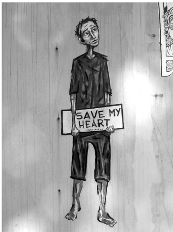
Fig. 3: Sem identificação

Consegui encontrar em vitrinas, paredes das principais vias, colagens alusivas à mesma assinatura. Ao retornar a Lisboa em 2013, já iniciando a pesquisa do pós-doutorado, deparei-me com outras imagens produzidas por Tinta Crua.