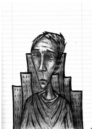
Fig. 1: Sem identificação (imagem cortesia do artista da obra, Tinta Crua, 2013)