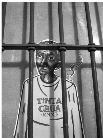
Fig. 4: Sem identificação

Autoria de Tinta Crua