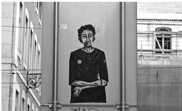
Fig. 5: Sem identificação Autoria de Tinta Crua

Havia, entre elas, expressões de apelo, pedidos de socorro, alusão a dor, sangue e silêncio. As primeiras anotações de campo (DIÓGENES, 2013f), efetuadas no mês de março de 2013, sinalizam a minha percepção acerca da intensidade de uma arte que ocupa, à revelia, o coração de Lisboa: