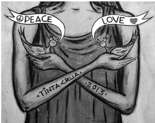
Fig. 6: Sem identificação (imagem cortesia do artista da obra, Tinta Crua, 2013)

Acompanhei os passos de Tinta Crua não apenas face a face: passei a visitá-lo, quase que diariamente, em sua página do facebook . 8 Como veremos no próximo tópico, o cerco em Lisboa vai, cada vez mais, fechando-se para a arte considerada ilegal, sem a licença da Câmara Municipal. No dia 9 de setembro de 2013, Tinta Crua publica uma imagem na sua página e ela faz eclodir um debate sobre o tema em voga: