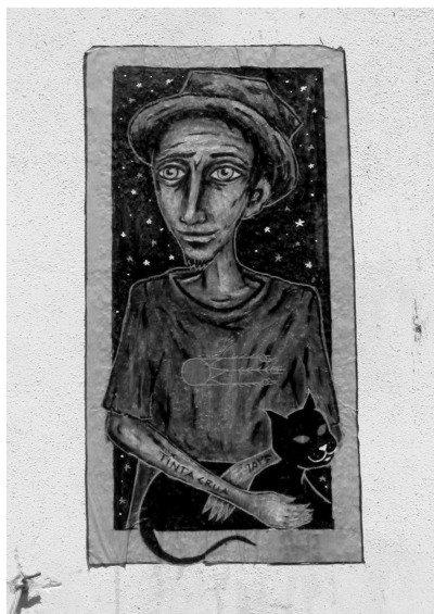
Fig. 8: Sem identificação Autoria de Tinta Crua (Fotografia de Tinta Crua, 2013)

Como é que vais fazer a partir de agora? Passas a dirigir-te ao GAU-CML para solicitares autorizações específicas para cada projecto que tenhas e ficas a aguardar que as aprovem... ou manténs-te na mesma toada? 13