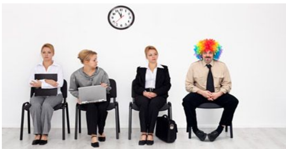
Figura 1: Captada de http://pt.wix.com/blog/2012/11/entrevista-de-emprego-como-se-preparar-para-a-segunda-fase .

Em seguida, a professora projetou duas imagens, cujo objetivo era discutir com os alunos o que poderia ser adequado ou inadequado em situações de busca de emprego, como podemos ver a seguir: