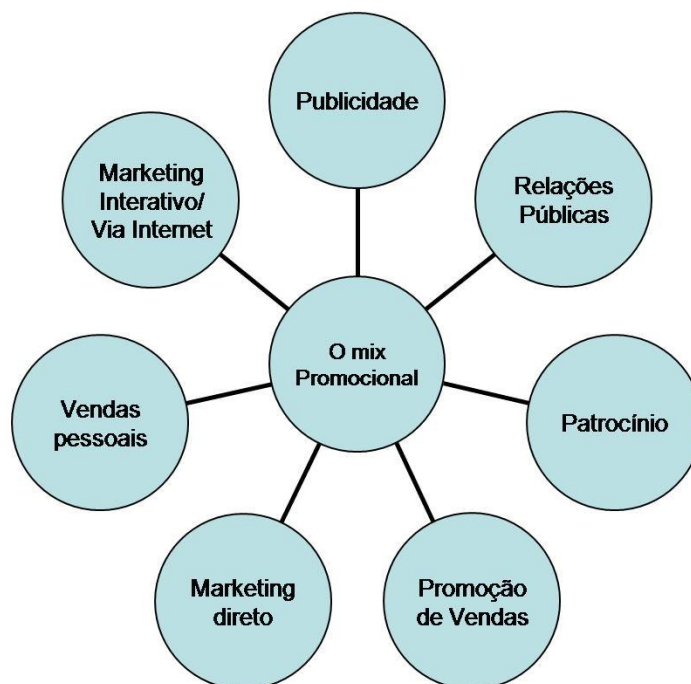
Figura 1: O mix promocional.