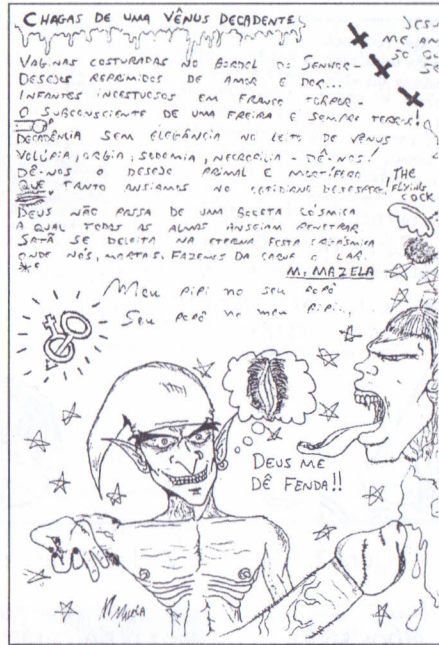
Figura 1: Página do fanzine Sexoxes .

também o profano e onde há livros "nobres", há também folhetos "infames".