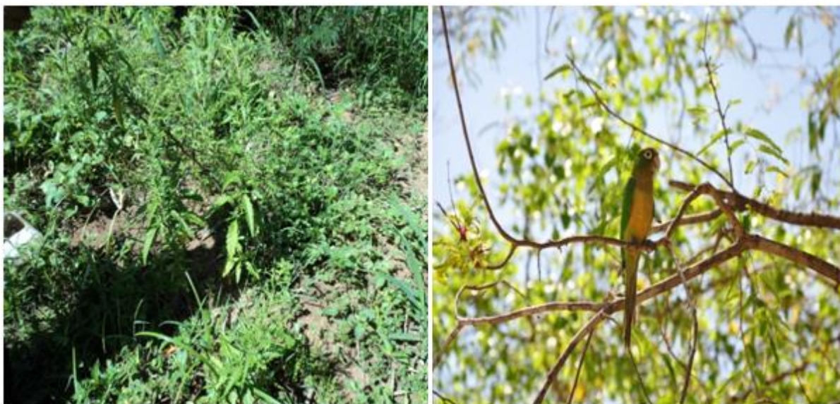
Figura 6: plantas medicinais (I) e pássaro (J).

De acordo com um levantamento feito pela ACB, o sistema agroflorestal da família de Zé Arthur apresenta uma variedade de plantas medicinais, com destaque para as espécies Chenopodium ambrosioides L. (mastruz), Melissa officinalis (erva cidreira), Cymbopogon citratus (capim santo), Bauhinia forficata (pata de vaca), Phyllanthus niruri L. (quebra pedra), Punica granatum L. (romã), Eugenia uniflora L. (pitanga), Spondias purpurea (seriguela), Ziziphus joazeiro (juazeiro), entre outras (Fig. 6.L). Nele também se registra a presença de animais silvestres a exemplo de Cavia aperea (preás), Myrmecophaga tridactyla (tamanduá), Didelphis sp. (raposa), Leopardus tigrinus (gato do mato), Euphractus sexcintus (tatu), etc., e pássaros como: Crypturellus parvirostris (nambu), Columbus leptopila (juriti), Scardafellas quammata (rolinha) (Fig. 6. J).