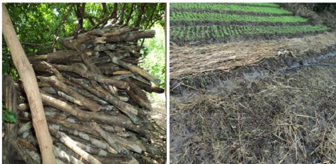
Figura 4: lenha (E) para consumo doméstico e plantação de coentro (F).

produção de composto orgânico, que serve de adubo, sendo este utilizado nos canteiros para produção de hortaliças (Fig. 4F).