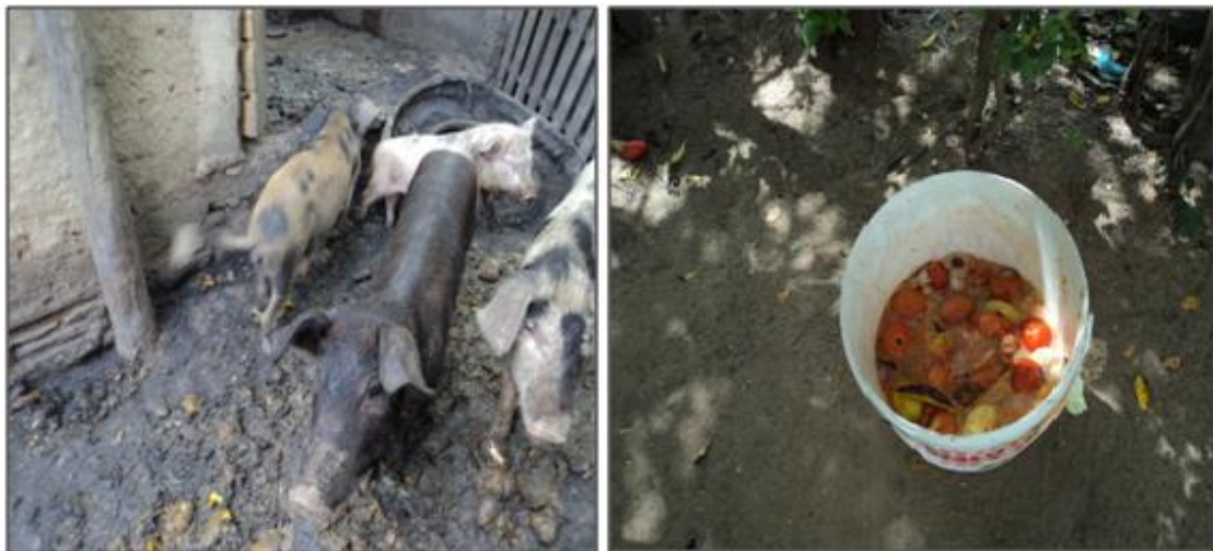
Figura 3: Criação de suínos (C), frutas nativas para alimentação dos suínos (D).

O SAF do senhor Zé Artur apresenta uma integração e utilização de todos os elementos orgânicos e inorgânicos, obtendo o desenvolvimento social e sustentável. Isto ocorre porque o referido sistema preserva a fauna e flora, além de gerar uma renda familiar, fruto da comercialização de produção agrícola excedente e de animais, a exemplo de suínos, criados em pocilga (Fig. 3C) e alimentados com as frutas produzidas na propriedade (Fig. 3D).