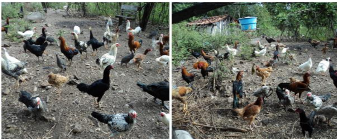
Figura 5: Dezenas de galinhas Gaipiras (G), que se alimentam com sobras das hortaliças (H).

No SAF da família de Zé Arthur, no momento da pesquisa, existia uma criação de aves com aproximadamente 60 galinhas caipiras (Fig. 5. G), tratadas sanitariamente com vermífugo natural e criadas num piquete, construído no modelo orgânico. A alimentação dessas aves era feita com milho e sobras de hortaliças (Fig. 5H), produzidas na propriedade, tudo isso articulado com o sistema de agricultura de baixo carbono. Esse modelo é de forma abrangente e holística, promovendo a integração de todos os elementos. Essas galinhas têm uma produção de cerca de 100 ovos por mês, que são destinados ao consumo doméstico.