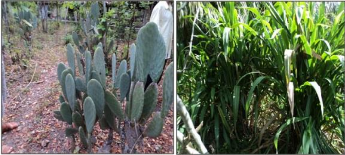
Figura 2: Plantação de palma (A) e capim elefante(B).

O SAF do senhor Zé Artur apresenta uma integração e utilização de todos os elementos orgânicos e inorgânicos, obtendo o desenvolvimento social e sustentável. Isto ocorre porque o referido sistema preserva a fauna e flora, além de gerar uma renda familiar, fruto da comercialização de produção agrícola excedente e de animais, a exemplo de suínos, criados em pocilga (Fig. 3C) e alimentados com as frutas produzidas na propriedade (Fig. 3D).