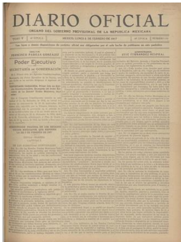
Gráfico 1 – Constituição do México de 1917