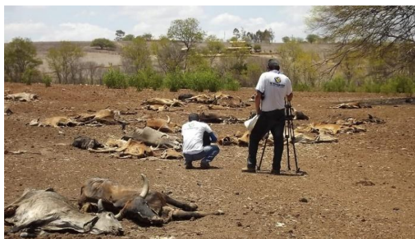
Imagem 4 – Jornal A Notícia, fotografia da maior seca dos últimos 60 anos, sertão castigado e destruição da economia rural no Nordeste (abril de 2013)

http://jornalanoticia.com/portal/a-maior-seca-dos-ultimos-60-anos-destroi-economia-rural-no-nordeste/