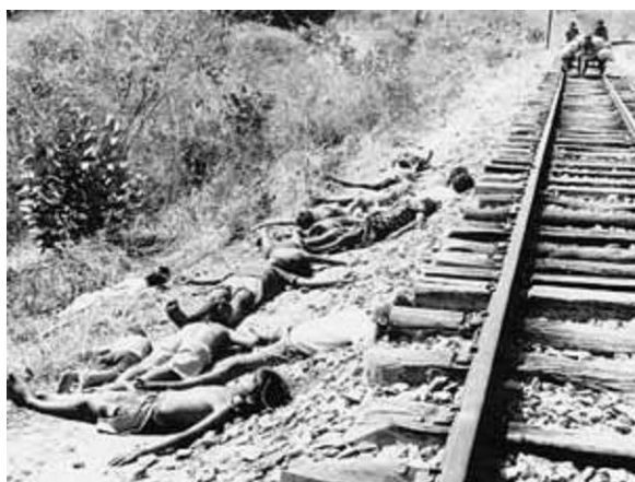
Imagem 3 – Museu de Imagens – fotografia das vítimas da seca de 1932. Crianças e adultos jazem ao lado da linha férrea que levava para o Campo de concentração de Senador Pompeu. De forma assustadoramente parecida, as cenas brasileiras dos currais humanos lembravam bastante os campos de concentração nazistas.

http://www.museudeimagens.com.br/grande-seca-do-nordeste/