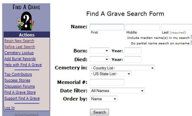
Figura 2 – Ferramenta de busca