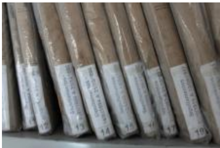
Figura 3 – Livros de registros de sepultamentos – Cemitério São João Batista